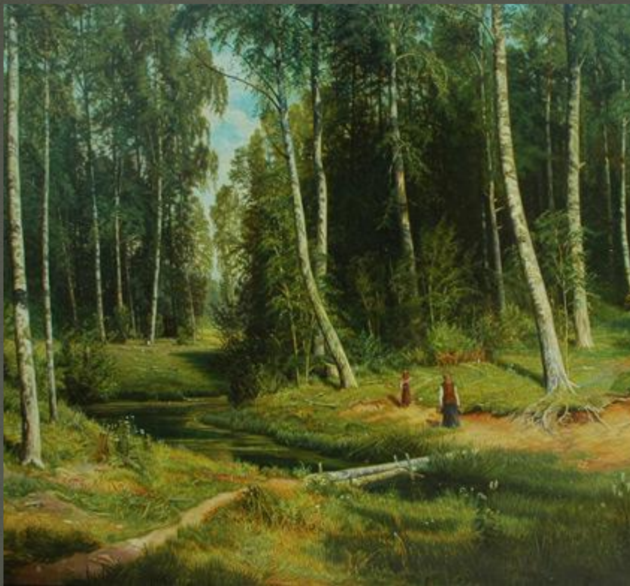
«Ручей в Березовом лесу»