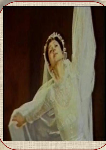
Е.Максимова в балете «Анюта»