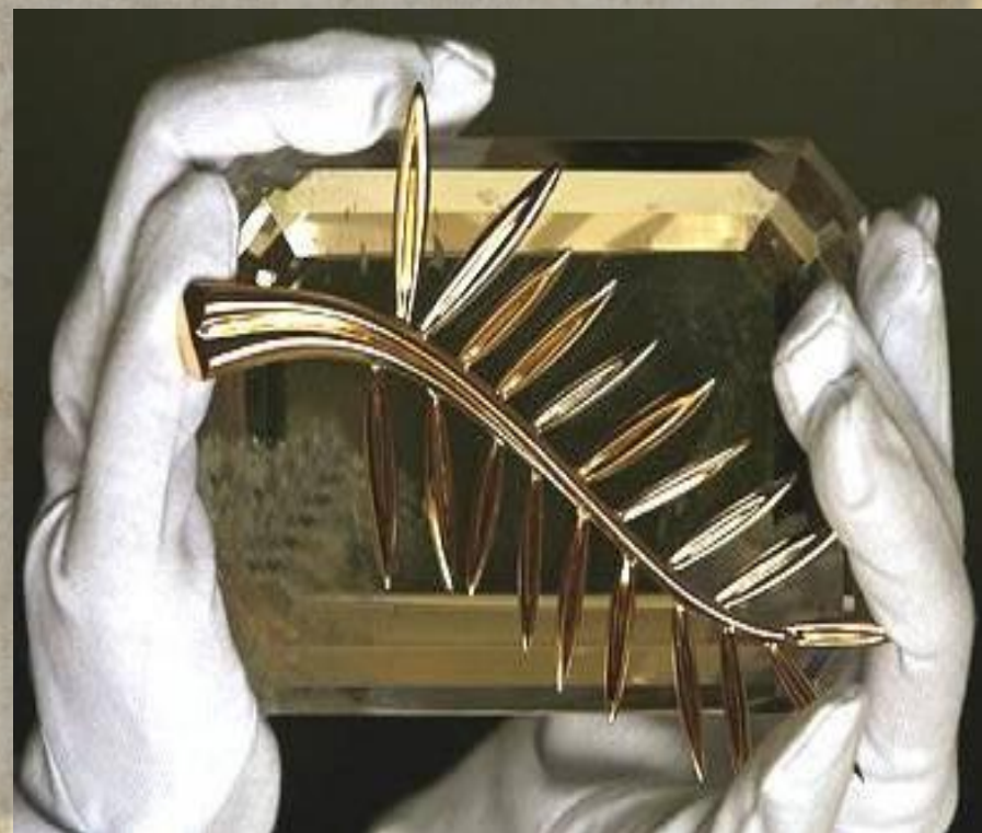
Приз кинофестиваля «Золотая оливковая ветвь»