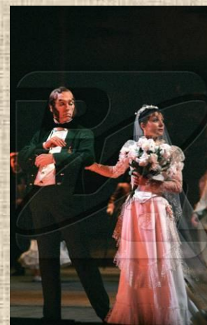
Е.Максимова и М. Цивин в балете «Анюта»