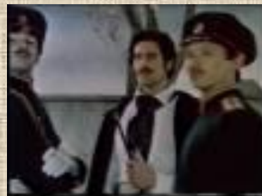
Сцены из балета «Анюта»