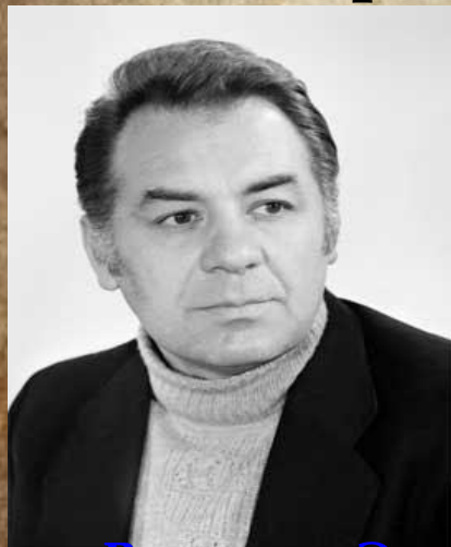
Режиссер Э. Лотяну

Вряд ли кого-то оставит равнодушным фильм режиссера Эмиля Лотяну «Мой ласковый и нежный зверь», снятый по повести «Драма на охоте»