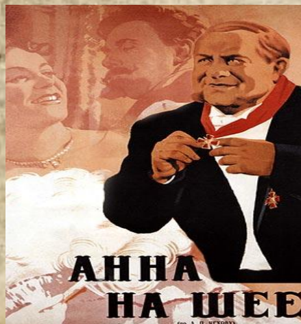
Афишы к к/ф «Анна на шее»