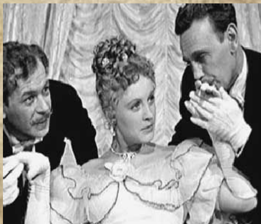
Кадр из к/ф «Анна на шее»