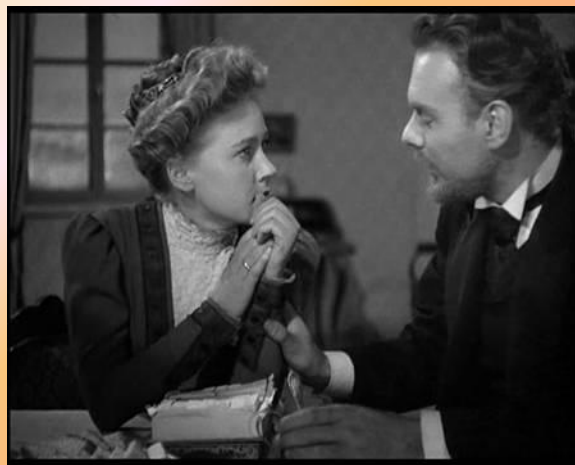
Кадры из к/ф «Дама с собачкой»