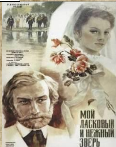
Афиша к/ф «Мой ласковый и нежный зверь»