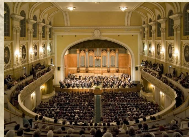
Одесский оперный театр