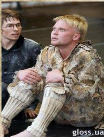
Сцены из балета «Палата №6»