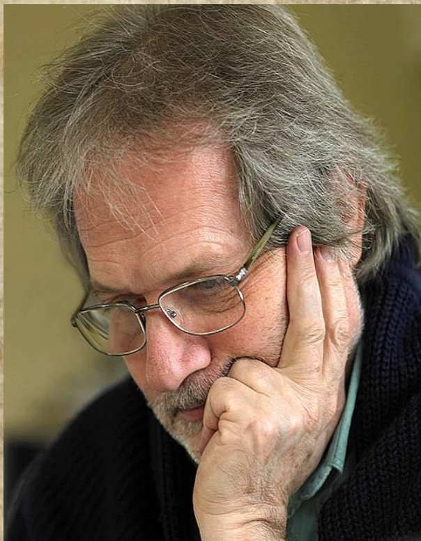
Петер Этвеш, композитор