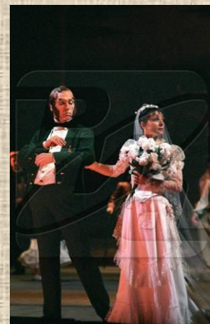
Е.Максимова и М. Цивин в балете «Анюта»