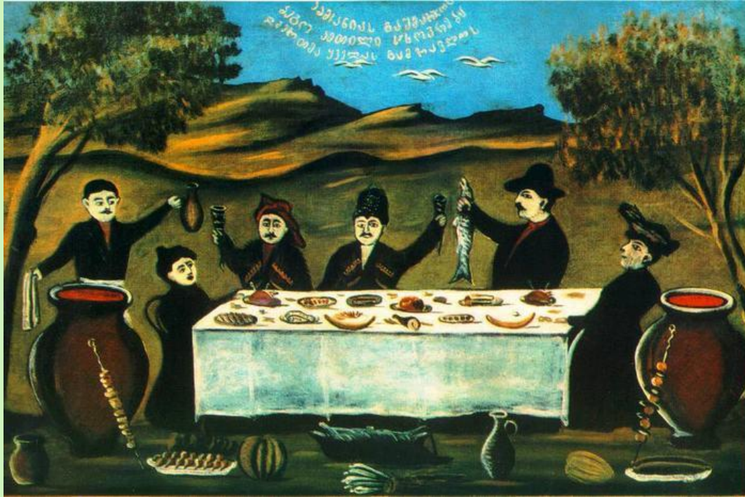
Нико Пиросмани «Пикник»