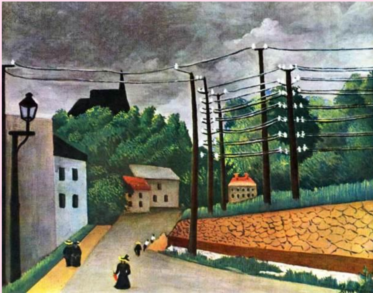
Руссо, Анри. Малакоф. 1898. 45,7 x 55,2 см. Масло. Примитивизм. Постимпрессионизм. Франция