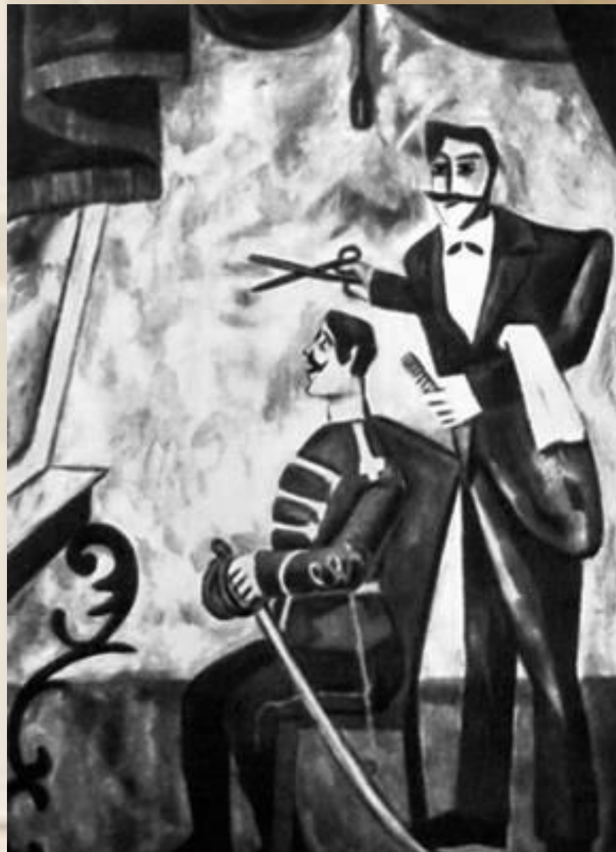
Ларионов М. Ф. "Офицерский парикмахер".