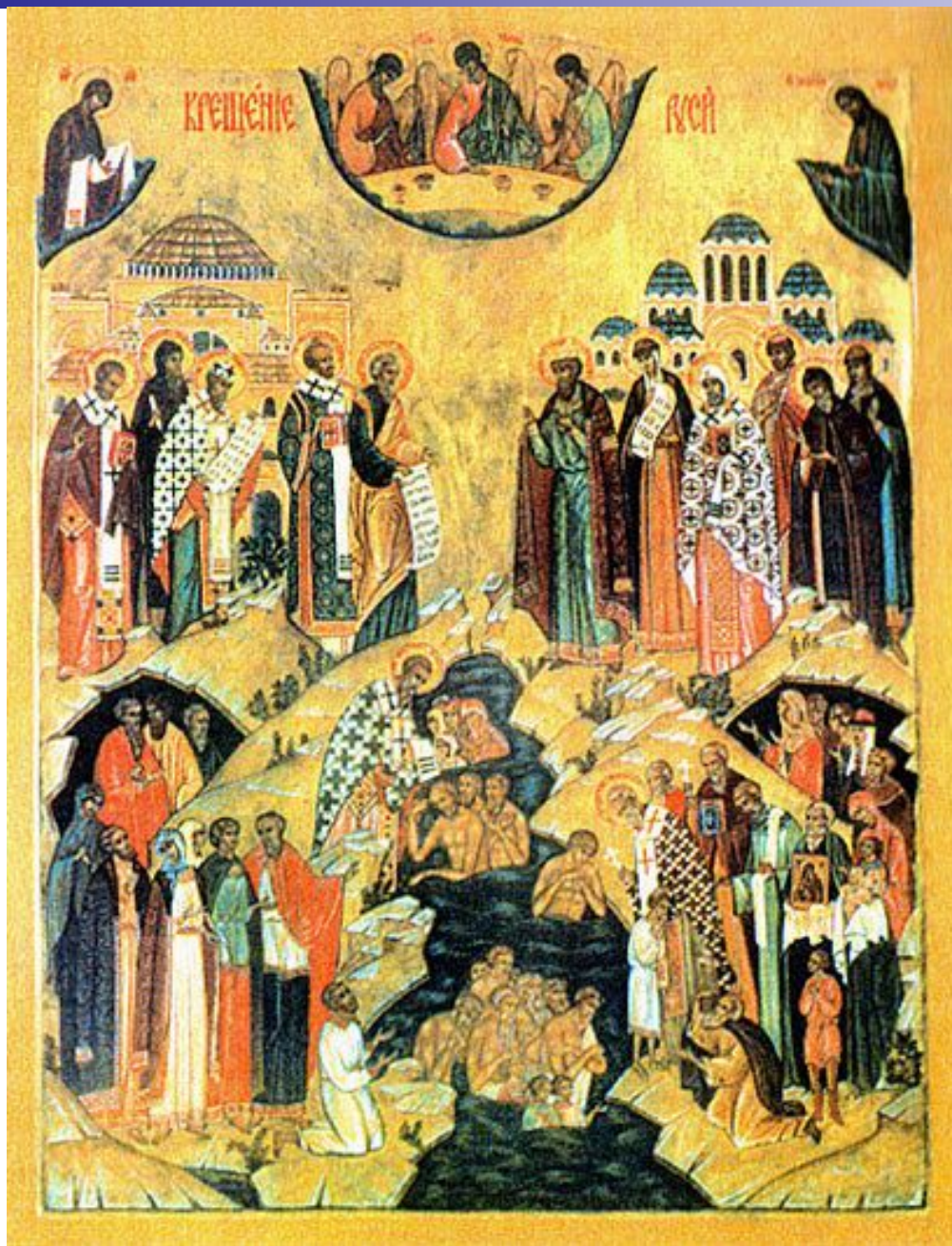
«Крещение Руси» Икона