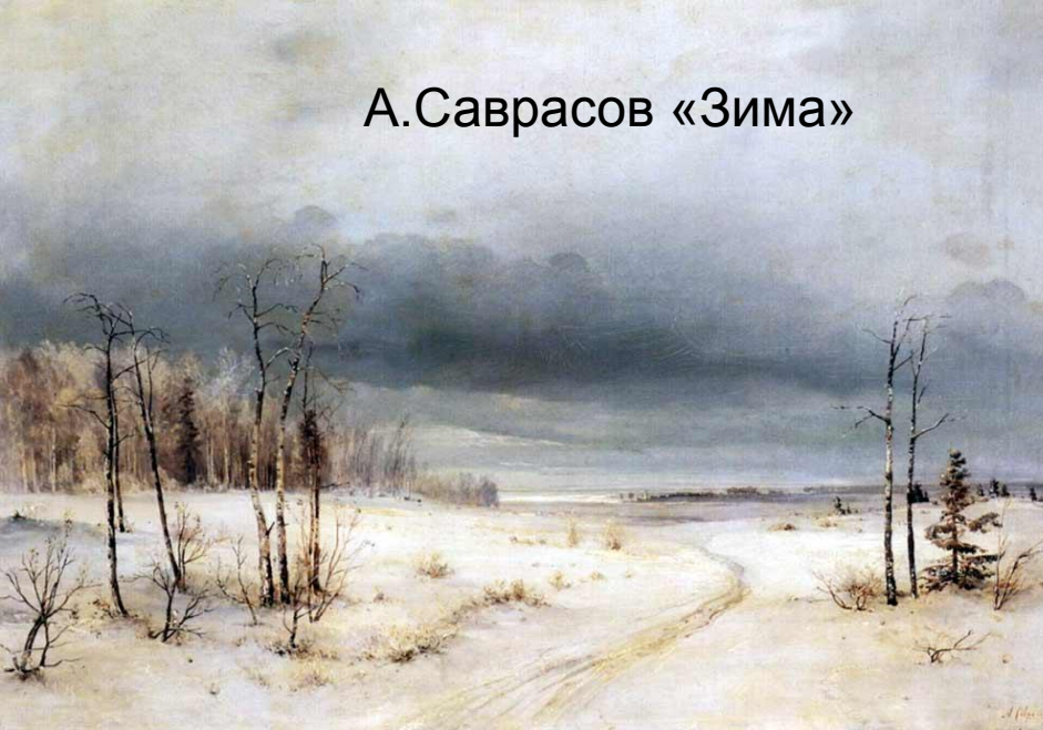
А. Саврасов «Зима»