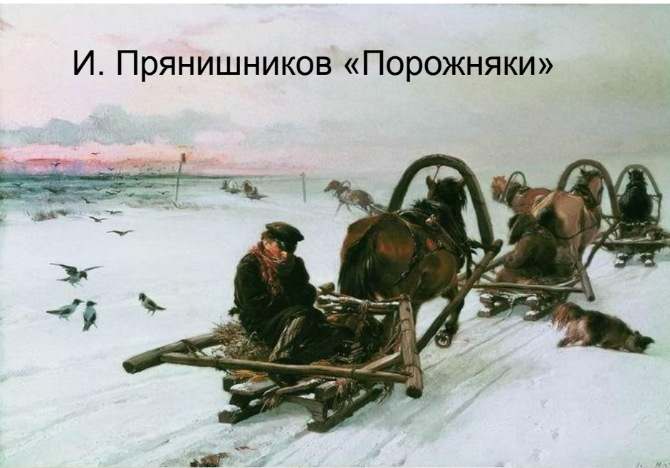
И. Прянишников «Порожняки»