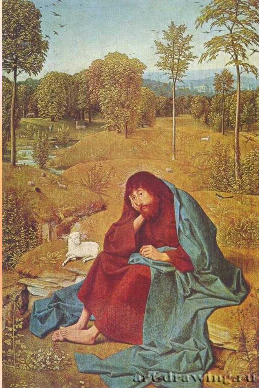
Синт-Янс. Иоанн Креститель