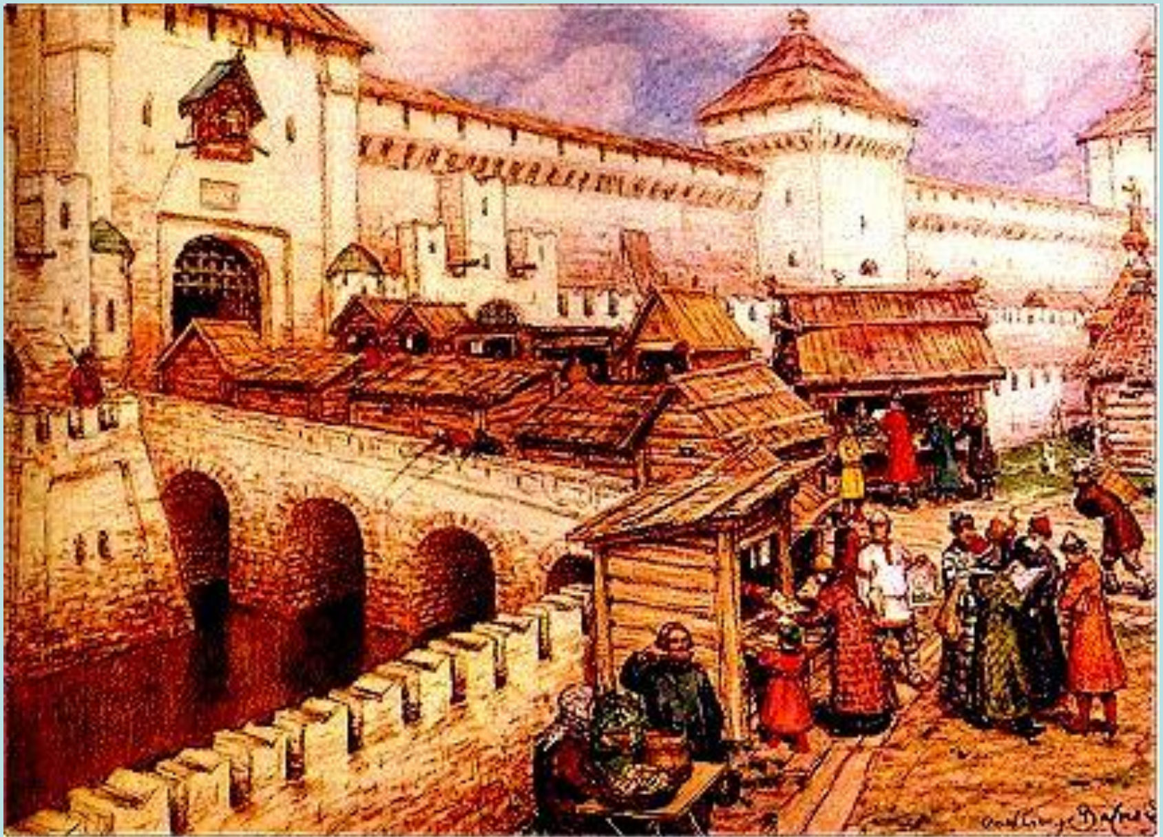
Книжные лавки на Спасском мосту