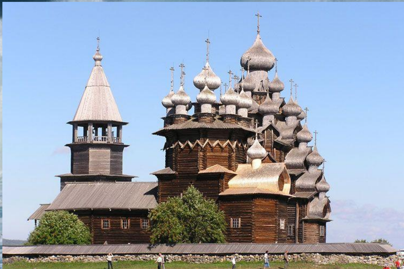
Преображенский храм на острове Кизи