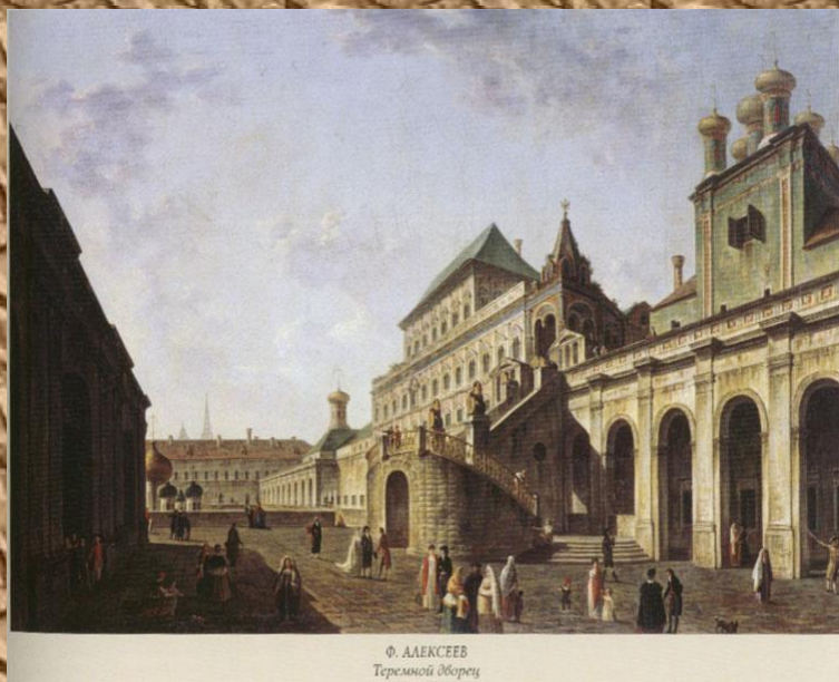
Ф. АЛЕКСЕЕВ Теремной дворец

Теремной дворец Московского кремля, созданный в 1635-1636 годах стал одним из ярких памятников эпохи XVII века.