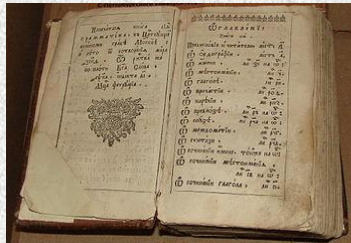
«Грамматика» Смотрицкого. Издание 1721 года. Москва

Активно участвовал в национально-религиозной борьбе. Под псевдонимом Теофил Ортолог в 1610 году напечатал свой знаменитейший труд «Плач», как и большинство других полемических произведений Смотрицкого — по-польски. В этом сочинении автор бичует епископов, перешедших в унию, призывает их одуматься, но также критикует нерадивость и злоупотребления православного духовенства; в полемике с католиками Смотрицкий выступает как энциклопедически образованный человек своего времени, цитирует либо упоминает более 140 авторов — не только отцов церкви, но и многих античных и возрожденческих ученых и писателей.