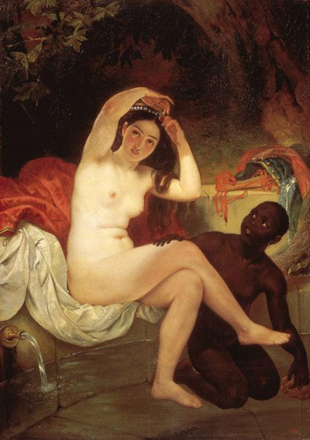
К. Брюллов «Вирсавия»