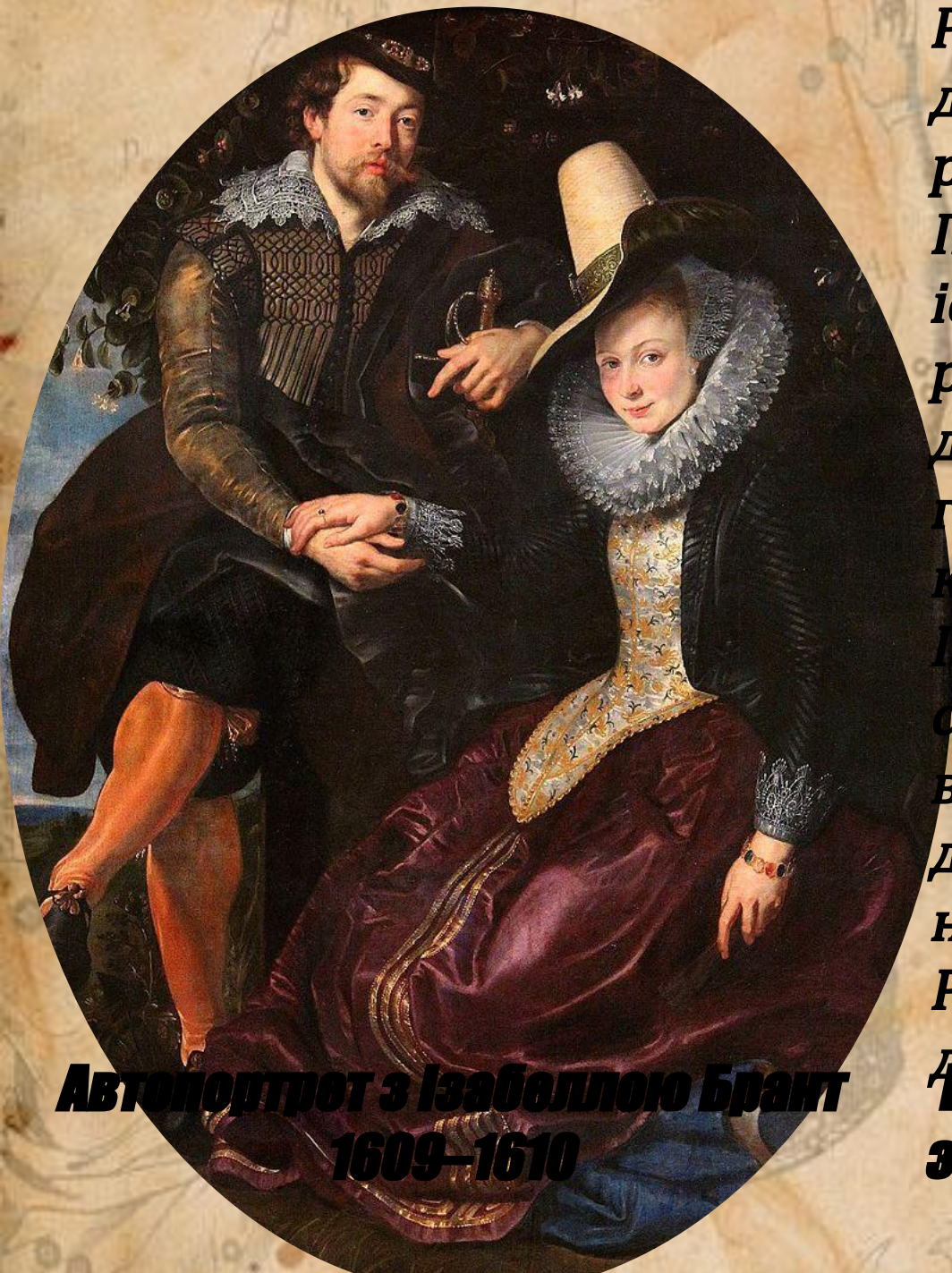
Автопортрет з Ізабеллою Брант 1609–1610

Рубенс написав себе і дружину в садку біля розквітлого куща жимолості. Про високе місце в суспільній ієрархії пари свідчать розкішні шати подружжя і дворянська, золочена зброя господаря. Тільки коштовне мереживо на Ізабеллі коштувало великого статку. Рубенс сидить на лаві в дуже вільній позі. Так не дозволялось сидіти особам на парадних портретах. Рубенса малював портрет для себе. Відомою картина Рубенса, що зберігається в Старій галереї Мюнхена.