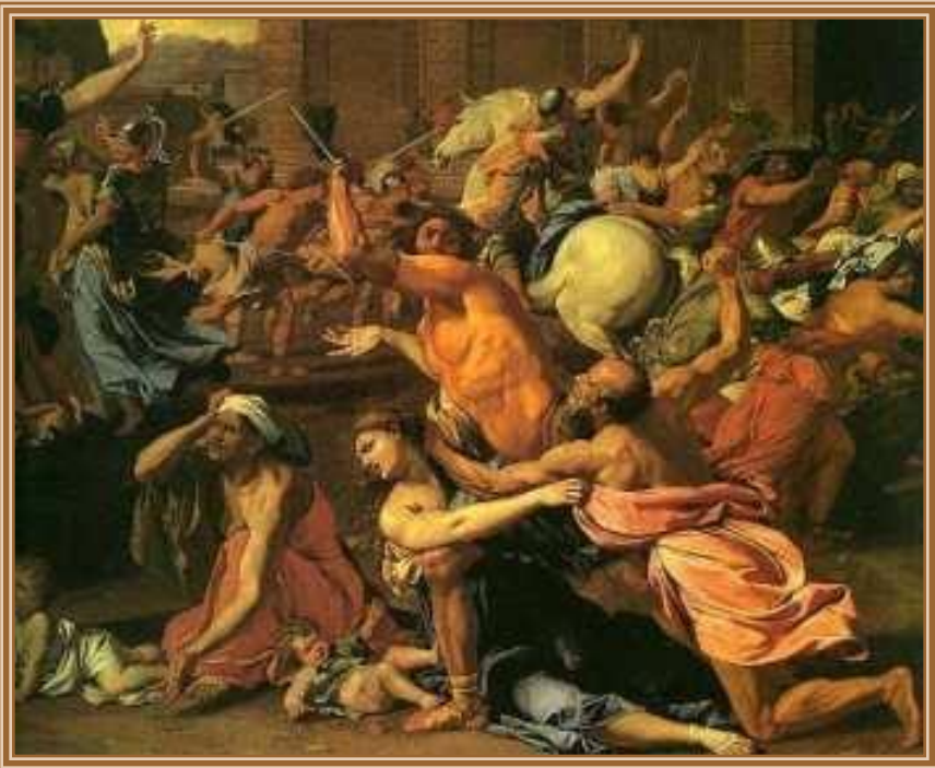
Николо Пуссен "Похищение сабинянок" (фрагм) Метрополитен-музей, Нью-Йорк