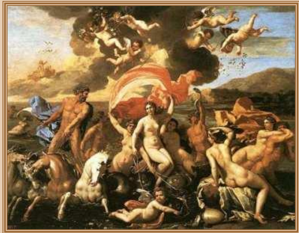
Николо Пуссен "Триумф Нептуна» 1634, Музей искусств, Филадельфия