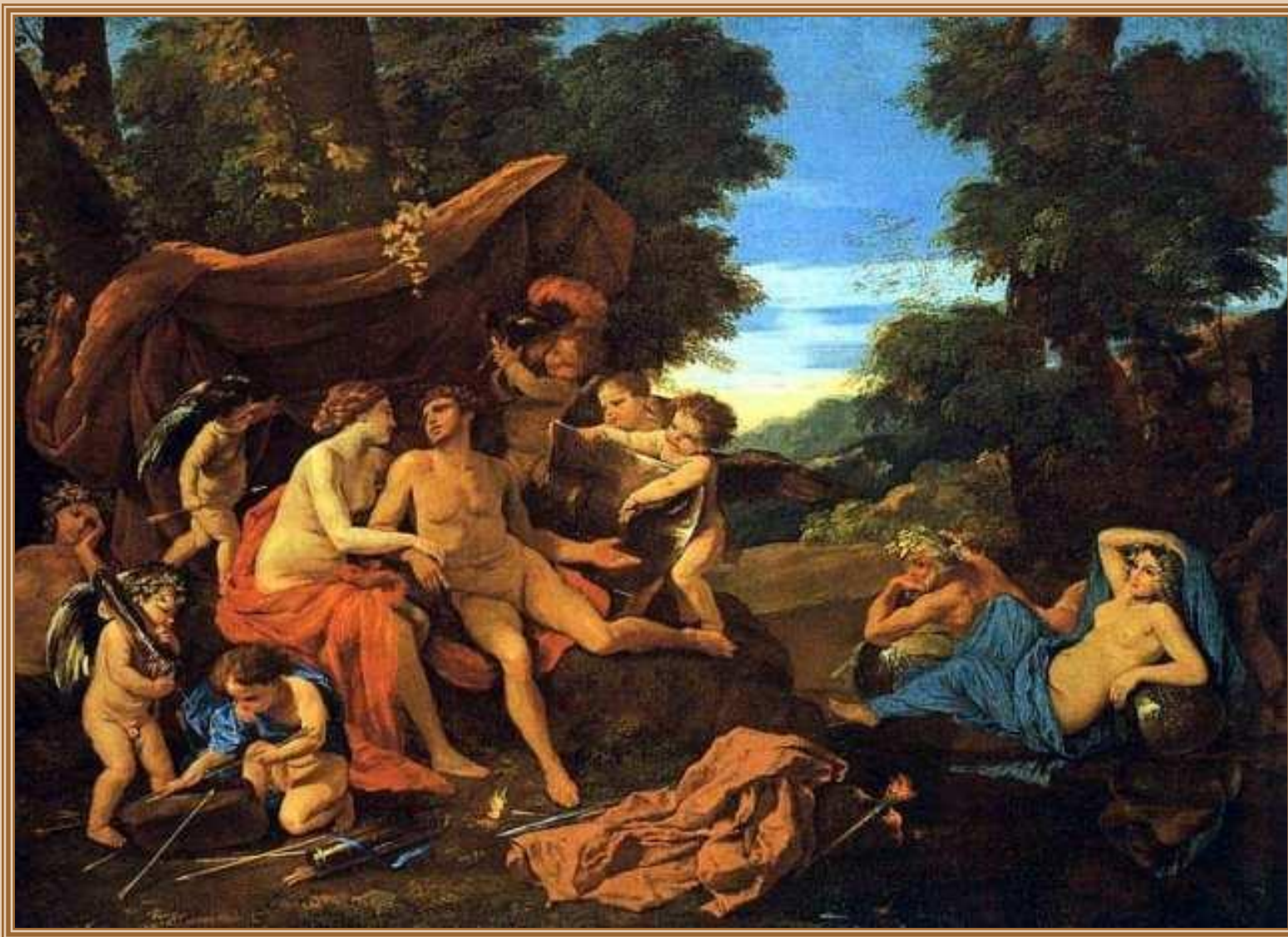
Николо Пуссен «Марс и Венера» 1627-1629