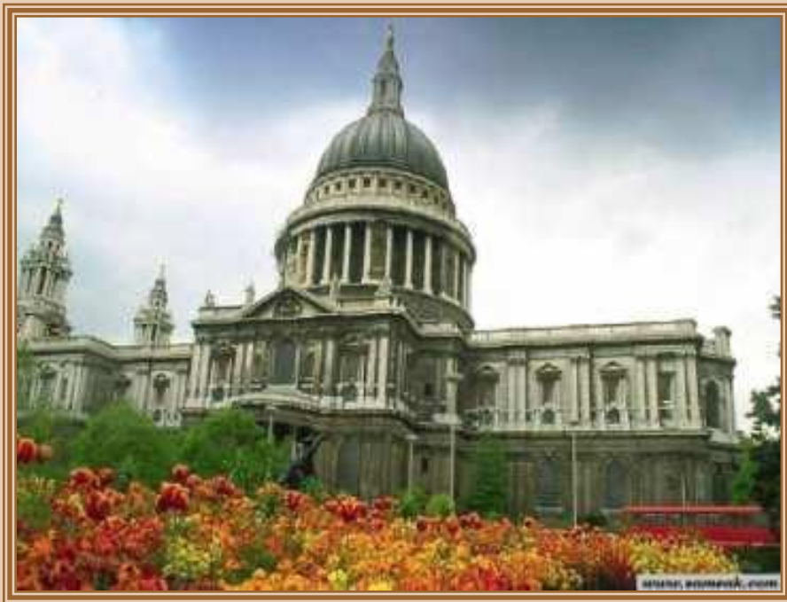
Собор св. Павла К.Рен, 1675-1717 Англия, Лондон