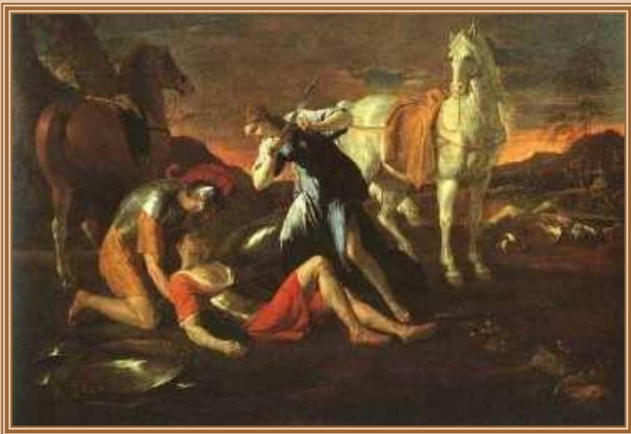
Николо Пуссен «Танкред и Эрминия» 1630-е, Эрмитаж, Санкт-Петербург