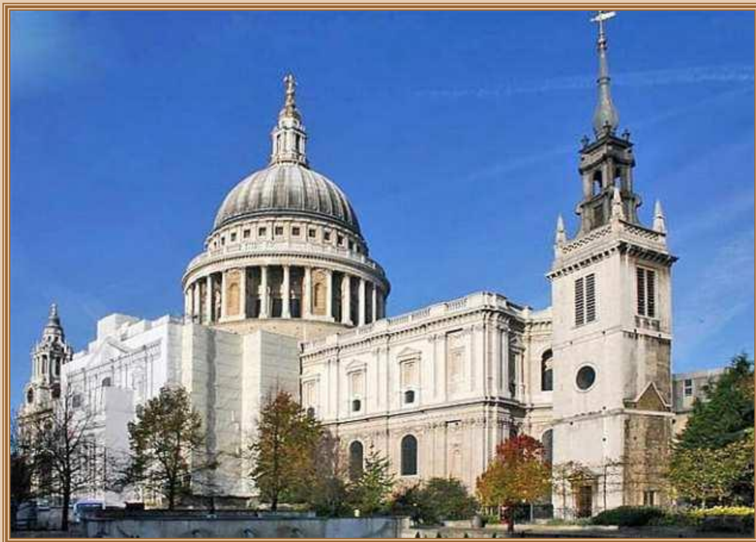
Собор св. Павла К.Рен, 1675-1717 Англия, Лондон