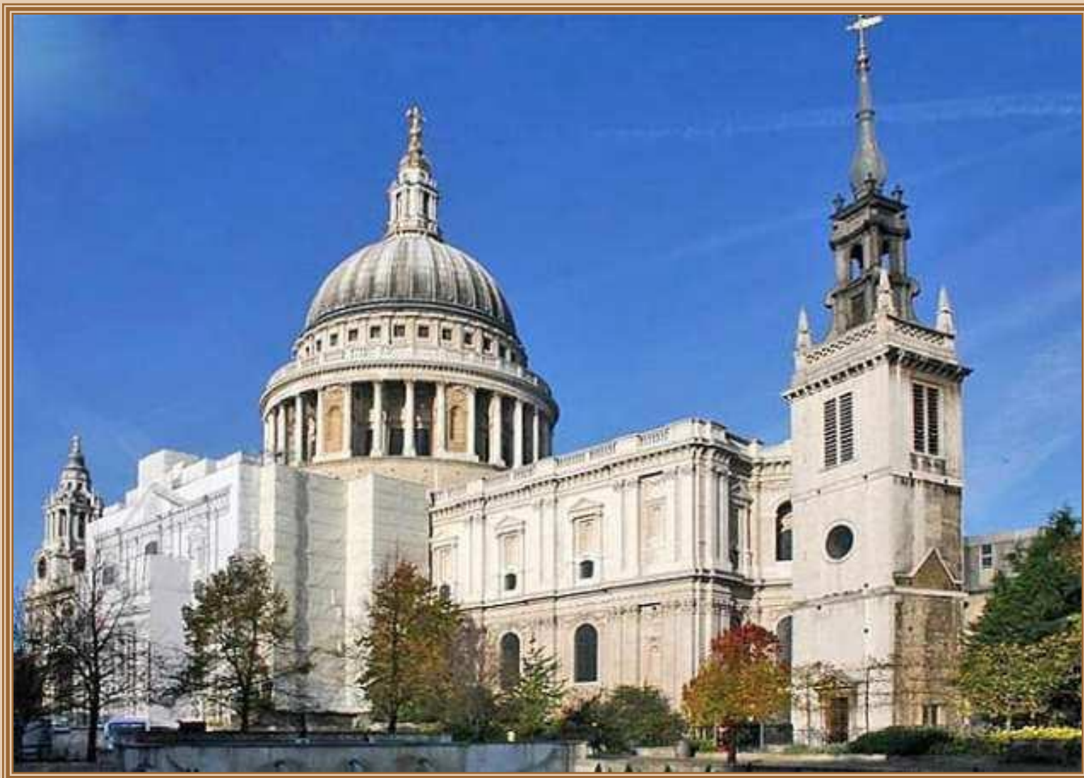
Собор св. Павла К.Рен, 1675-1717 Англия, Лондон