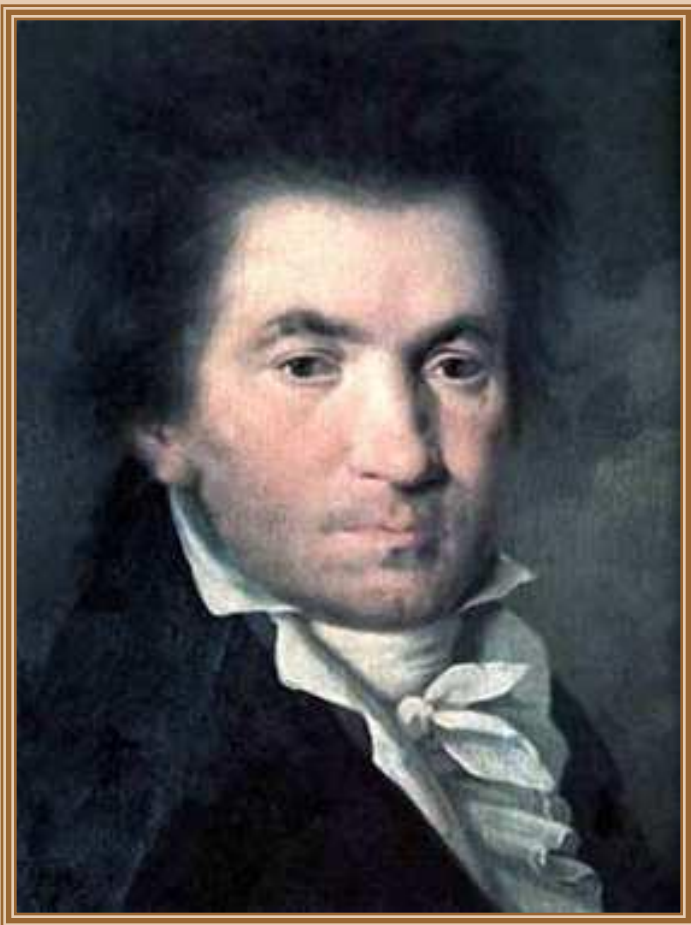
Людвиг ван Бетховен (1770-1827) - немецкий композитор, пианист, дирижёр.