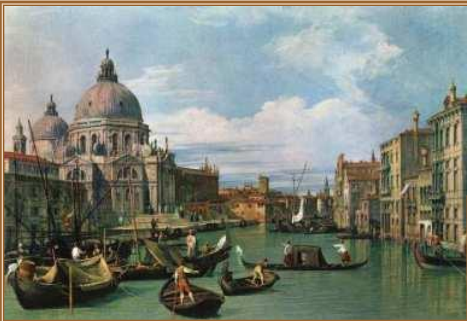
Каналетто Джованни Антонио Большой канал и Собор Санта Мария делла Салюте, 1730