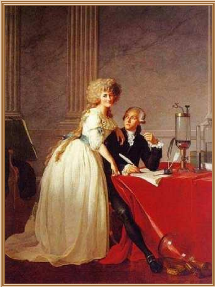
Давид (David) Жак Луи "Портрет Лавуазье и его жены" 1788