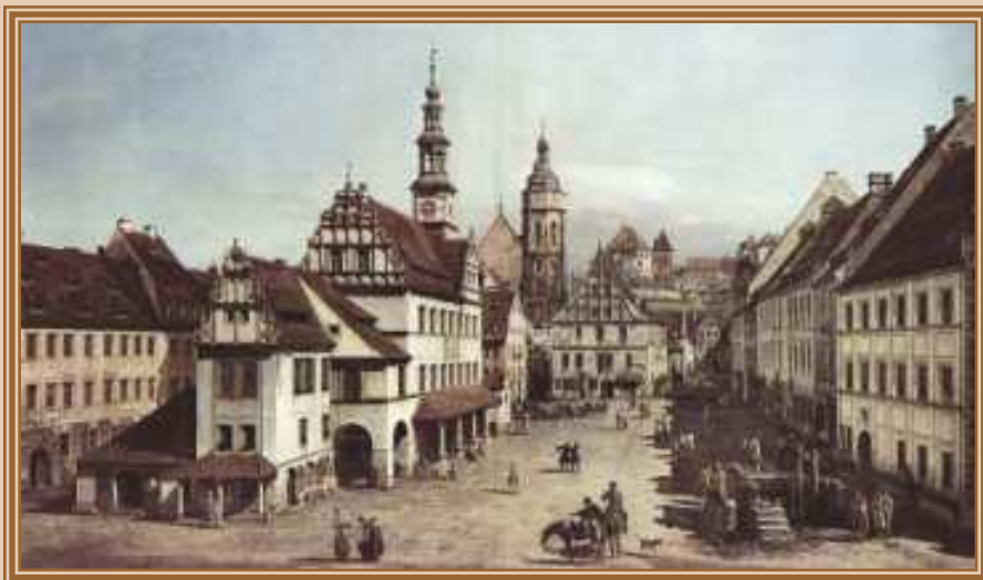
Каналетто Джованни Антонио Площадь в Пирне 1754