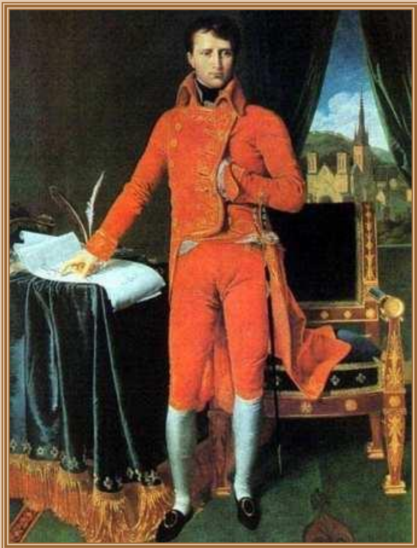
Энгр (Ingres) Жан Огюст Доминик «Портрет Бонапарта» 1804