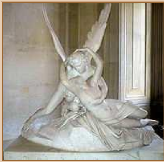
Антонио Канова. Амур и Психея (1787—1793, Париж, Лувр)