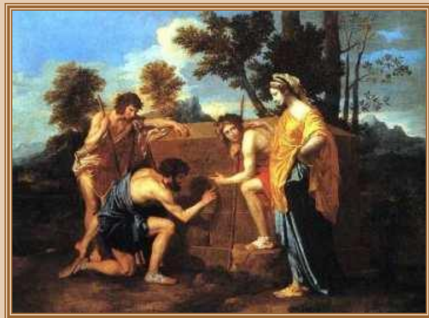
Николо Пуссен "Пастухи в Аркадии" 1638-1640