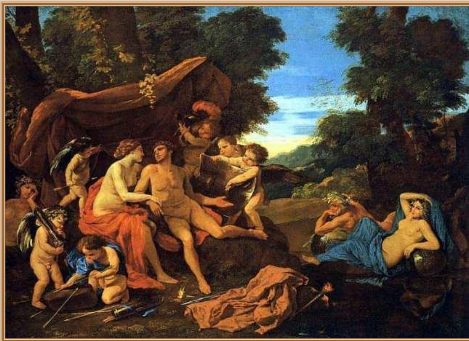
Николо Пуссен «Марс и Венера» 1627-1629