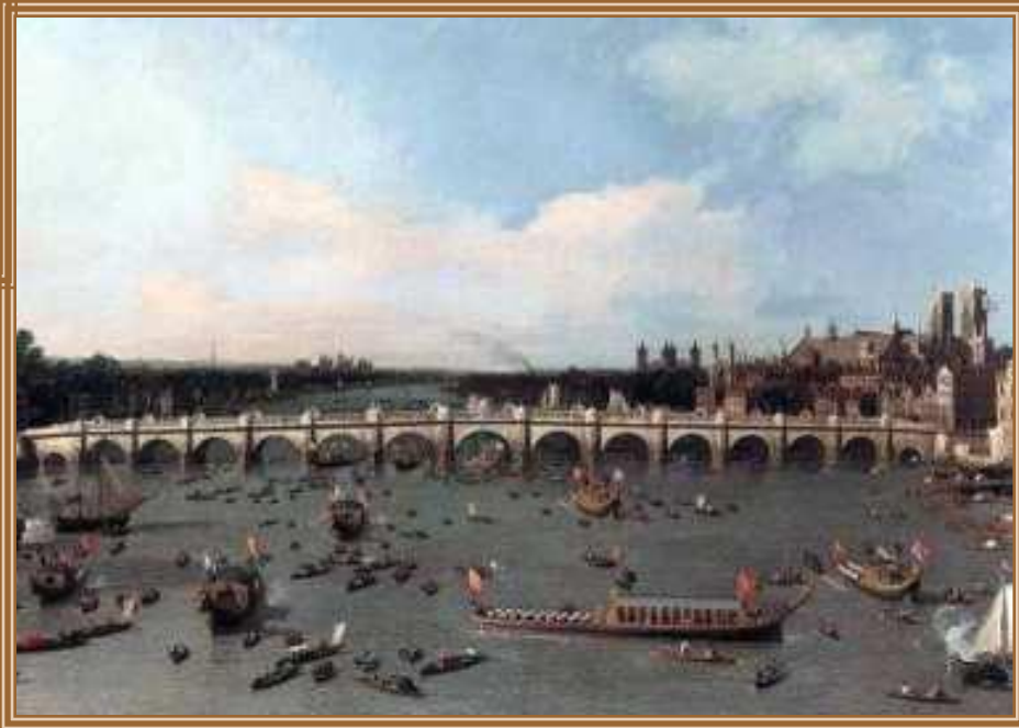
Каналетто Джованни Антонио Лондон. Мост Вестминстер 1746 15