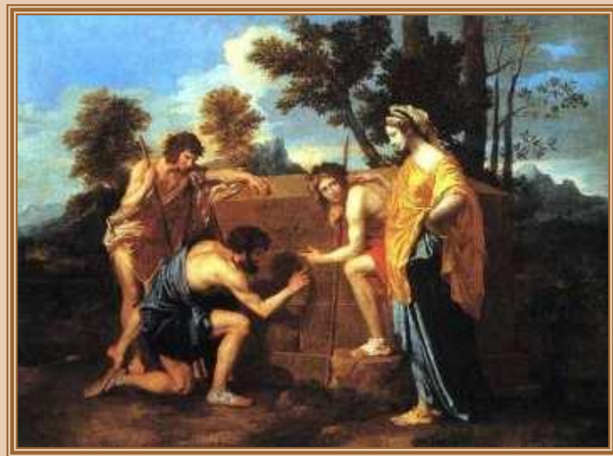
Николо Пуссен "Пастухи в Аркадии" 1638-1640