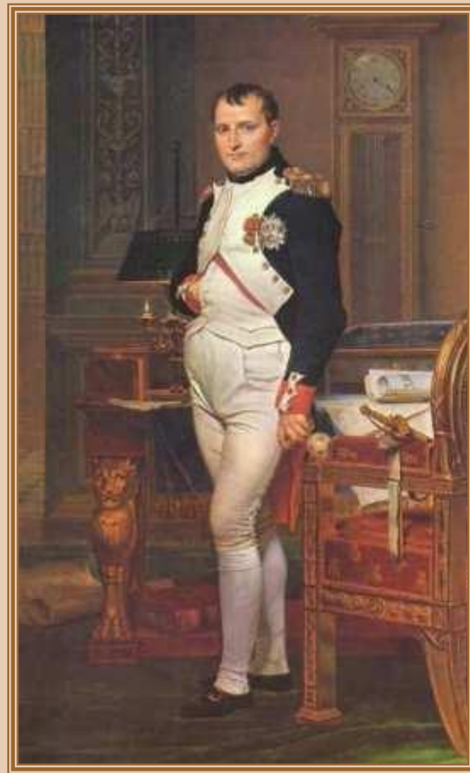
Давид (David) Жак Луи «Портрет Наполеона I» 1817