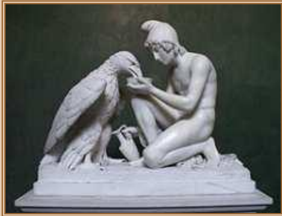
Бертель Торвальдсен. «Ганимед, кормящий Зевесова орла» (1817).

Толчком к развитию классицистической скульптуры в середине XVIII века послужили сочинения Винкельмана и археологические раскопки древних городов, расширившие познания современников об античном ваянии. На грани барокко и классицизма колебались во Франции такие скульпторы, как Пигаль и Гудон. Своего наивысшего воплощения в области пластики классицизм достиг в героических и идиллических работах Антонио Кановы.