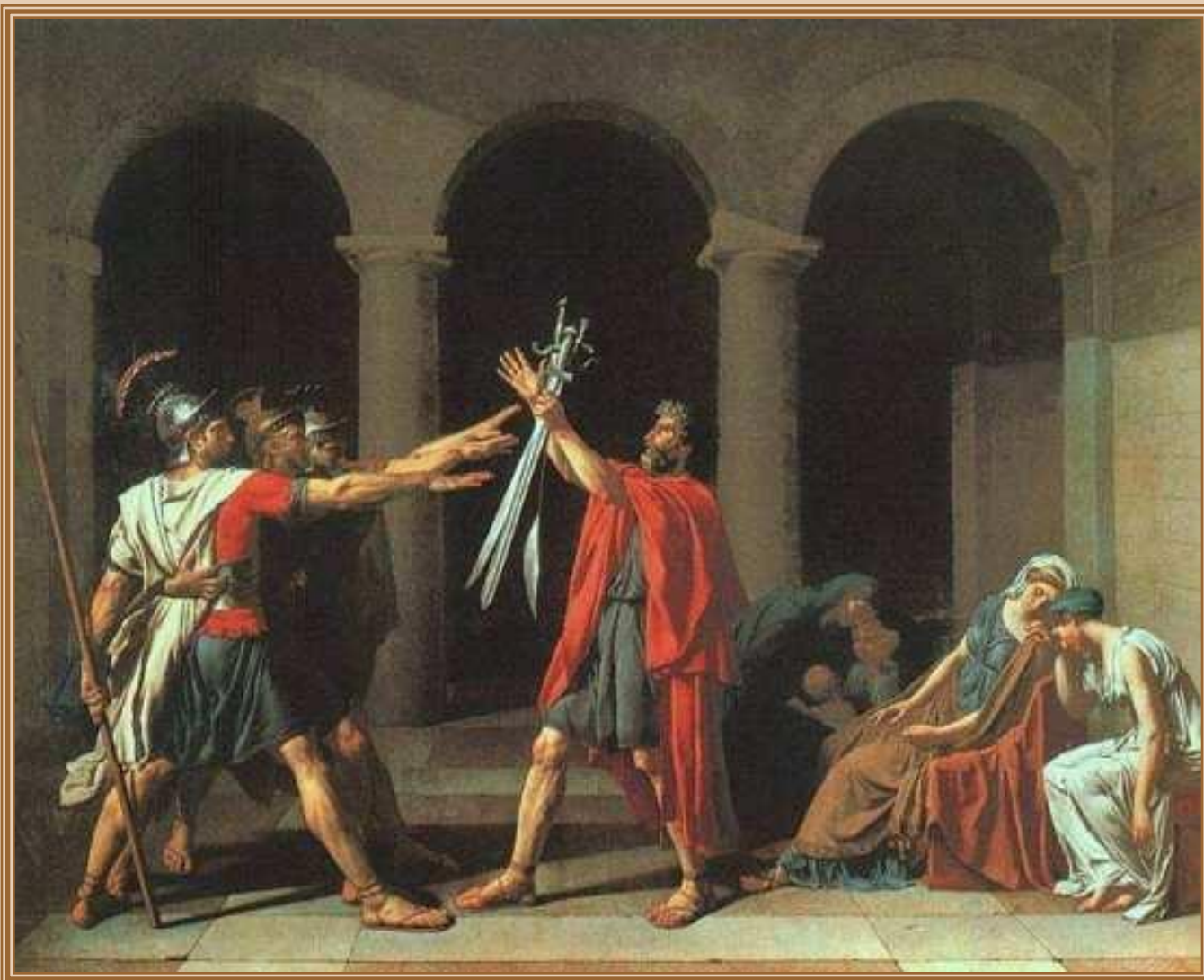
Давид (David) Жак Луи «Клятва Горацев» 1784, Лувр, Париж