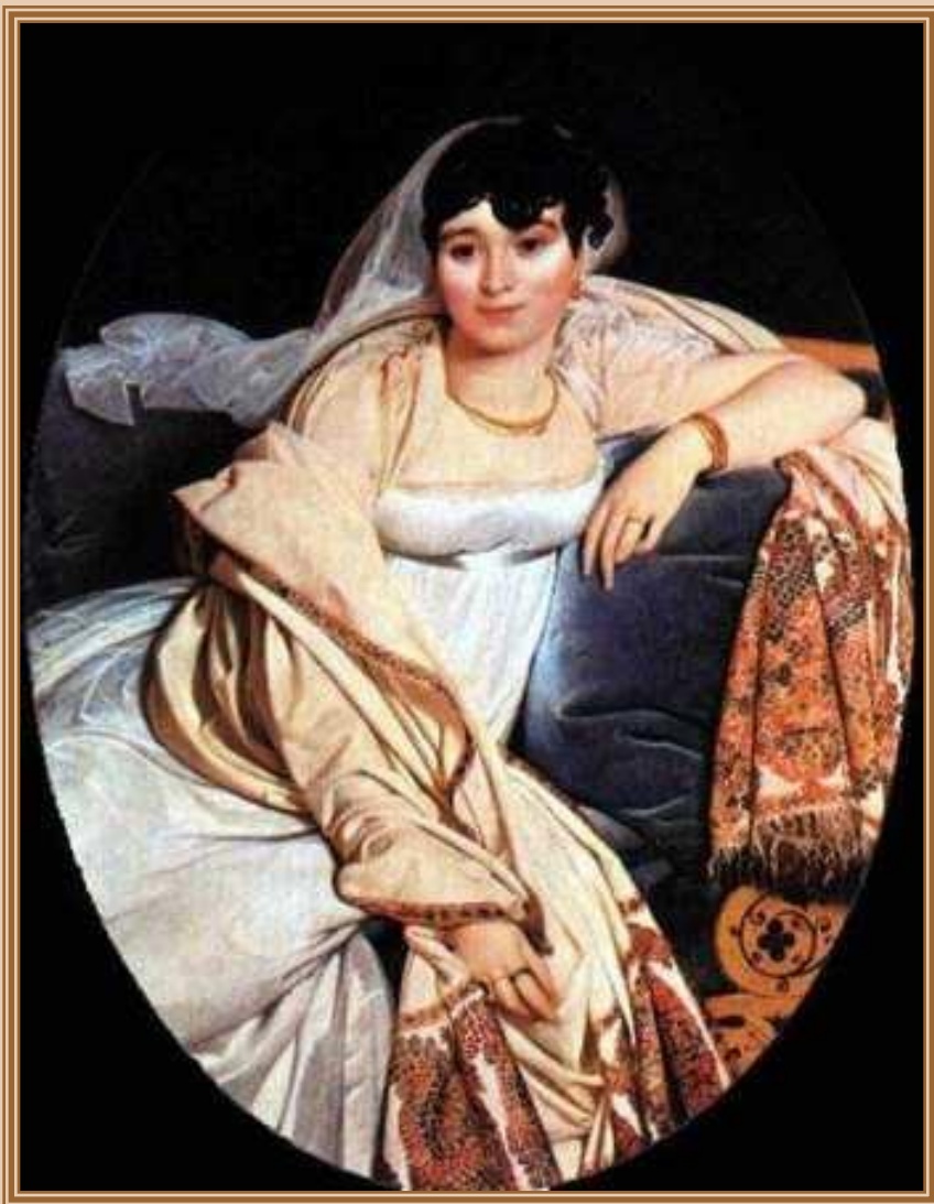
Энгр (Ingres) Жан Огюст Доминик «Портрет мадам Ривьер» 1805