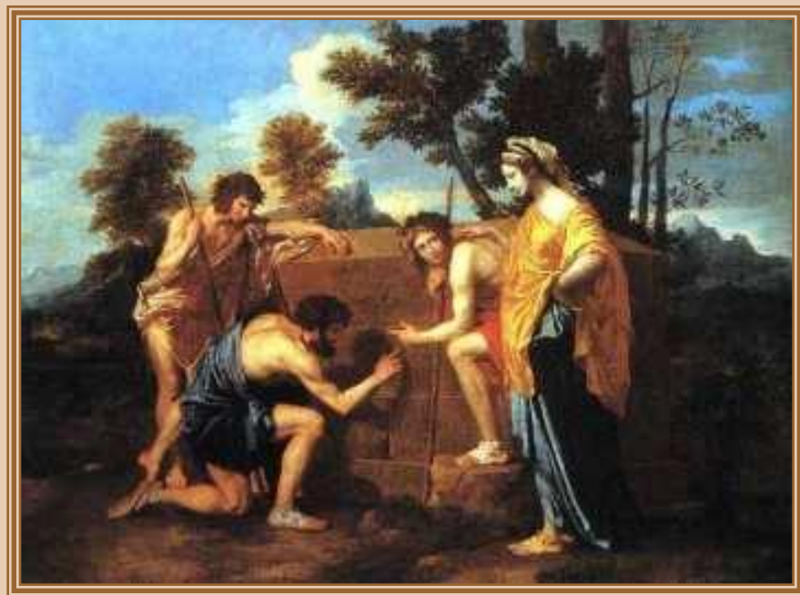
Николо Пуссен "Пастухи в Аркадии" 1638-1640