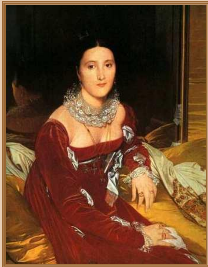
Энгр (Ingres) Жан Огюст Доминик «Портрет мадам Сенонн» 1814