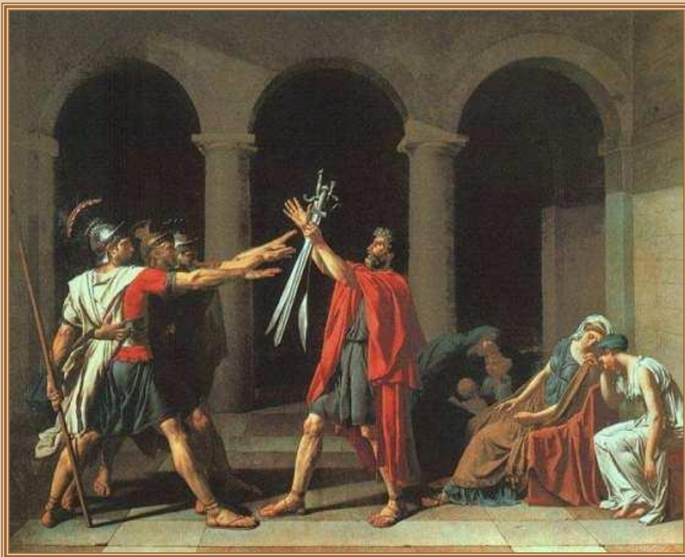
Давид (David) Жак Луи «Клятва Горацев» 1784, Лувр, Париж