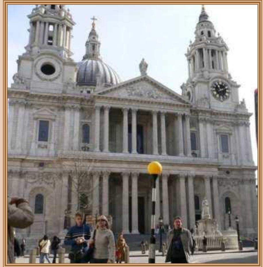
Собор св. Павла К.Рен, 1675-1717 Англия, Лондон