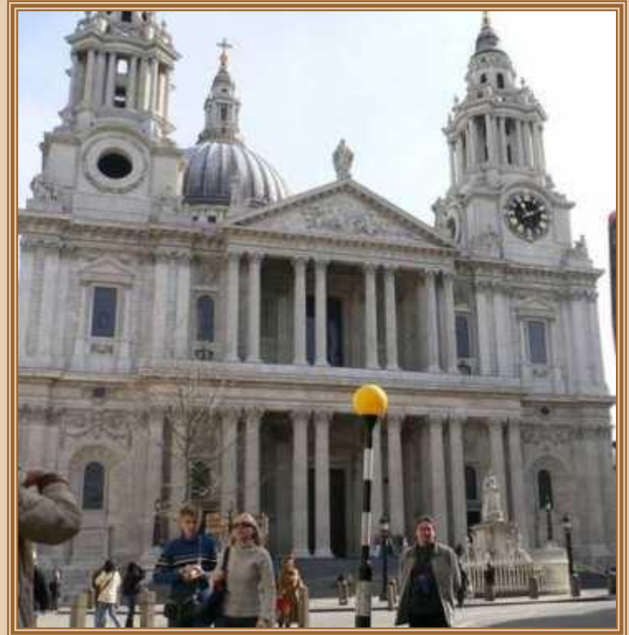
Собор св. Павла К.Рен, 1675-1717 Англия, Лондон