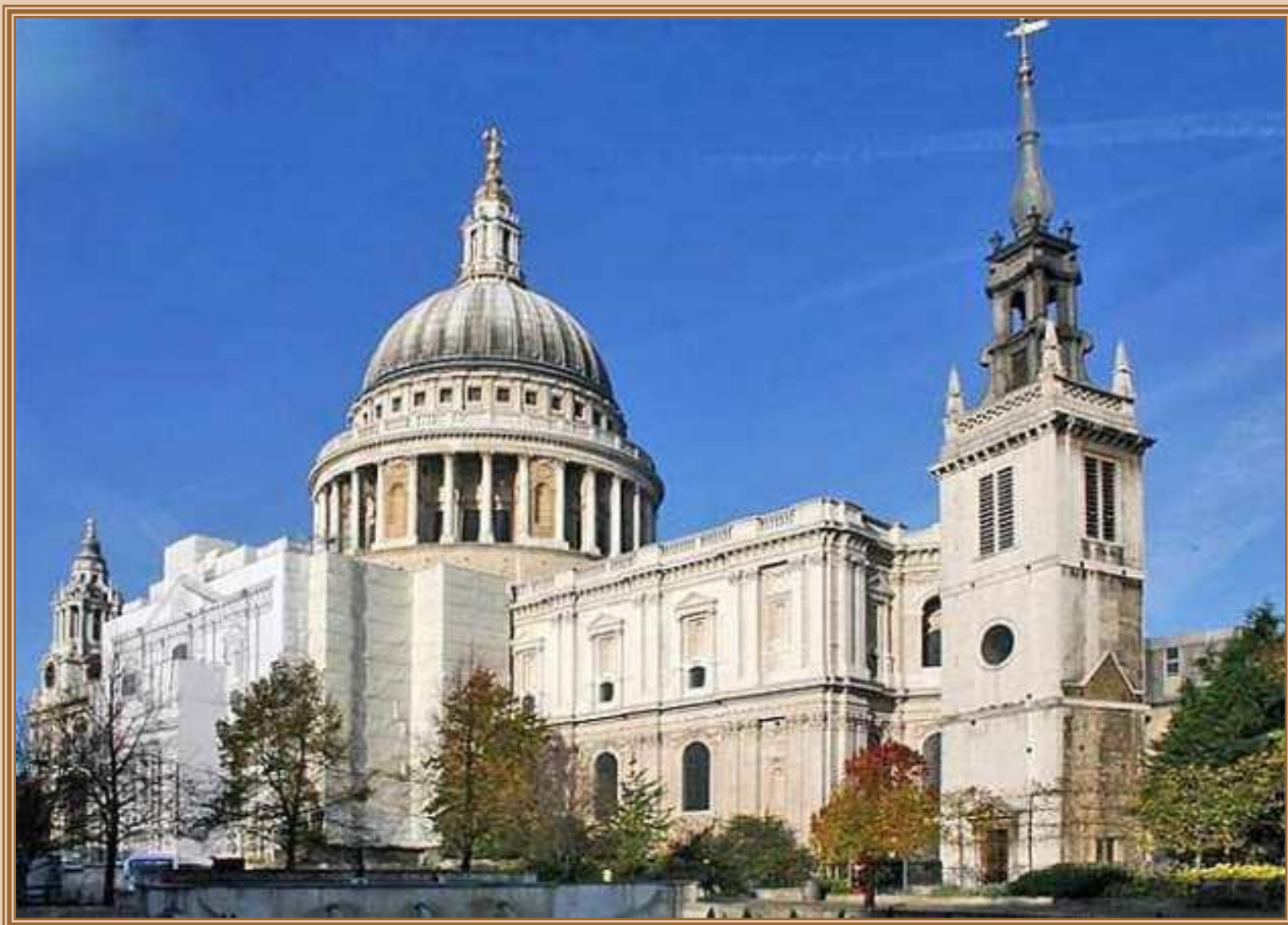
Собор св. Павла К.Рен, 1675-1717 Англия, Лондон