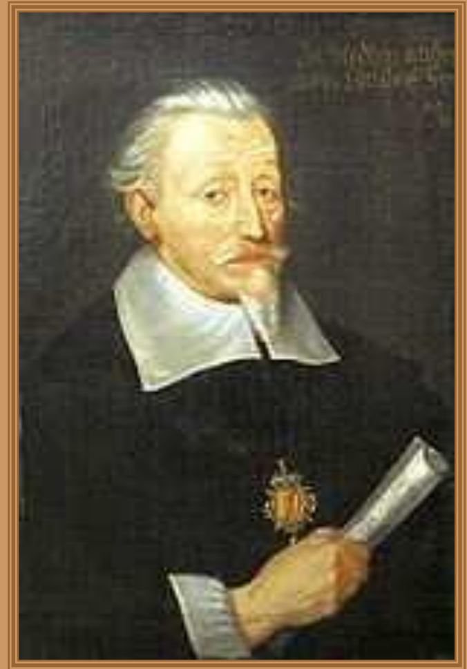
Портрет Генриха Шютца кисти Кристофера Спетнера, около 1650/1660