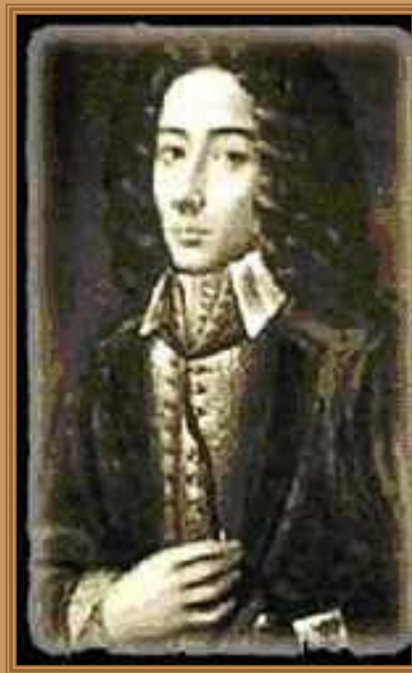
Джованни Баттиста Перголези