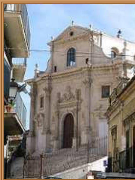
Церковь душ в чистилище в городе Рагуза, образец сицилийского барокко

Для архитектуры барокко (Л. Бернини, Ф. Борромини в Италии, Б. Ф. Растрелли в России) характерны пространственный размах, слитность, текучесть сложных, обычно криволинейных форм. Часто встречаются развернутые масштабные колоннады, изобилие скульптуры на фасадах и в интерьерах, волюты, большое число раскреповок, лучковые фасады с раскреповкой в середине, рустованные колонны и пилястры. Купола приобретают сложные формы, часто они многоярусны, как у собора Св. Петра в Риме. Характерные детали барокко — теламон (атлант), кариатида, маскарон.