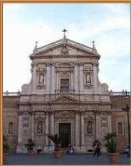
Карло Мадерна Церковь Святой Сусанны, Рим