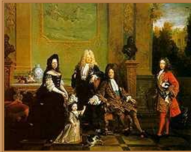
Николя де Ларжийер. Портрет Людовика XIV с семьёй

Мода эпохи барокко соответствует во Франции периоду правления Людовика XIV, второй половине XVII века. Это время абсолютизма. При дворе царили строгий этикет сложный церемониал. Костюм был подчинен этикету. Франция была законодателем моды в Европе, поэтому в других странах быстро переняли французскую моду. Это был век, когда в Европе установилась общая мода, а национальные особенности отошли на задний план или сохранились в народном крестьянском костюме. Европейские костюмы носили также и в России, до Петра I, некоторые аристократы, хотя не повсеместно.