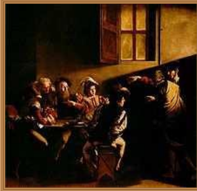
Караваджо. Призвание апостола Матфея.

Стиль барокко в живописи характеризуется динамизмом композиций, «плоскостью» и пышностью форм, аристократичностью и незаурядностью сюжетов. Самые характерные черты барокко — броская цветистость и динамичность; яркий пример — творчество Рубенса и Караваджо.