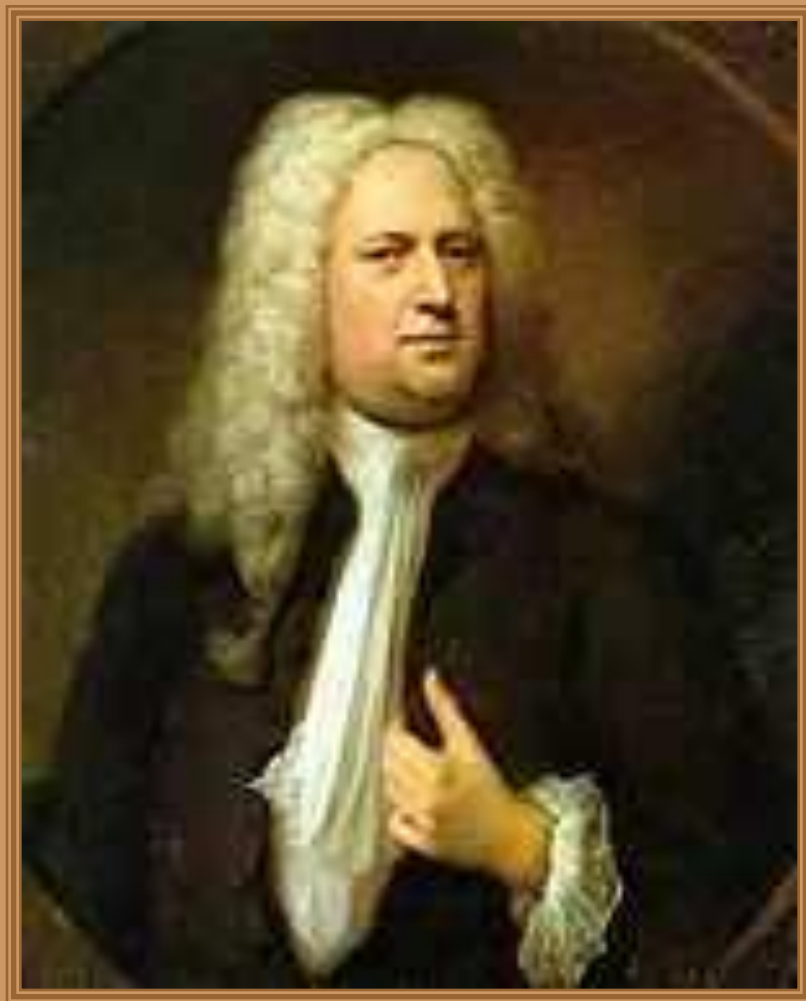
Портрет Георга Фридриха Генделя кисти Бальтазара Деннера, 1733