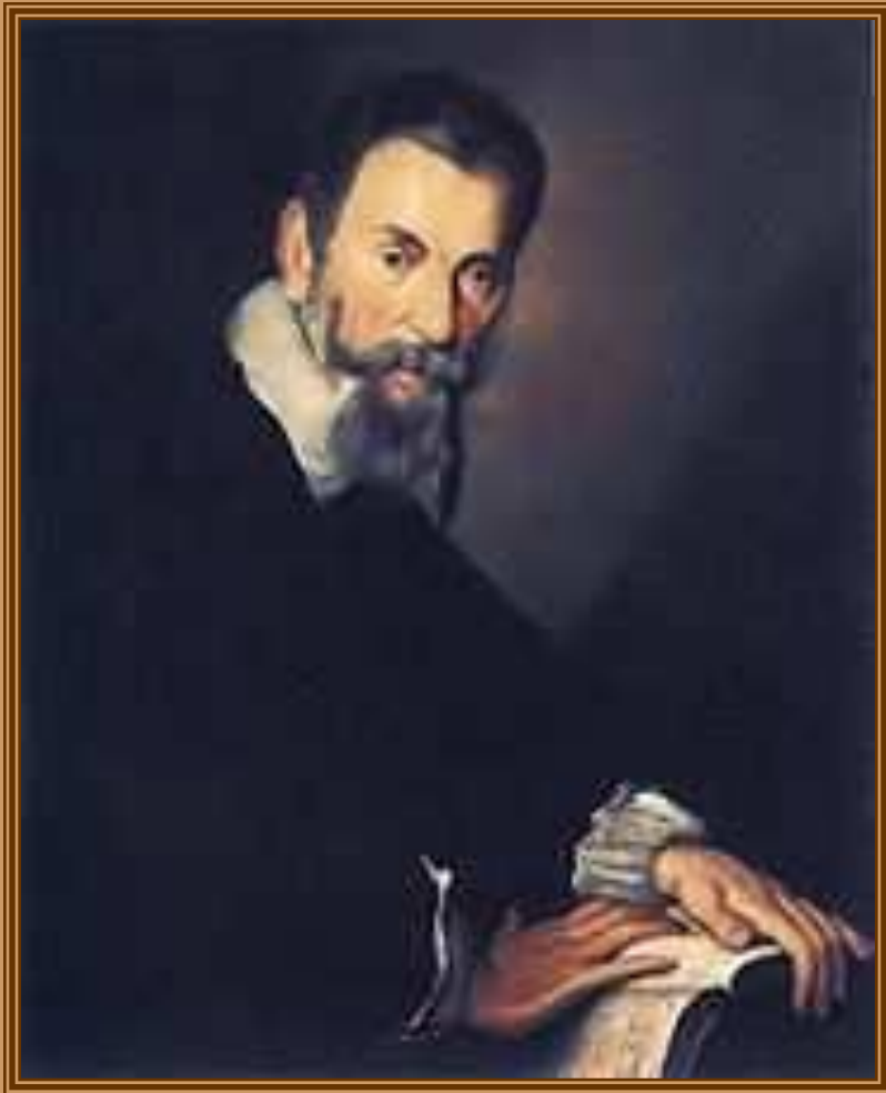
Клаудио Монтеверди Портрет кисти Бернардо Строцци, 1640