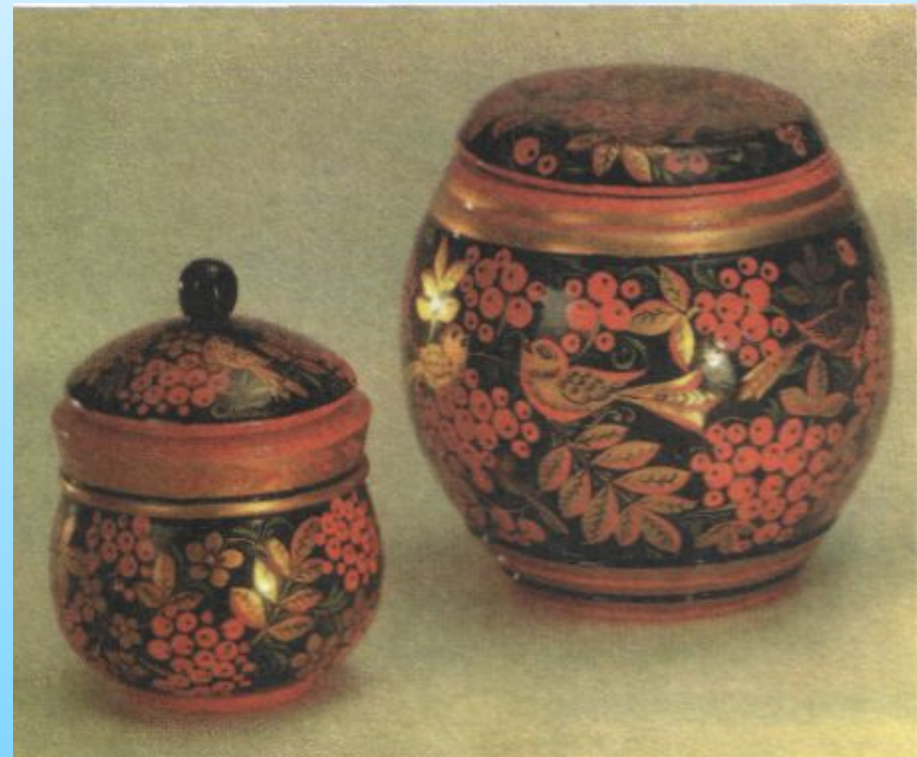
Е. Мосина. Хохломская посуда

Уже в XVII веке в селе Хохлома проходили ярмарки, где торговали деревянной расписной посудой, изготовленной в селах и деревнях Нижегородского края.