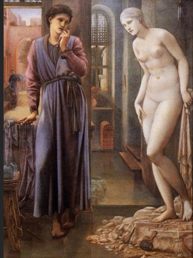
Э.Бёрн-Джонс. Пигмалион и Галатея. 1886