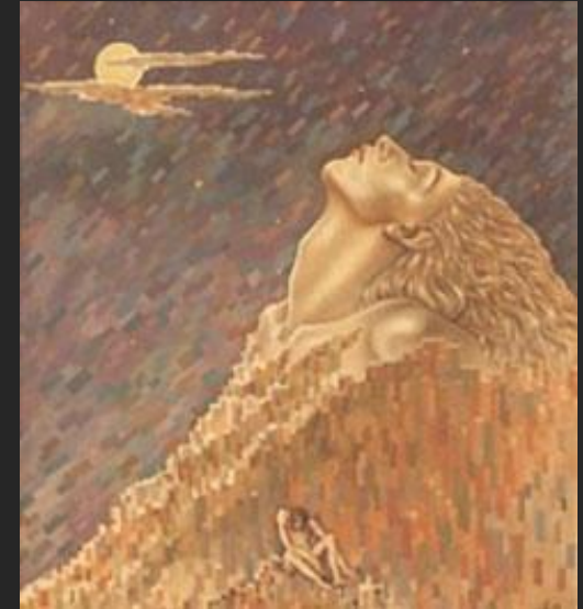
Н. Дулько. Пигмалион и Галатея. 2002