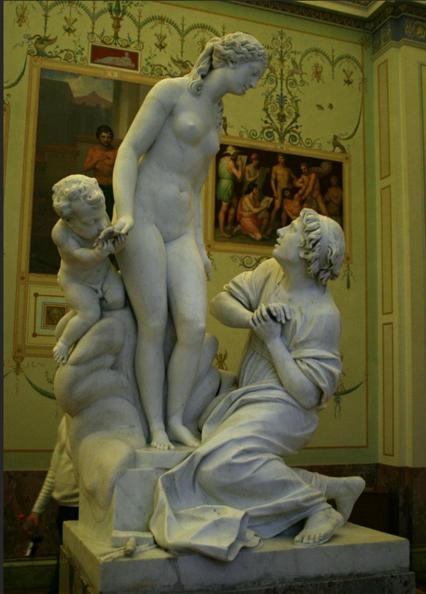
Э.М. Фальконе. Пигмалион, Галатея и Эрос. 1763

Собирательным образом творчества могут стать бессмертные образы Пигмалиона и Галатеи.