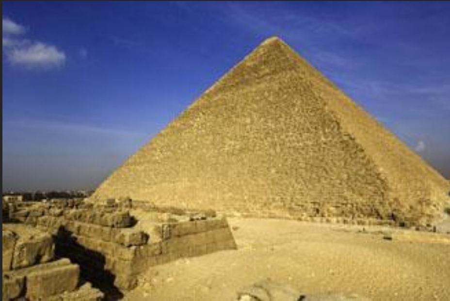
Пирамида Хеопса. 2560 –2540 до н. э.

Современный ученический реферат приобретает совершенно новое качество, сменяя приоритеты со сбора информации – на ее анализ, сопоставление источников и формулировку собственных выводов.