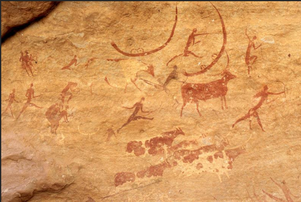
Фреска Тассилин-Аджер. 25 500 г. до н. э.

Интернет-пространство дает возможность безграничного виртуального путешествия по миру.