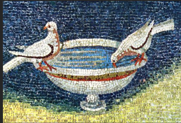
Мозаика в мавзолее Галлы Плацидии. Середина V в.