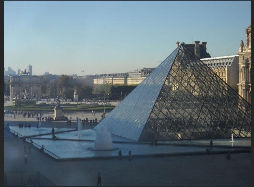
Йо Минг Пей. Стекланная пирамида Лувра. 1989