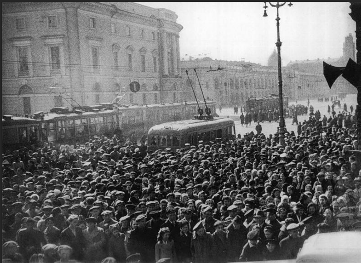
Ленинградцы на Невском пр. слушают сообщение по радио о капитуляции Германии