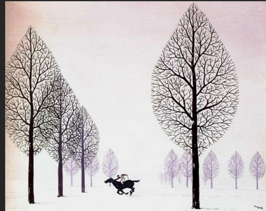
Р. Магритт. Зablудившийся жокей. 1926