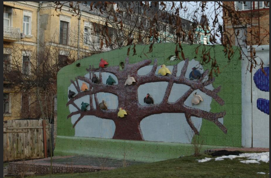
Детская площадка в Киеве. 2009 (rospisy.ru)