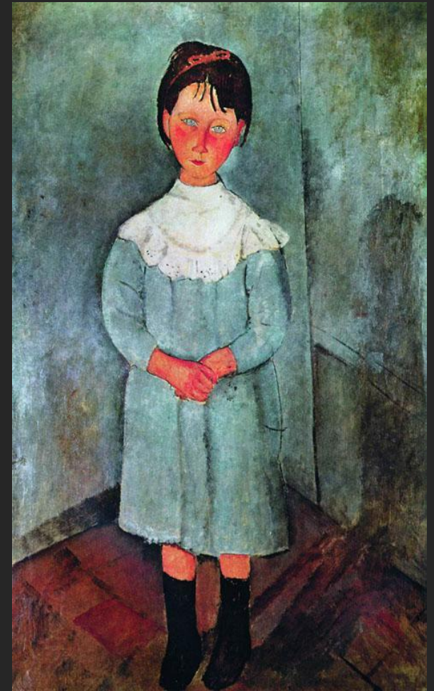
А. Модильяни. Девочка в голубом. 1918