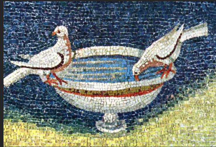
Мозаика в мавзолее Галлы Платидии. Середина V в.