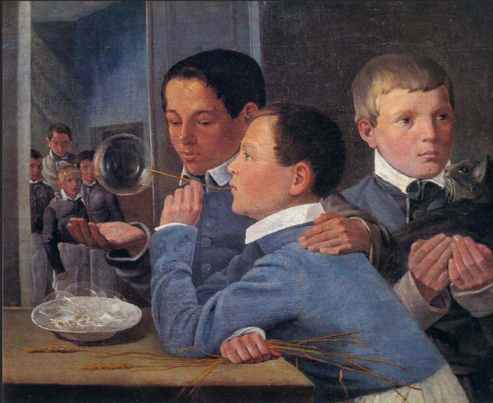
А. Иванов. Дети, пускающие мыльные пузыри. 1839