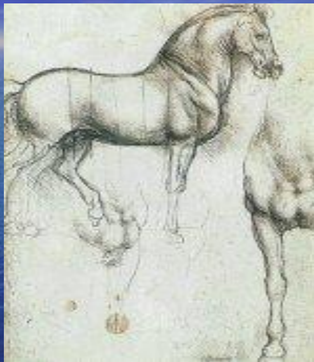
Наброски к "Коню"