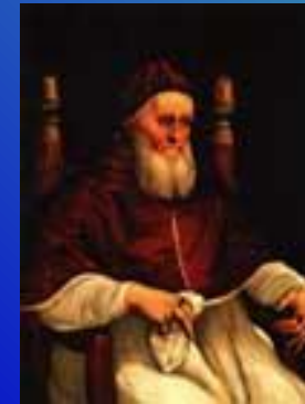
Папа Юлий II делла Ровере'