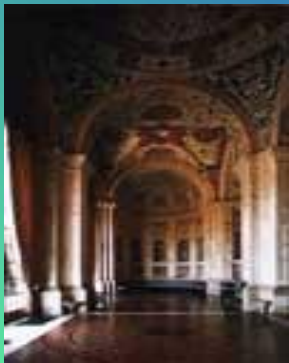
Лоджия виллы Мадама, Рим (начата в 1516)