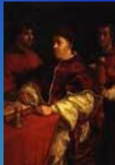
Папа Лев X Медичи(1517-1519)