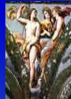
Венера, Церера и Юнона в лоджии Виллы Фарнезина (1569)