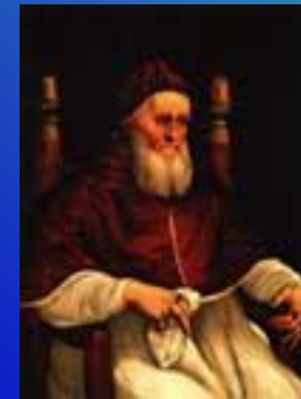
Папа Юлий II делла Ровере'