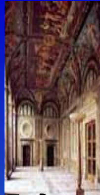
Лоджия Психеи в вилле Фарнезина (1515-17)