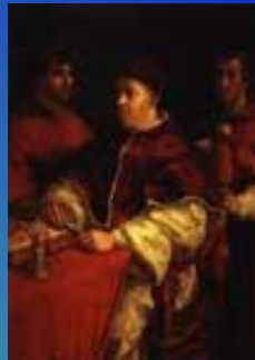
Папа Лев X Медичи(1517-1519)