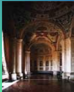
Лоджия виллы Мадама, Рим (начата в 1516)