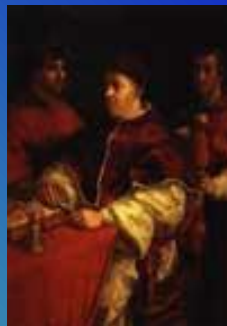
Папа Лев X Медичи(1517-1519)