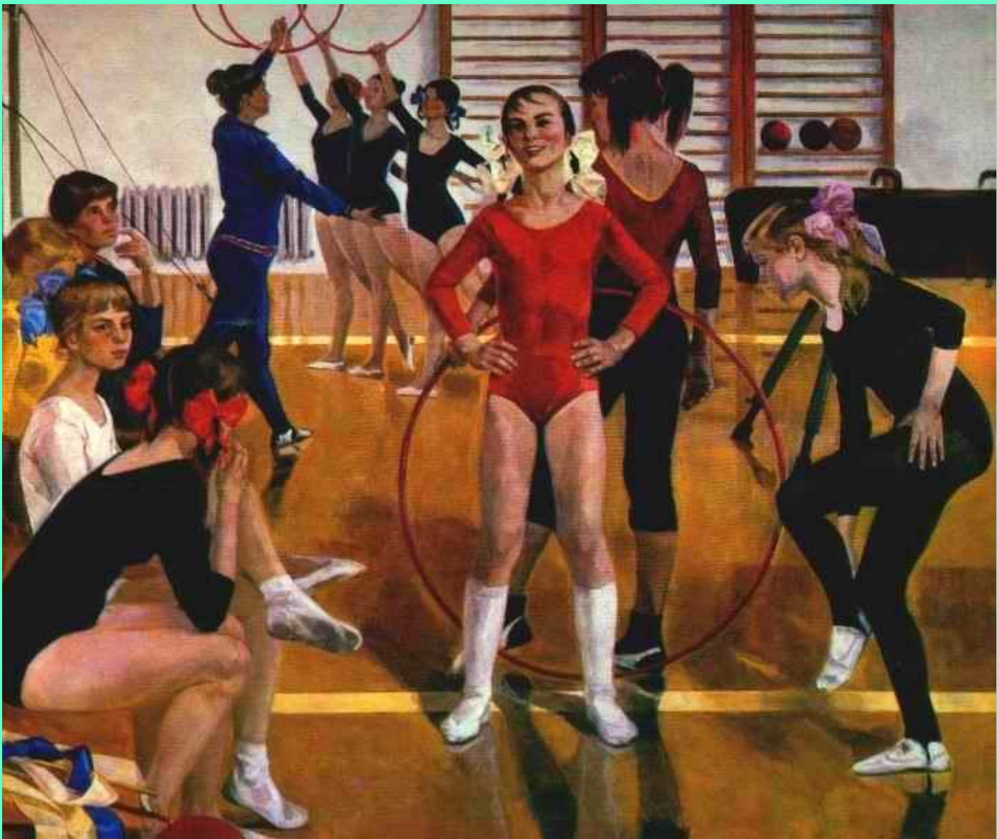
Детская спортивная школа. 1979