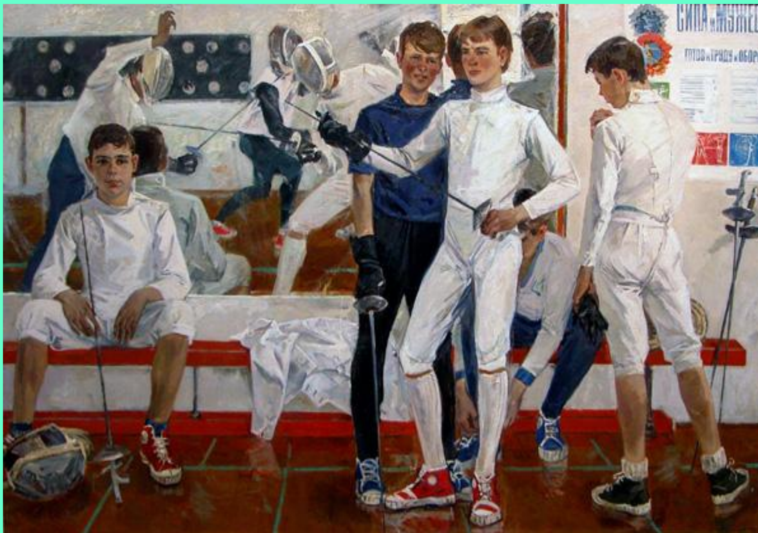
Юные мушкетеры. 1974