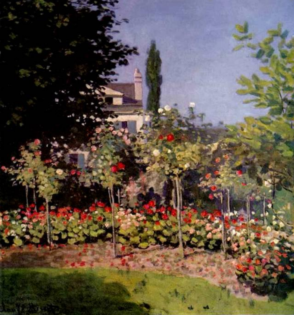
"Цветущий сад" (1866 г)