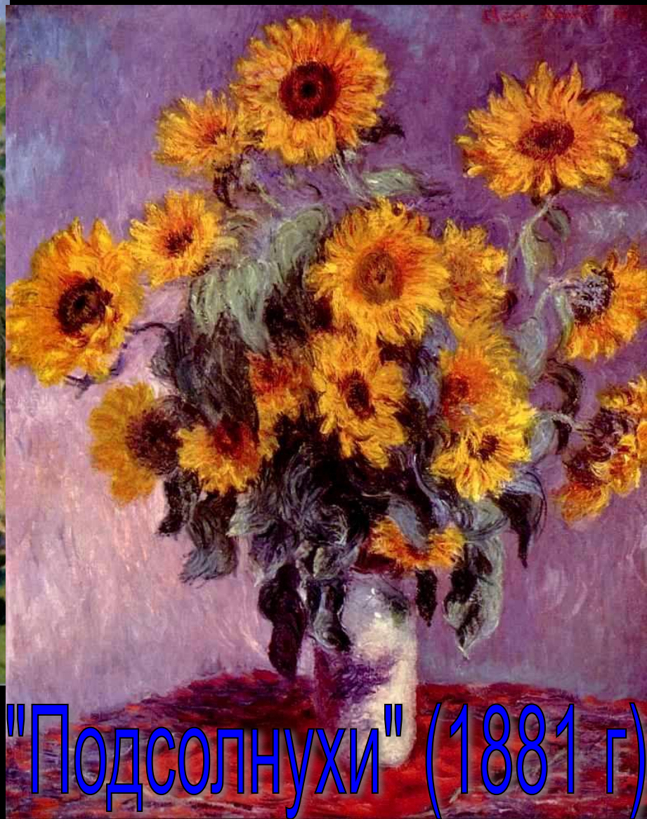
"Подсолнухи" (1881 г)