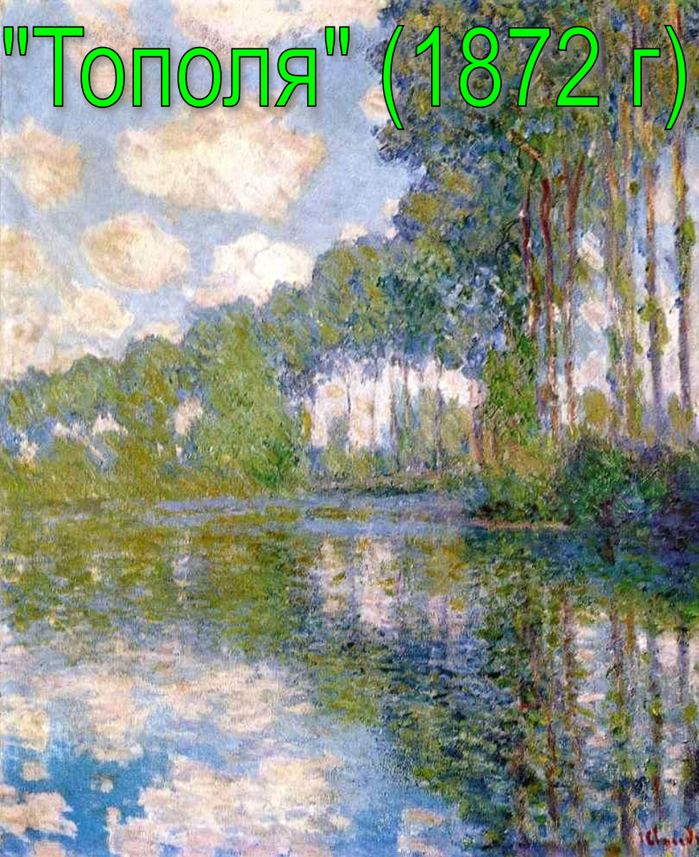
"Тополя" (1872 г)