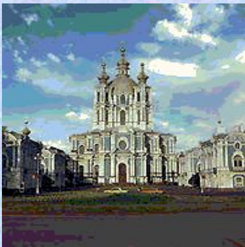
Собор Смольного монастыря. Архитектор В. В. Растрелли.