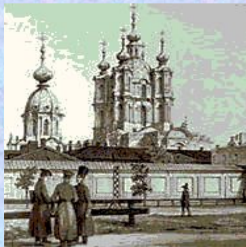
В.В. Растрелли. Смольный монастырь. Литография. XIX в.