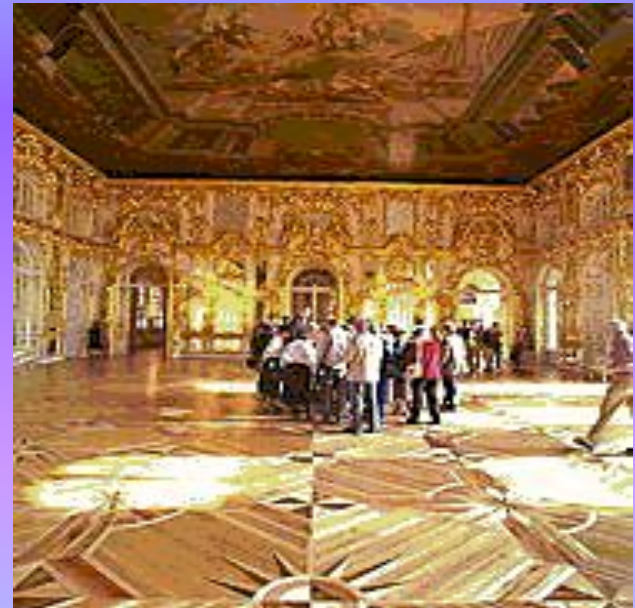
Зеркальный, или Большой, зал (1750-е годы, архитектор В. В. Растрелли) находится на втором этаже Екатерининского дворца