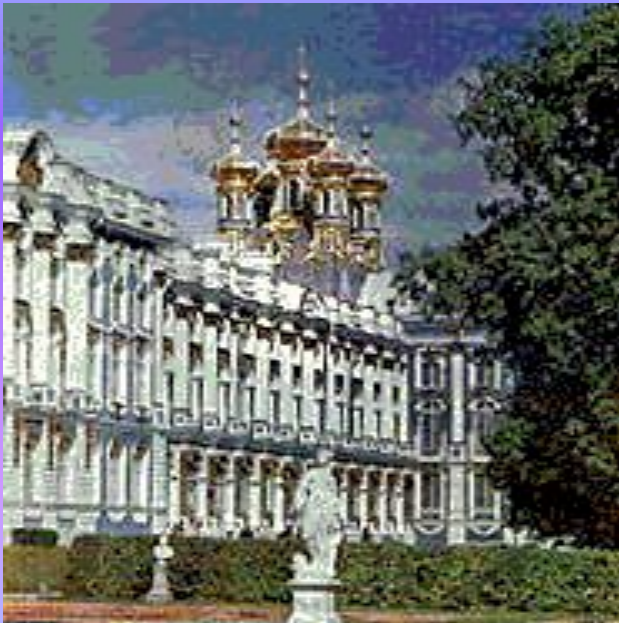
В. В. Растрелли. Екатерининский дворец в Царском Селе. 1752-1757.