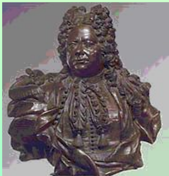
Бартоломео Карло Растрелли.

РАСТРЕЛЛИ (Rastrelli) Варфоломей Варфоломеевич (Бартоломео Франческо) (1700, Париж — 1771, Петербург ), граф, русский архитектор, итальянец по происхождению, сын Б. К. Растрелли. Один из величайших российских архитекторов 18 века наряду с Кваренги и Росси. Грандиозный пространственный размах, четкость объемов, строгую организованность планов сочетал с пластичностью масс, богатством скульптурного убранства и цвета, прихотливой орнаментикой.