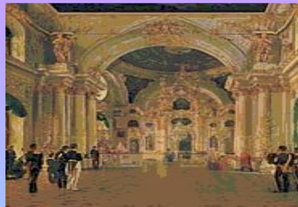
А. В. Тыранов. «Вид Большой церкви Зимнего дворца». 1829