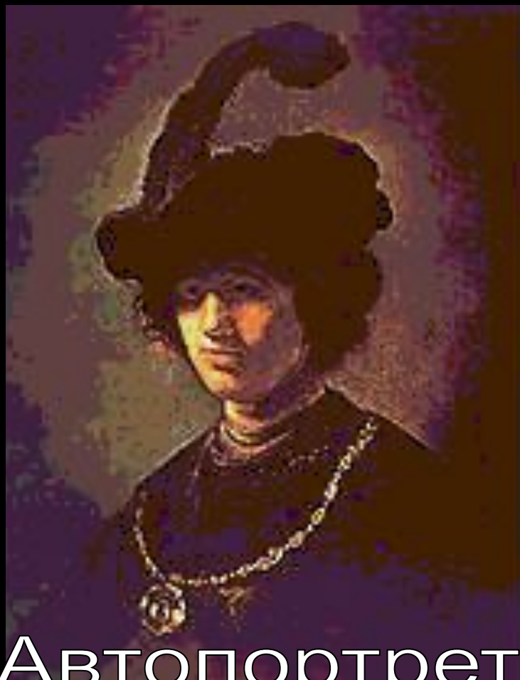
Автопортрет в молодости