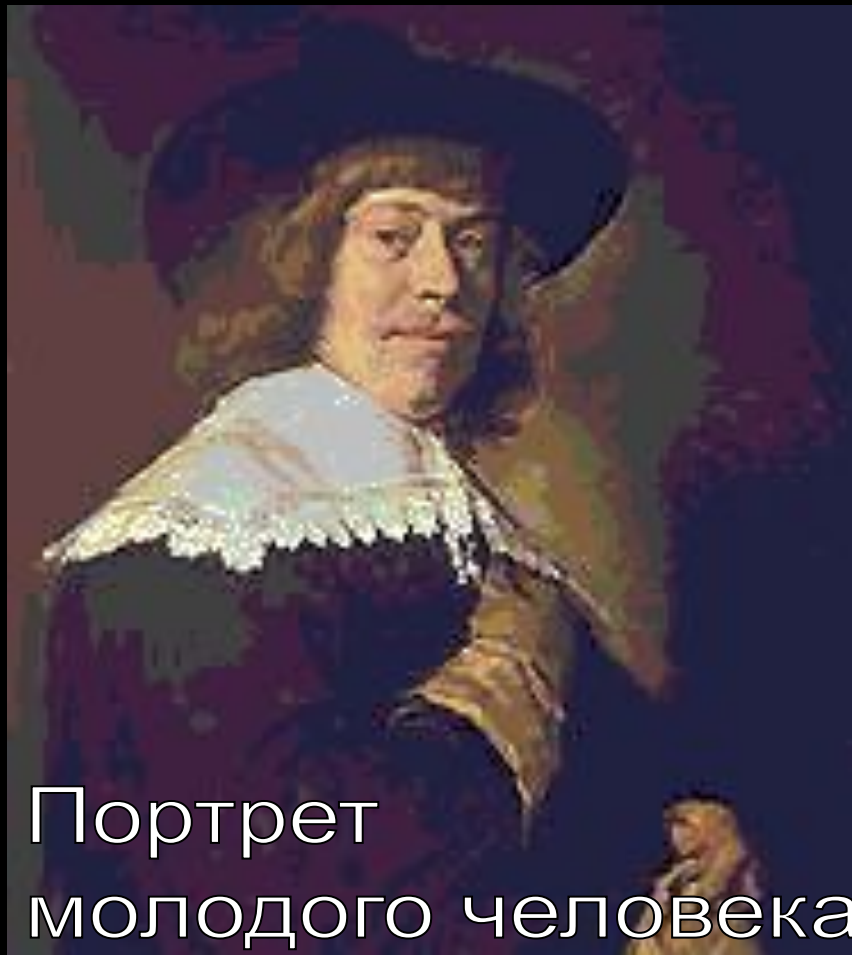
Портрет молодого человека с перчаткой