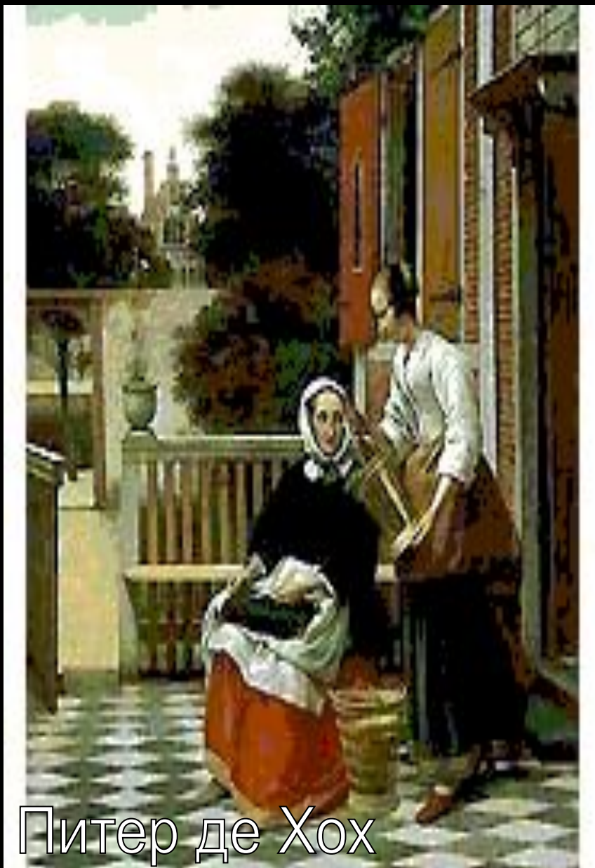
Питер де Хох