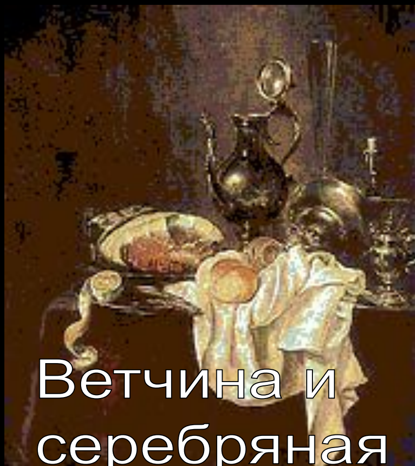
Ветчина и серебряная посуда