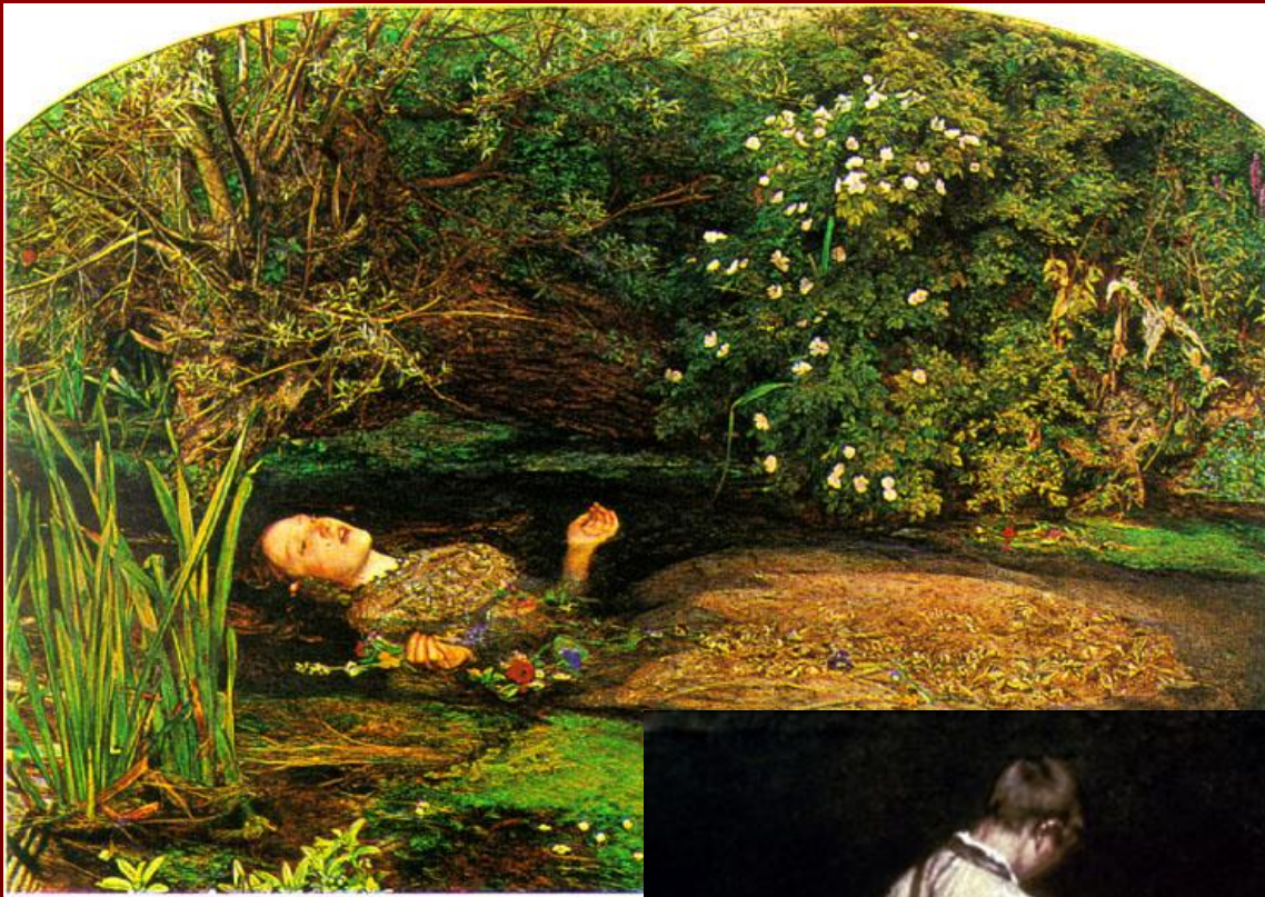
Д. Миллес «Офелия»