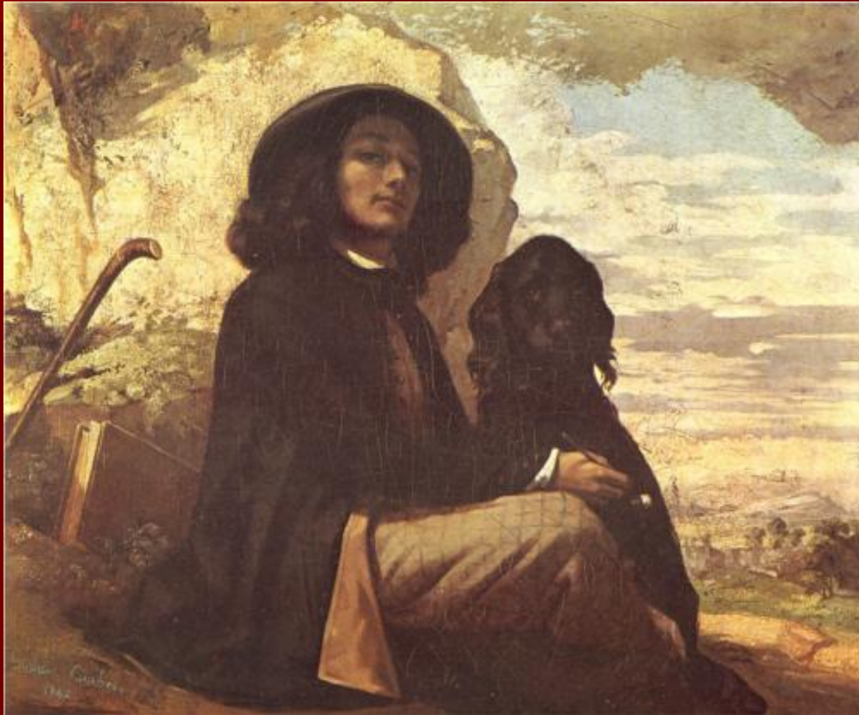
Автопортрет с черной собакой