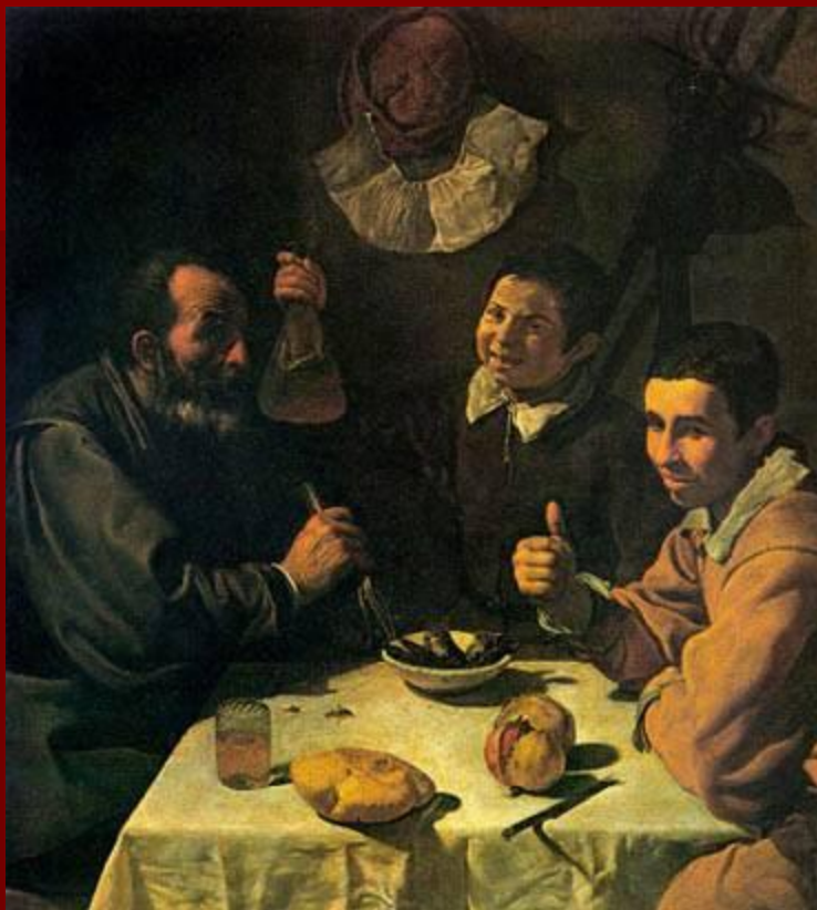
Д. Веласкес «Завтрак»