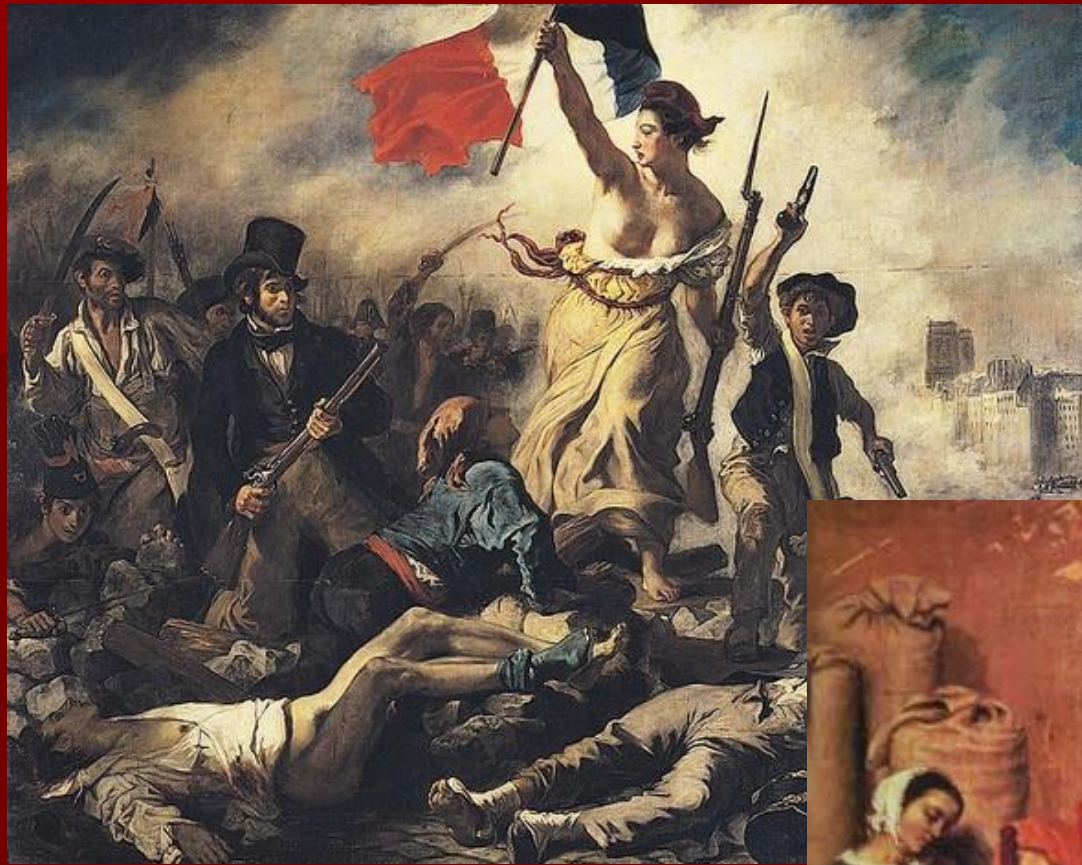
Э. Делакруа «Свобода, ведущая народ»