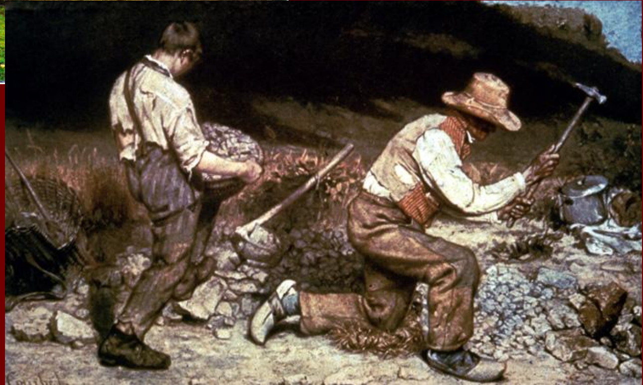
Г. Курбе «Дробильщики камня»