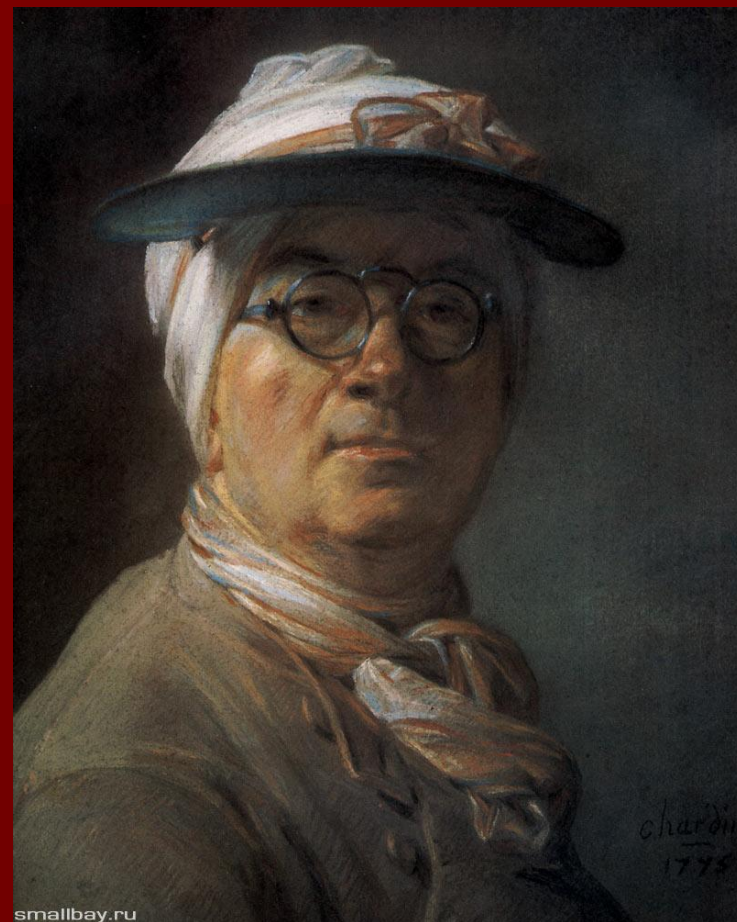
Ж. Шарден Автопортрет с козырьком