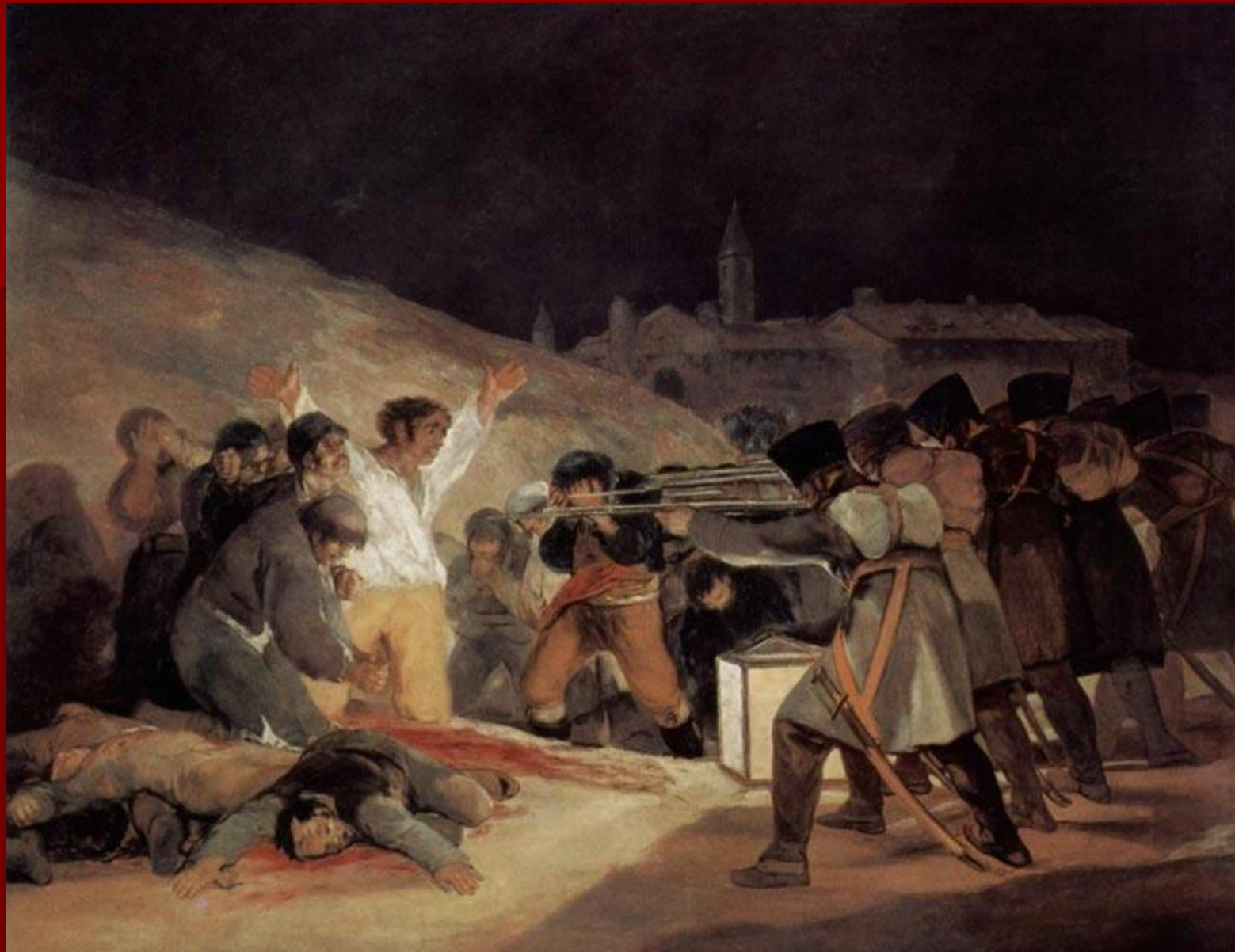
Ф. Гойя «Расстрел повстанцев в ночь на 3 мая 1808 года»