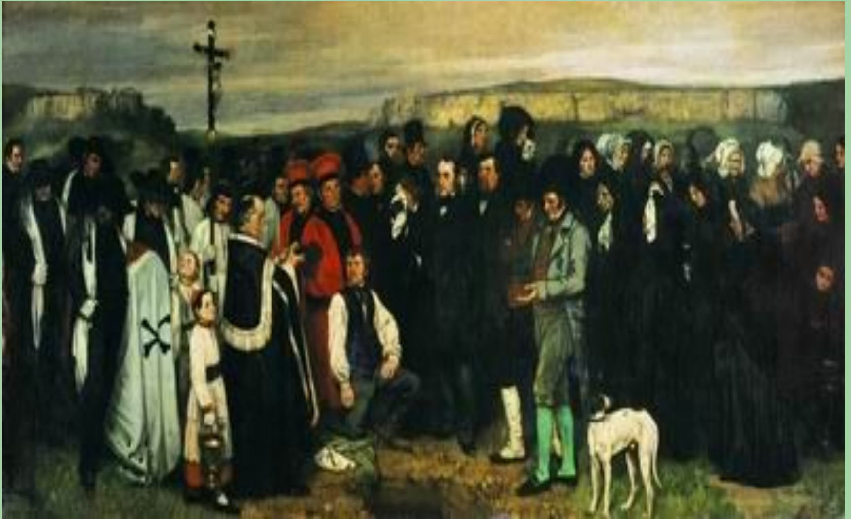
Похороны в Орнани Г.Курбе