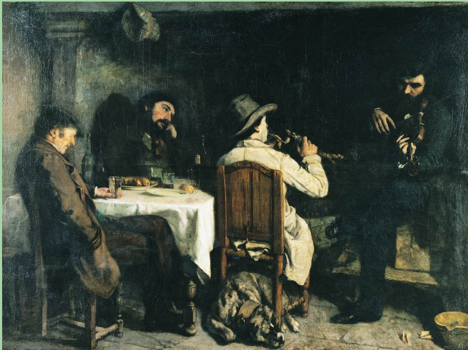
Послеобеденный отдых в Орнани Г. Курбе