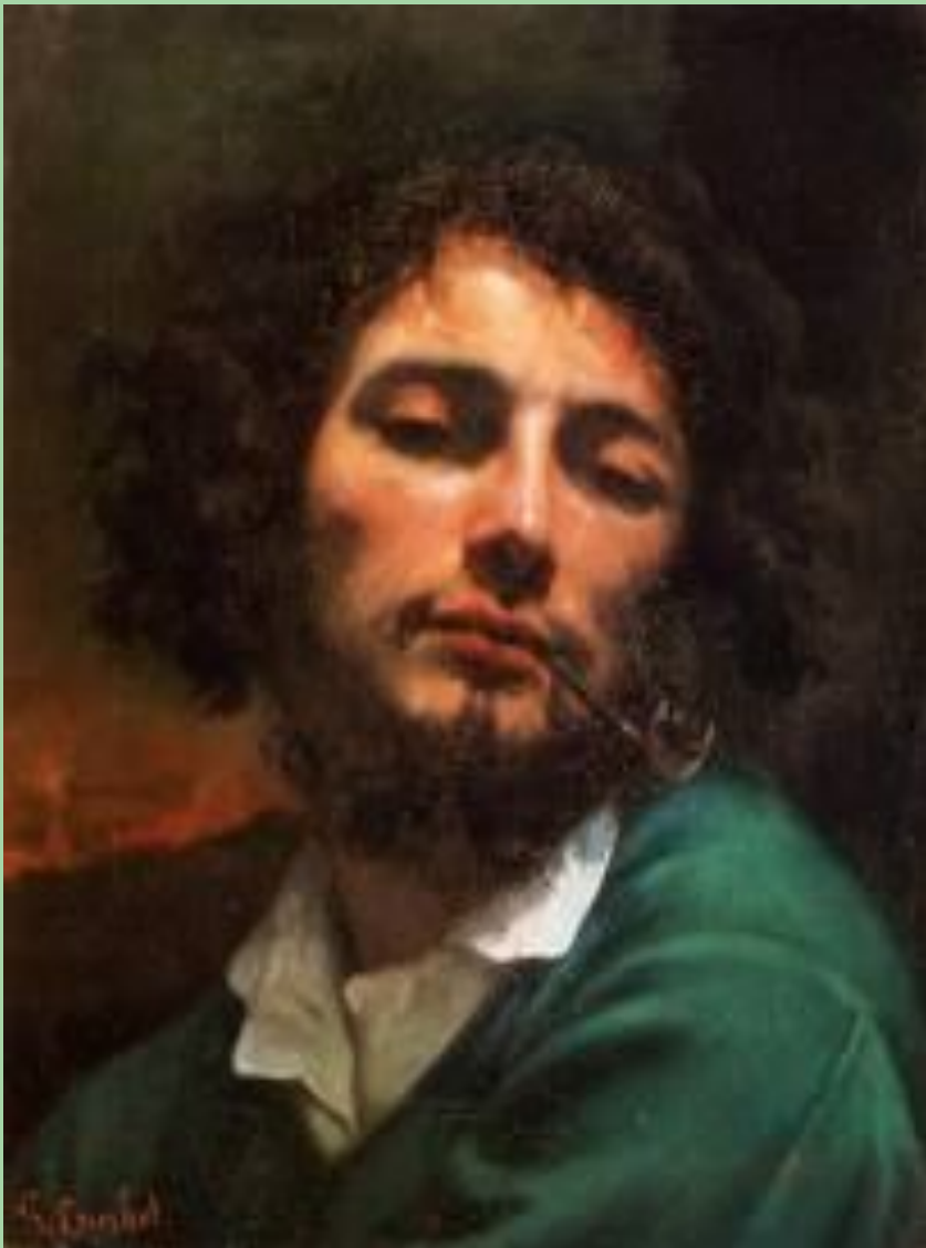
Автопортрет с курительной трубкой