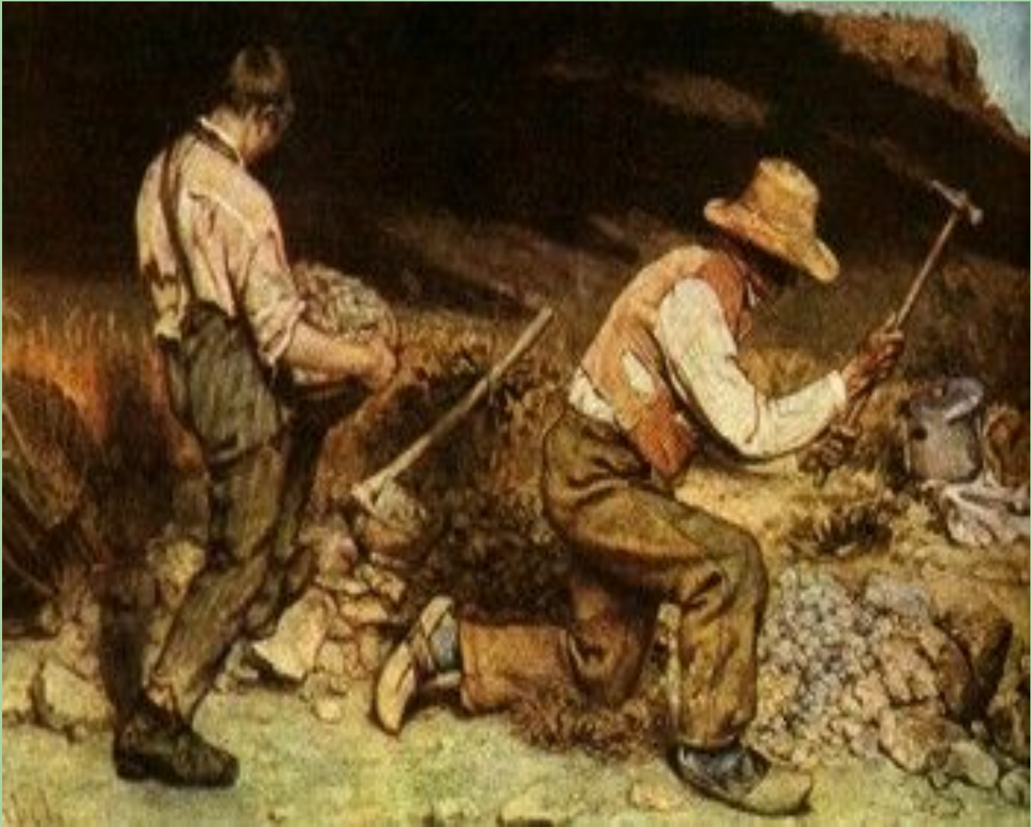
Дробильщики камней Г.Курбе