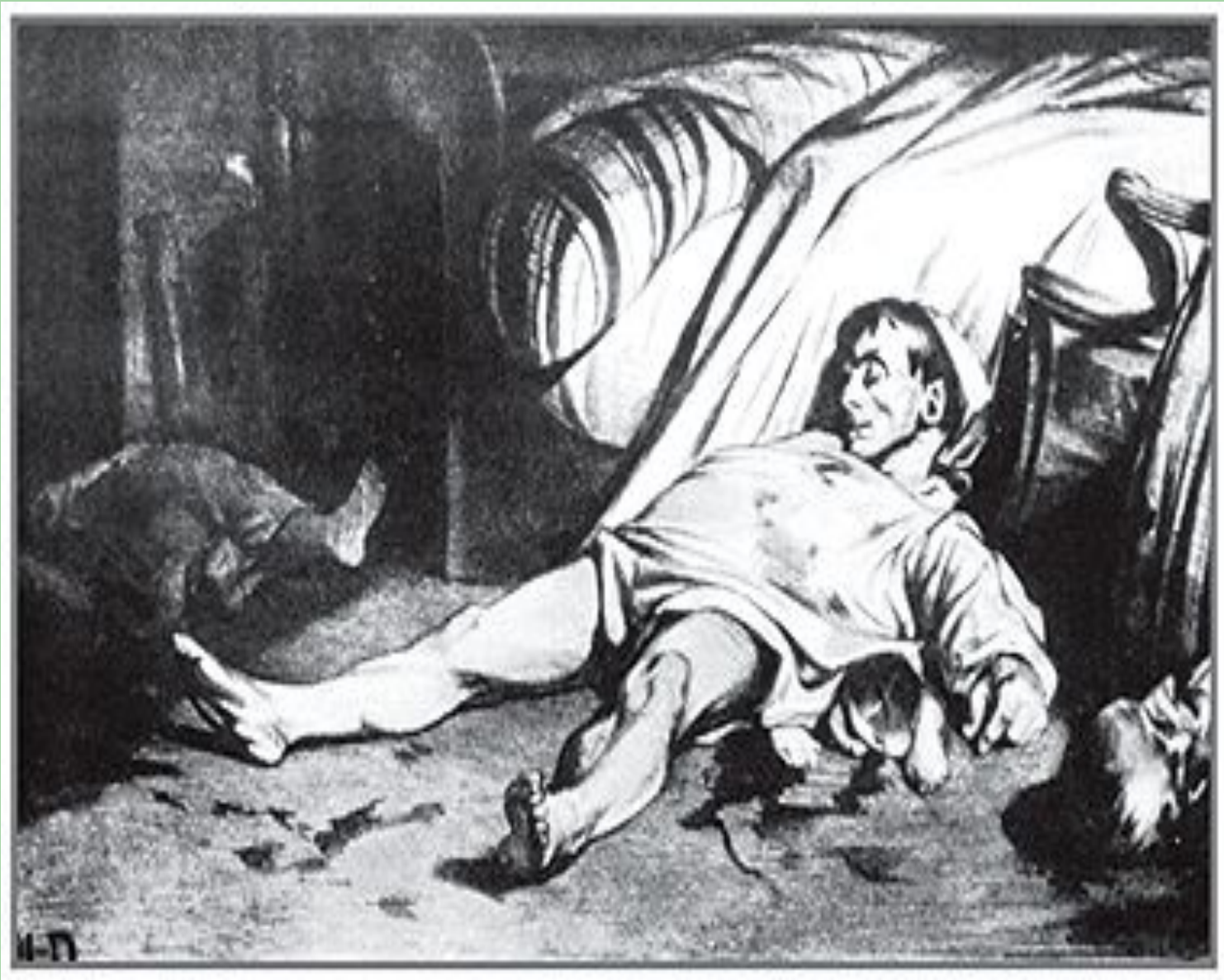
Улица Транснорен. 1834. Литография. О. Домье