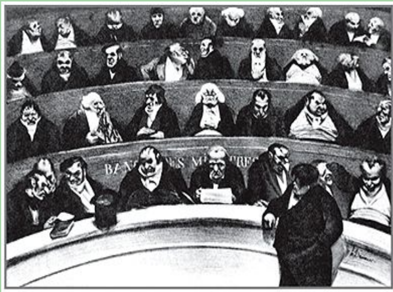
«Законотворительное чрево» Литография. О.Домье