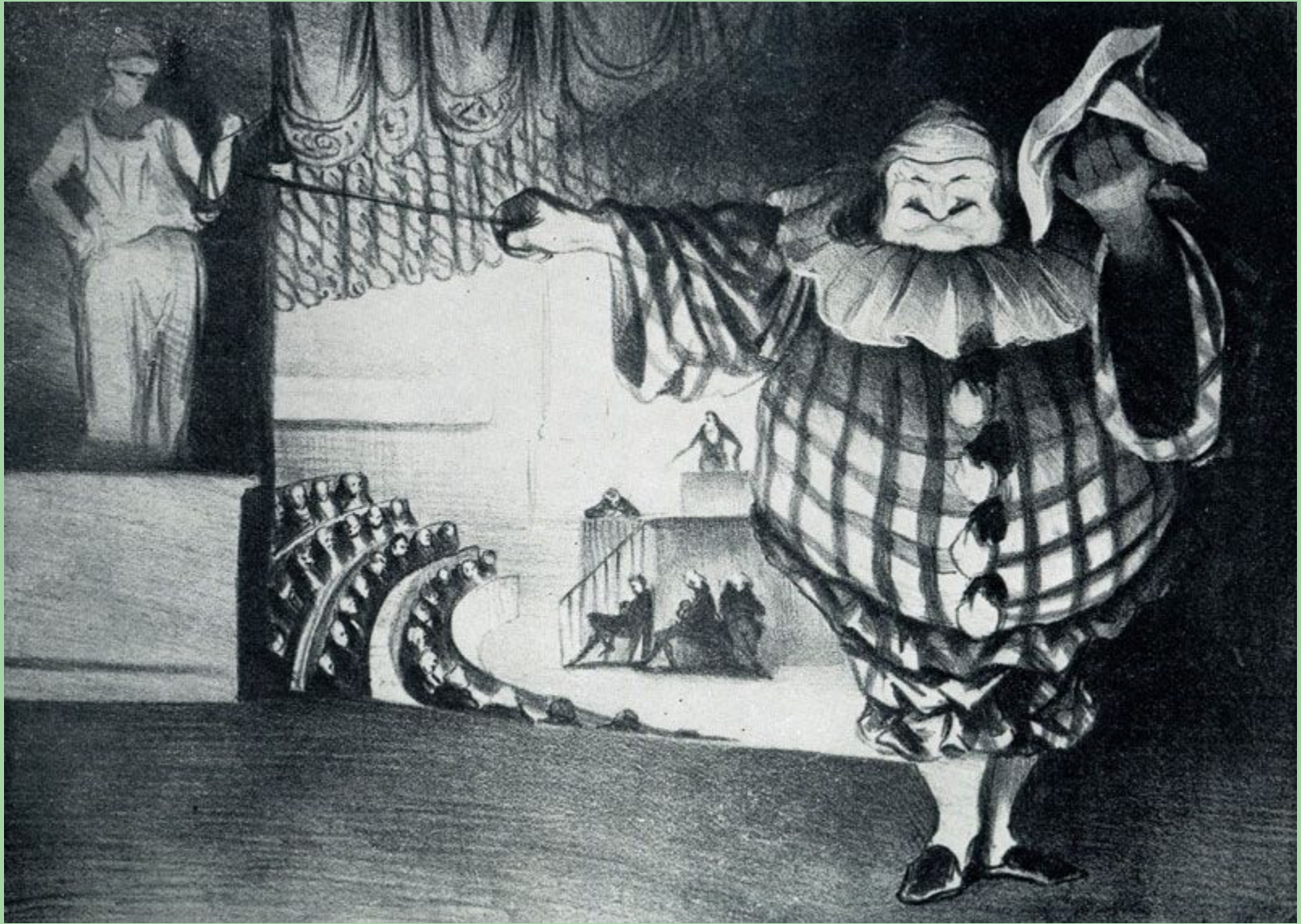
«Опустите занавес, фарс сыгран» Литография. Домье.