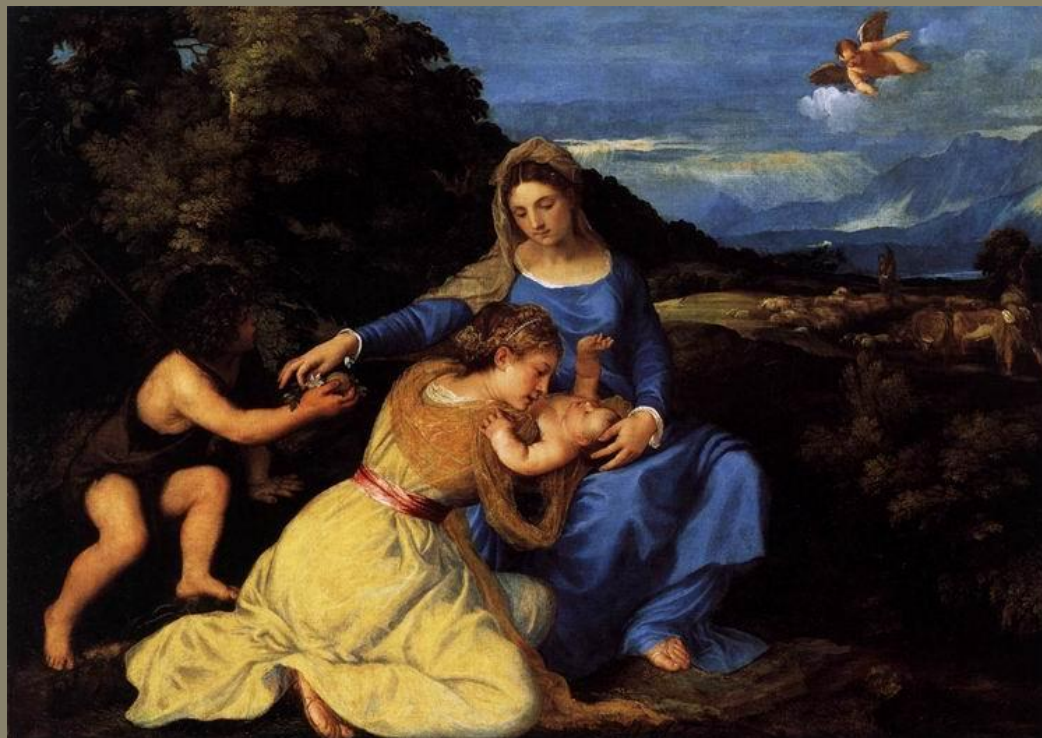
Мадонна с младенцем и святыми