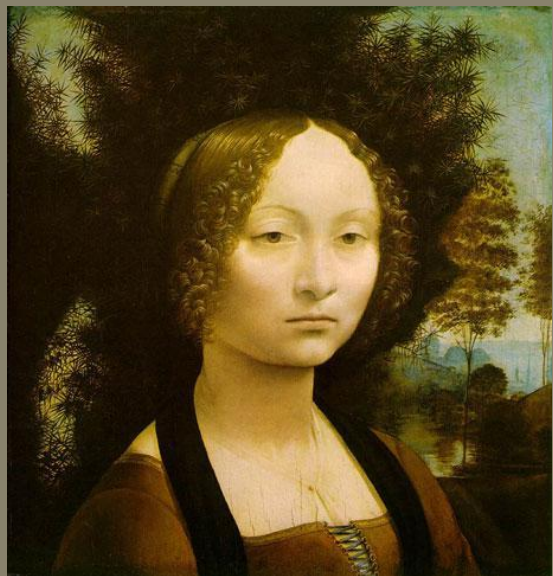
портрет Джиневры де Бенчи