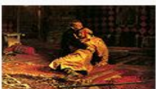
«Иван Грозный и его сын Иван 16 ноября 1581 года», 1870–1873, Государственная Третьяковская галерея, Москва