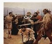
«Николай Чудотворец из Миры в Ликии», 1889