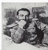
«Портрет писателя Александра Жиркевича», 1894