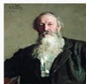
«Портрет Владимира Васильевича Стасова, русского музыкального»