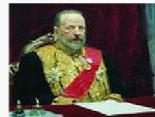
Портрет Витте с картины «Заседание Государственного Совета»