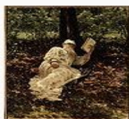
«Лев Николаевич Толстой на отдыхе в лесу», 1893