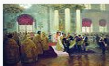
«Венчание Николая II и великой княжны Александры Федоровны», 1894