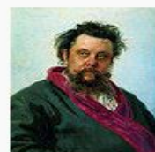
«Портрет композитора Модеста Петровича Мусоргского»