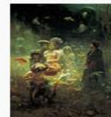
«Садко в Подводном царстве», 1876, Государственный Русский музей