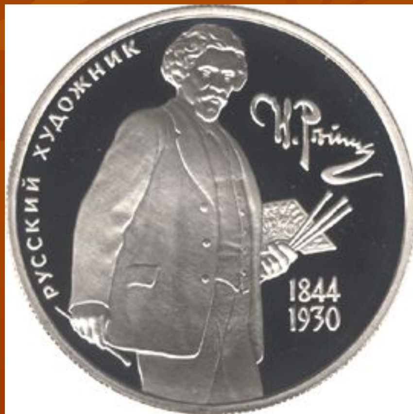
Монета Банка России — Серия: «Выдающиеся личности России», 150-летие со дня рождения И.Е. Репина, 2 рубль, реверс.