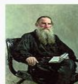
«Портрет Льва Толстого», 1887