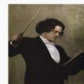
«Портрет композитора Антона Григорьевича Рубинштейна»