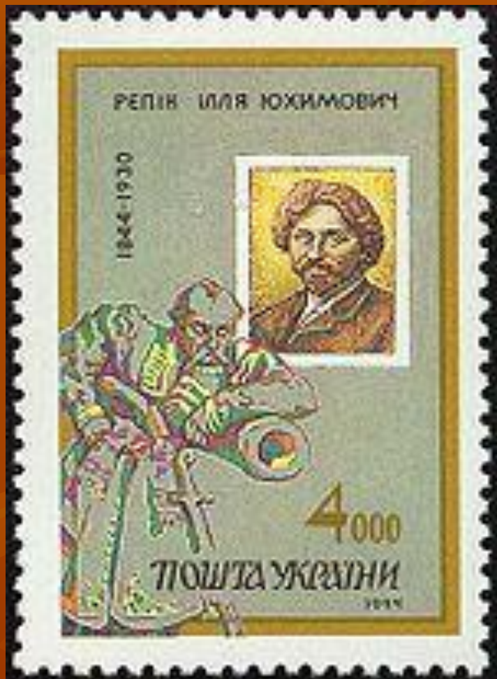
Почтовая марка Украины, посвящённая Репину, 1994