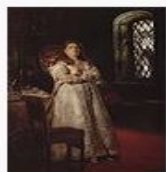
«Великая княгиня Софья в Новодевичьем монастыре»