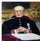
«Константин Победоносцев» (набросок)