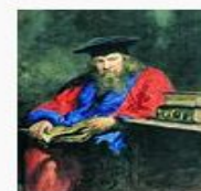
«Портрет Д. И. Менделеева»