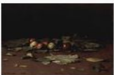
«Яблоки и листья», 1879, Государственный Русский музей