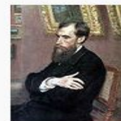
«Портрет Павла Михайловича Третьякова, основателя Галереи»