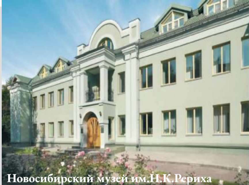
Новосибирский музей им.Н.К.Рериха