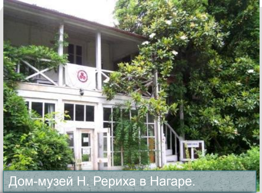
Дом-музей Н. Рериха в Нагае.

Самое большое собрание его картин находится в Нью-Йорке, в музее его имени, - основанном при жизни самим Н.К.Рерихом и его сподвижниками. В нашей стране – в Москве (в МЦР, где собраны картины, архив, библиотека и семейные реликвии, завещанные им при жизни своей стране), музее Востока, а также в Санкт-Петербурге, Нижнем Новгороде, Новосибирске и других городах. Много картин находится в Индии, большая часть которых была подарена им в дар индийскому народу.