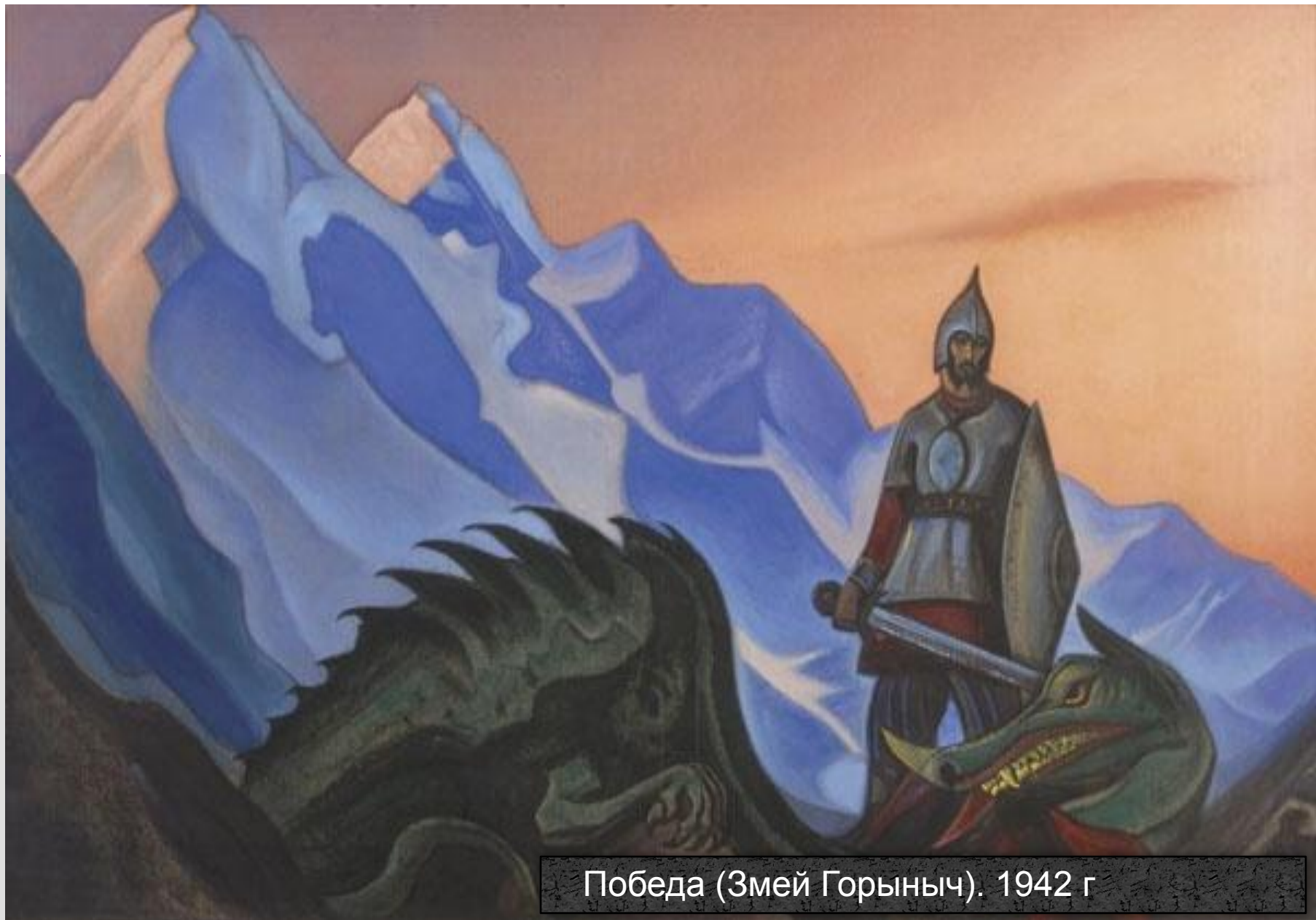
Победа (Змей Горыныч). 1942 г