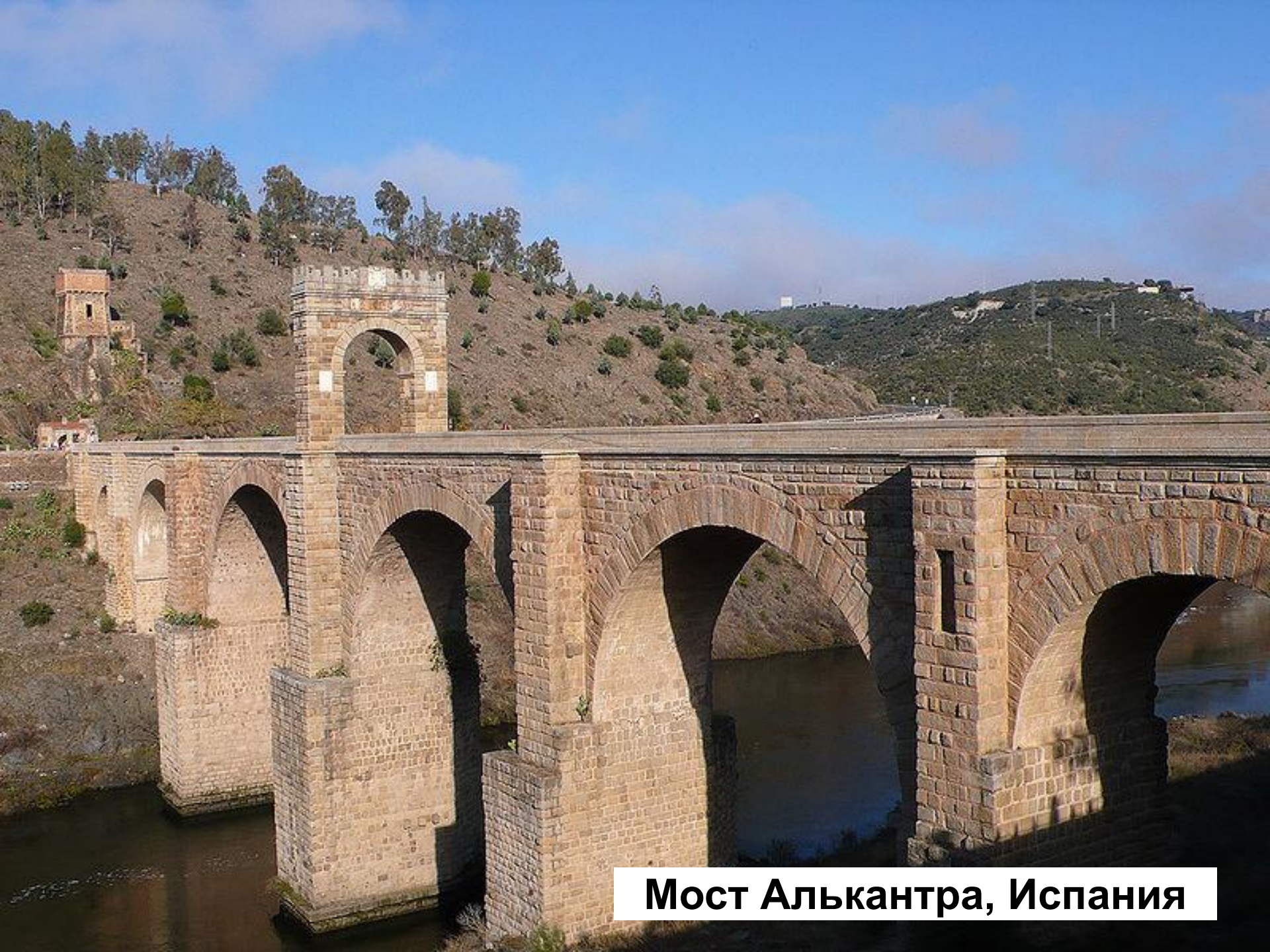
Мост Алькантра, Испания