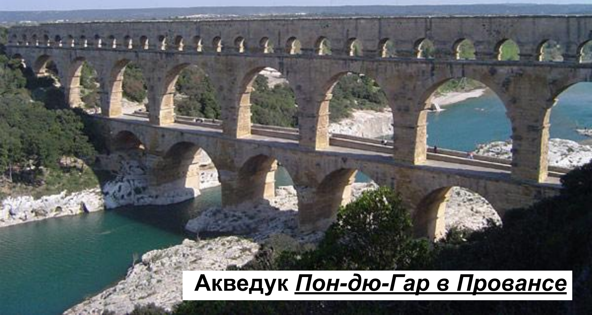
Акведук Пон-дю-Гар в Провансе