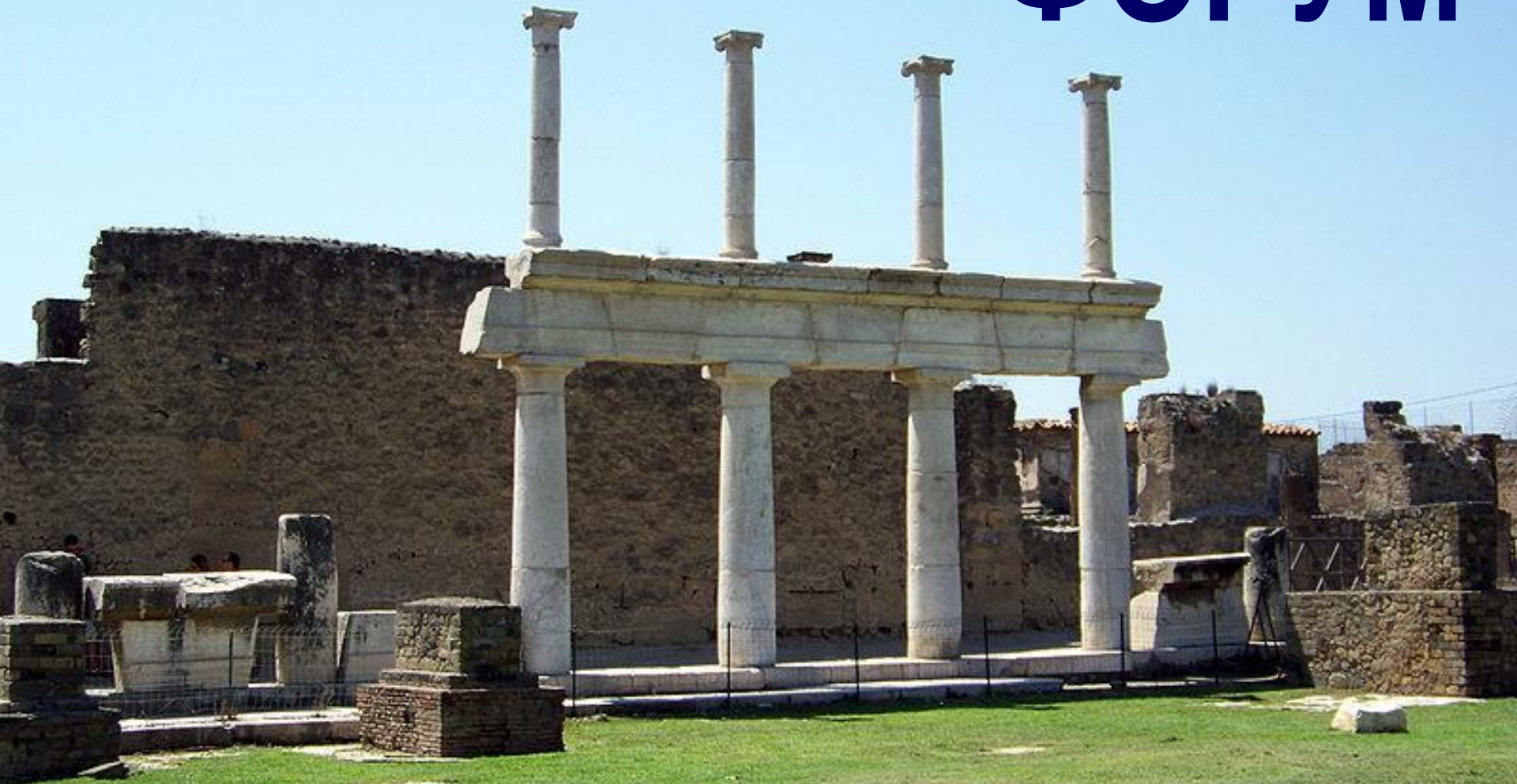
Форум в Помпеи