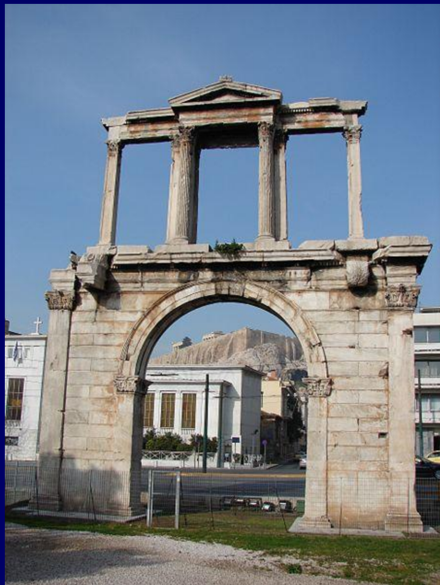
Арка Адриана в Афинах