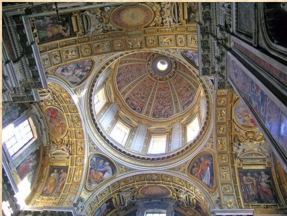
Барокко в архитектуре. Италия, Рим.

Барокко (букв. Странный, причудливый) – стиль искусства, возникающий в Италии в конце XVI века, характерный для художественной культуры до конца XVIII века. Эстетические принципы барокко: