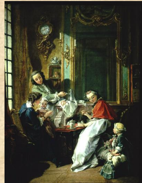
Франсуа Буше. «Завтрак» (1739).

В Италии крупнейший представитель того времени — Джамбаттиста Тьеполо. Большое внимание тогда уделялось фрескам, росписи потолков, сводов, стен. Видным художником является Пьетро Лонги. Его бытовые сцены вполне соответствуют характеру стиля рококо — уютные гостиные, праздники, карнавалы. Кроме этого в Италии в это время развилось и другое направление, которое не совсем вписывается в рамки стиля. Это — ведутизм, реалистическое и точное изображение городских видов, прежде всего Венеции. Здесь преобладает принцип точной передачи действительности. Виды Венеции пишут Каналетто и Франческо Гварди. Бернардо Беллотто работал также в Германии. Его кисти принадлежат великолепные виды Дрездена и других мест.