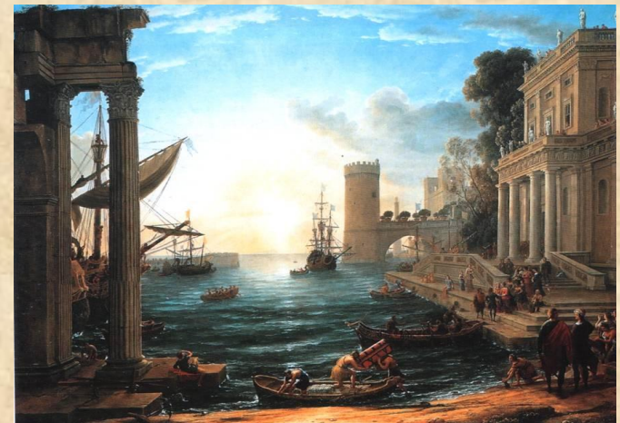
Клод Лоррен Хранящаяся в Лондонской Национальной галерее картина Отплытие царицы Савской (1648).