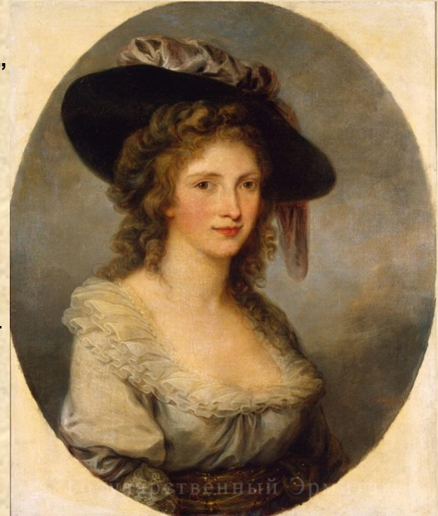
Ангелика Кауфман. Автопортрет (1782).

Разнообразие условий социокультурной жизни XVIII века детерминировало специфику процессов Просвещения в европейских странах. Выделяют английское Просвещение, идеалы которого оформились под влиянием идей Джона Локка и Т. Гоббса. Французское Просвещение испытало сильное воздействие аристократической культуры, и в то же время ему присущи свободомыслие и радикализм, конфликты с католической церковью и государственной властью. Атеистические взгляды, критика религии и церкви характерны для Д. Дидро, П.Гольбаха, Гельвеция, Ж.Ж.Руссо. Немецкое Просвещение развивалось в русле реформы образования, создания начальных школ и профессионального обучения. В рамках деятельности просветителей рождается романтизм как художественное и идейное направление. ( Его представителями были Новалис, Ф.Шиллер, Гете, А.Шлегель).