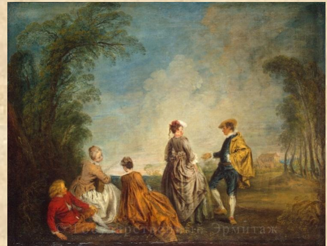
Художественная культура Нового времени.

Характерной чертой культуры становится ее светский характер, т.к. религия все в меньшей степени оказывает воздействие на другие ее сферы. Рост городов и городского населения ведут к формированию урбанистической культуры.