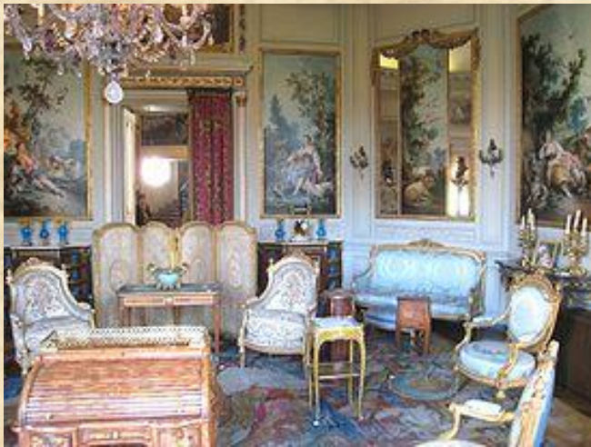
Интерьер в стиле Луи XV (музей Ниссим-де-Камондо)

В 1708 году алхимик Иоганн Фридрих Бётгер открыл секрет изготовления фарфора и нашел подходящую для этого глину. В Майсене была открыта первая, где первым мастером был Иоганн Готтлиб Кирхнер. Фарфор получает популярность, появляются и другие центры его производства. Наиболее знаменитой была мануфактура в Севре, где работал Этьен Морис Фальконе. Кроме фарфора — в моде серебро. Изготавливаются шоколадницы, супницы, кофейники, блюда, тарелки и другое. В этом веке рождается кулинарное искусство в его современном виде, в том числе — искусство сервировки стола.