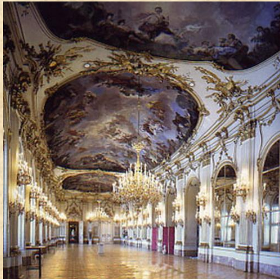
Интерьер в стиле барокко.

Социально-политические преобразования в Европе, французская революция и войны начала XIX века изменили лицо культуры, похоронили веру в возможность ненасильственного прогресса, но, в то же время, детерминировали процессы формирования культуры нового типа – культуры индустриального общества и техногенной цивилизации.