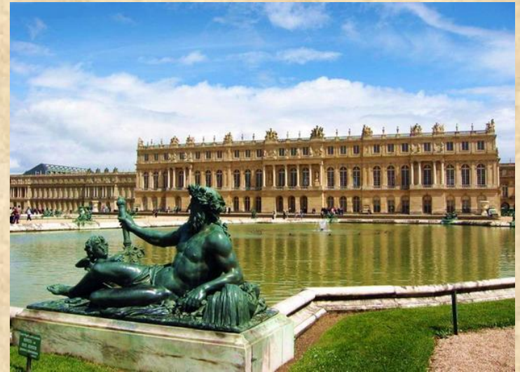
Классицизм в архитектуре.

Классицизм проявил себя прежде всего в архитектуре (К.Леду, Ж.Габриэль, Ф.И.Казаков), в живописи (Н.Пуссен, Ж.Л.Давид, Д.Рейнолдс, Т.Гейнсборо), в музыке и литературе. Фактически в истории культуры классицизм явился последним целостным художественным направлением с единой стилевой ориентацией и канонами эстетического творчества.