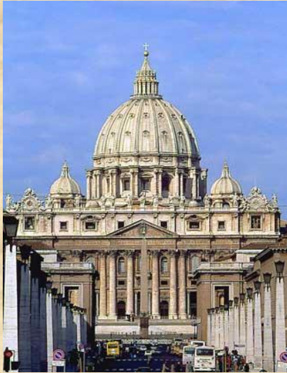
Барокко в архитектуре.

Противоречивость и полифоничность социокультурных изменений Нового времени появились в антитезе, противоположности таких направлений художественной культуры как барокко и классицизм.