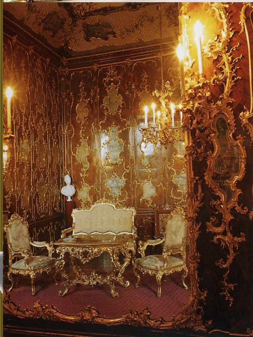
Миллионная комната. Дворец Шёнбрунн. 1767. Вена.