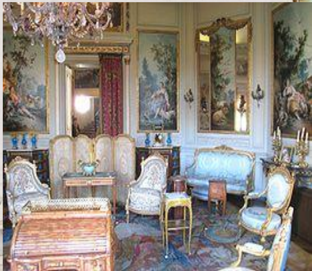
Интерьер в стиле Луи XV. Музей Ниссим-де-Камандо.