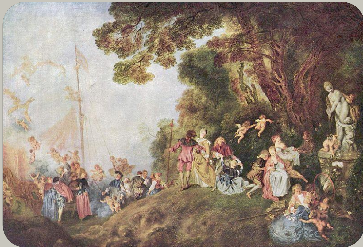
Антуан Ватто. «Отплытие на остров Цитеру» (1721)

Впервые черты этого стиля проявились в творчестве Антуана Ватто, у которого главной темой были галантные празднества.