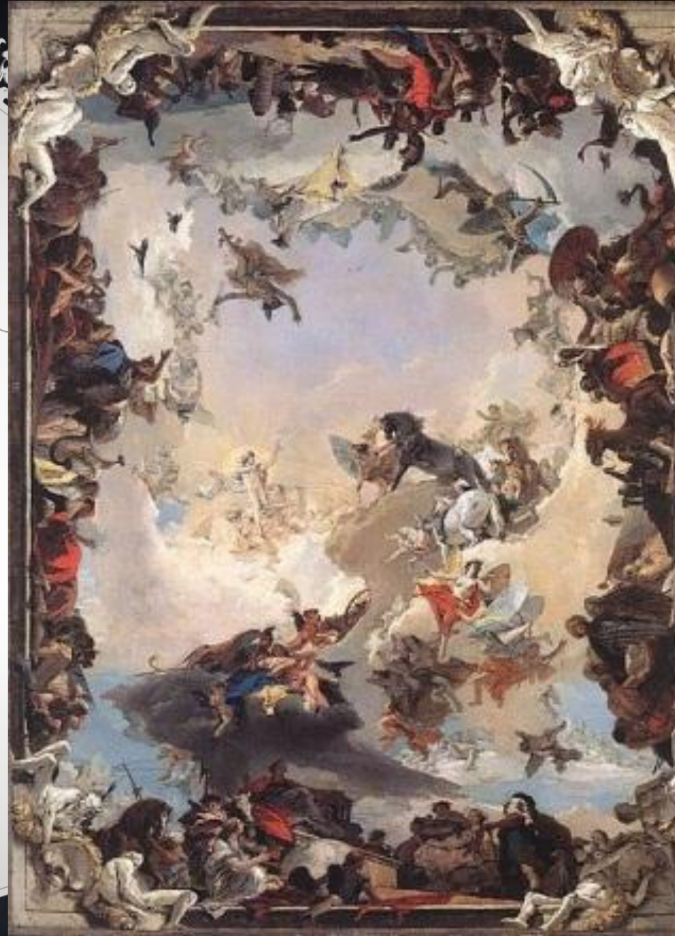
Джамбаттиста Тьеполо. Аллегорическая роспись плафона Вюрцбургской резиденции.

В Италии крупнейший представитель того времени — Джамбаттиста Тьеполо (1696, Венеция — 1770, Мадрид). Большое внимание тогда уделялось фрескам, росписи потолков, сводов, стен. Такие росписи есть, например, в вестибюле Зимнего дворца.