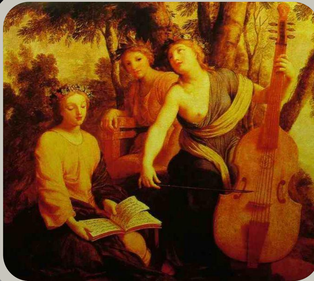
(XVIII век). «Три музы в поте лица».

Поскольку музыка звучала на светских приёмах и во время еды, особо приветствовались разные выдумки, карнавальные имитации и остроумные развлекательные приёмы для увеселения аристократических слушателей. Неизменной популярностью пользовались яркие звукоизобразительные пьесы, например, такие, как «Курица» Рамо (для клавесина) или «Маленькие ветряные мельницы» Куперена