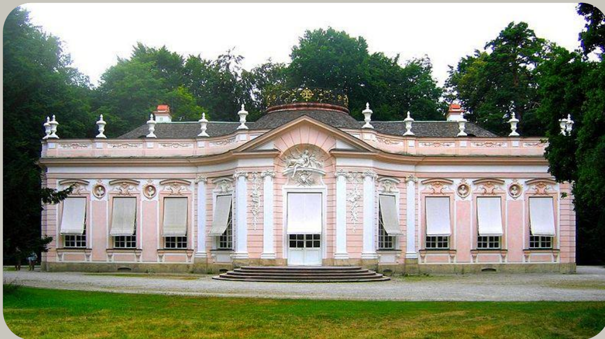
Французское рококо: Амалиенбург под Мюнхеном

Архитектурный стиль рококо появился во Франции во времена регентства и достиг апогея при Людовике XV, перешёл в другие страны Европы и господствовал в ней до 1780-х годов.