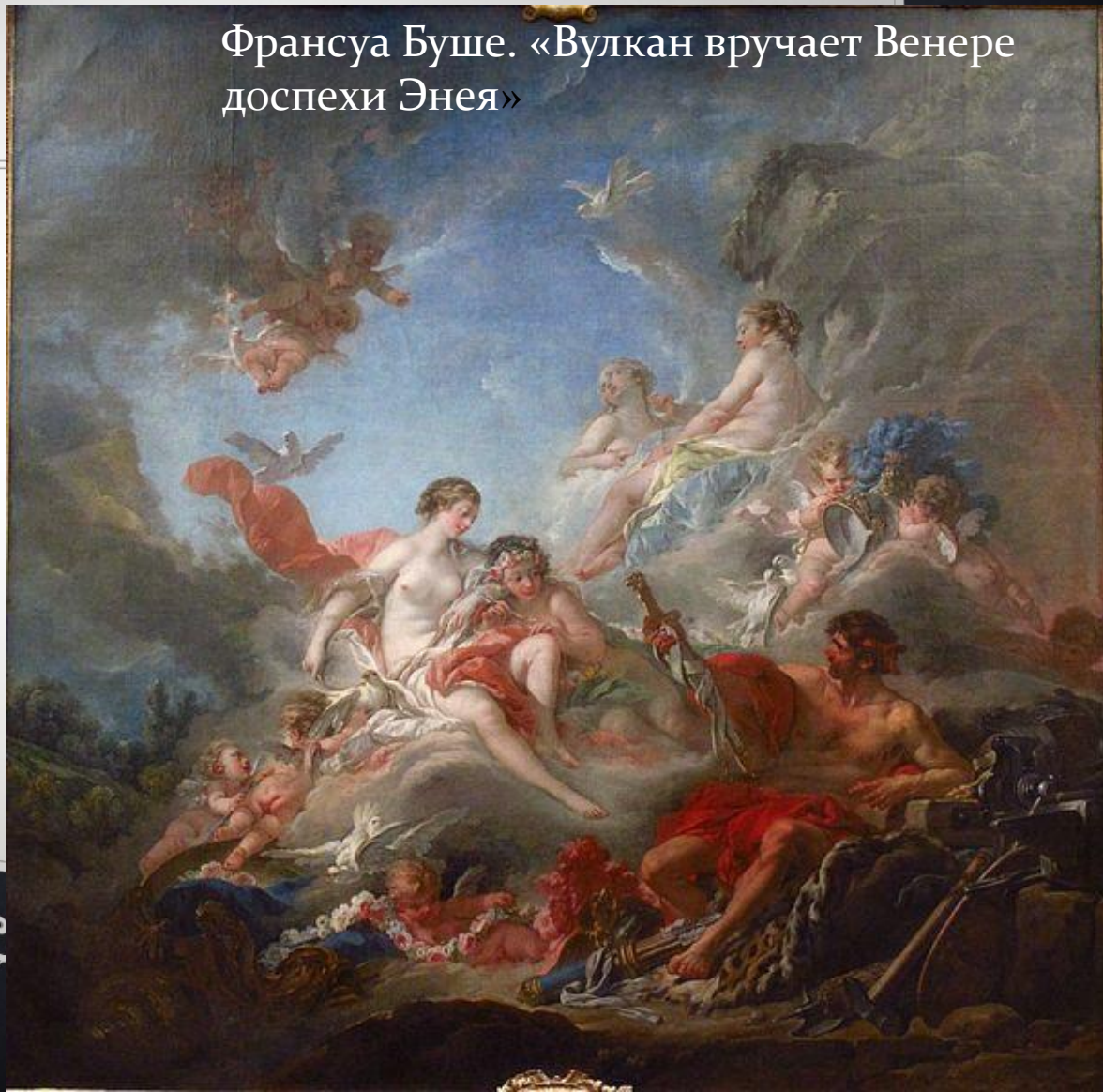
Франсуа Буше. «Вулкан вручает Венере доспехи Энея»

Другой, характерной чертой того времени была эротика. Создано много картин, изображающих обнаженную натуру, различных нимф, Венеру. Крупнейший представитель рококо во Франции — Франсуа Буше, работавший в жанре портрета и пейзажа.