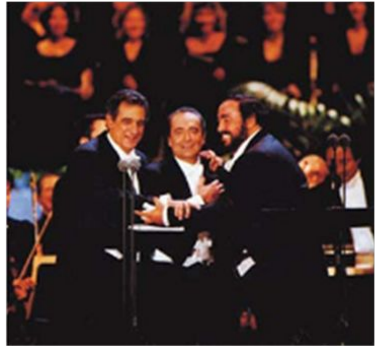
П. Доминго, Х. Каррерас, Л. Паваротти

К такого рода проектам можно отнести известные на весь мир выступления трех великих теноров («Три тенора»): итальянца Лучано Паваротти, испанцев — Пласидо Доминго и Хосе Каррераса, в исполнении которых звучала как классическая музыка, так и обработки произведений популярной современной музыки.