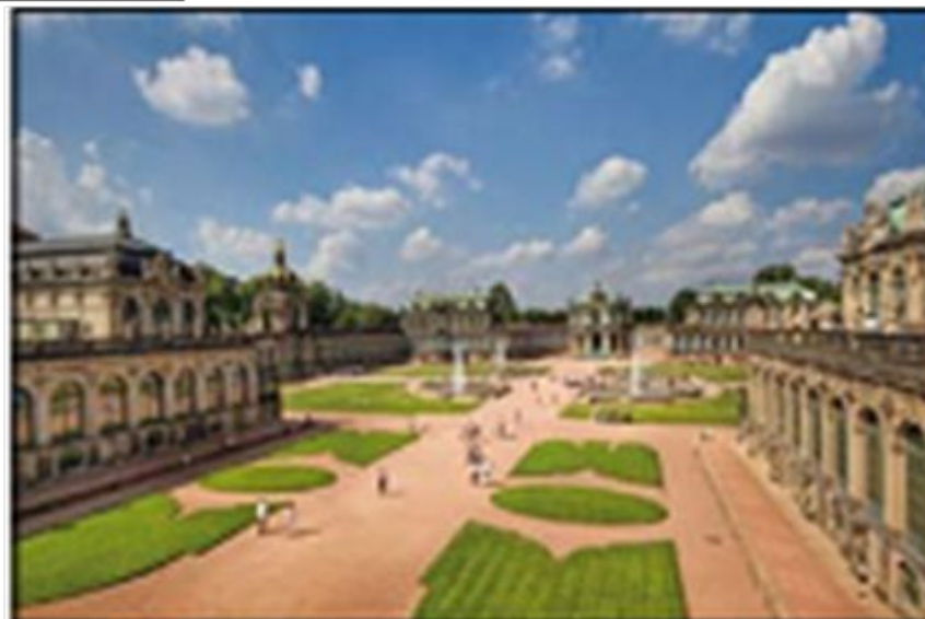
Национальная картинная галерея. Дрезден