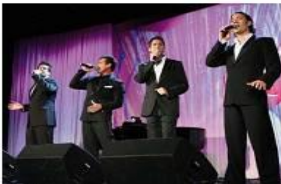
«El Divo». Кларетт «Детская Новая Волна»