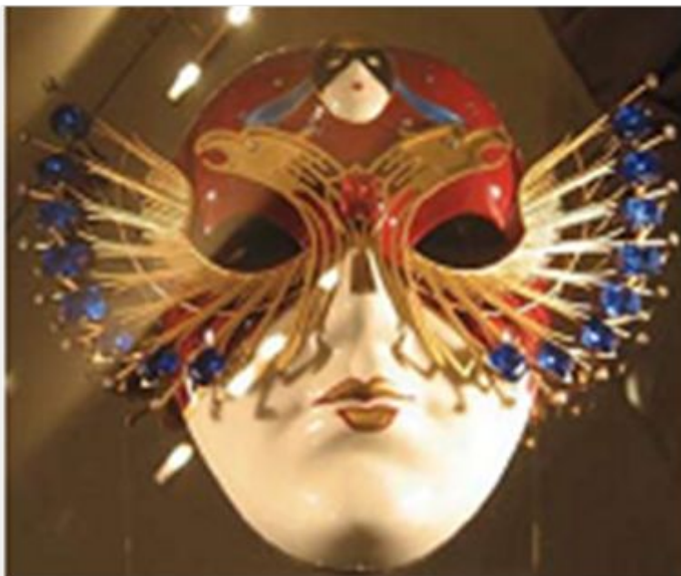
Эмблема театрального фестиваля «Золотая маска»

Союзом театральных деятелей в конце прошлого века (1994 г.) были учреждены театральный фестиваль и национальная премия «Золотая маска». Первая «Золотая Маска» вручалась за достижения только в области драматического театра. Позже эта премия стала присуждаться и в области музыкального театра. Ее лауреатом в этой номинации стал дирижер и руководитель театра «Новая опера» Евгений Колобов. Первая «Золотая Маска» в номинации «За честь и достоинство» была присуждена легендарной балерине Галине Улановой.