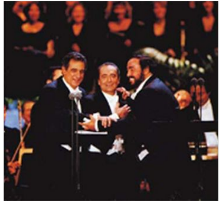
П. Доминго, Х. Каррерас, Л. Паваротти

К такого рода проектам можно отнести известные на весь мир выступления трех великих теноров («Три тенора»): итальянца Лучано Паваротти, испанцев — Пласидо Доминго и Хосе Каррераса, в исполнении которых звучала как классическая музыка, так и обработки произведений популярной современной музыки.