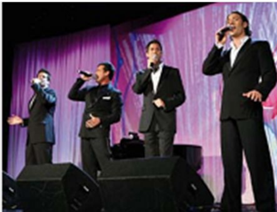
«El Divo». Квартет

Интересным явлением в мире современной эстрады стал вокальный квартет « Il Divo » («Диво»), который исполняет как популярные хиты, так и оперные арии, хорошо знакомые широкой публике.