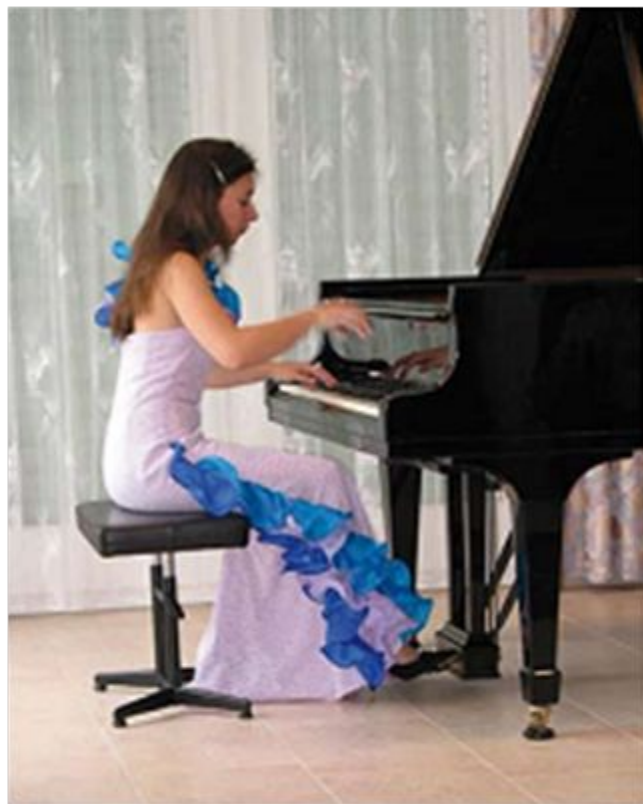
На музыкальном конкурсе «Щелкунчик»

Широкая панорама детских международных конкурсов — фестиваль-конкурс детского и юношеского творчества «Открытая Европа», конкурс «Молодой балет мира», конкурс хореографических коллективов «Петербургская метелица», конкурс детских рисунков, всемирные Дельфийские игры, конкурс исполнителей популярной песни «Детская новая волна» и др. — свидетельствует о большом внимании к выявлению творческих дарований молодежи.