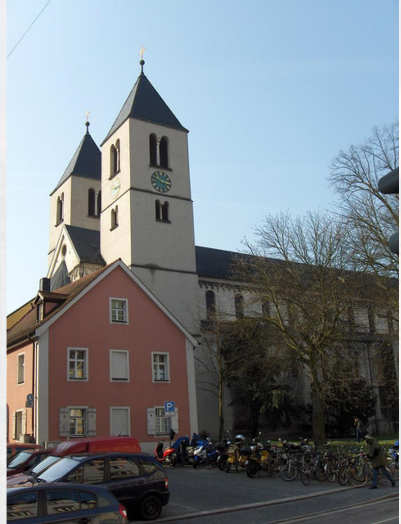
Церковь Святого Якоба, Германия

Для романских построек характерно сочетание ясного архитектурного силуэта и лаконичности наружной отделки – здание всегда гармонично вписывалось в окружающую природу, и поэтому выглядело особенно прочным и основательным. Этому способствовали массивные стены с узкими проёмами окон и ступенчато-углублёнными порталами. Такие стены несли в себе оборонительное назначение.