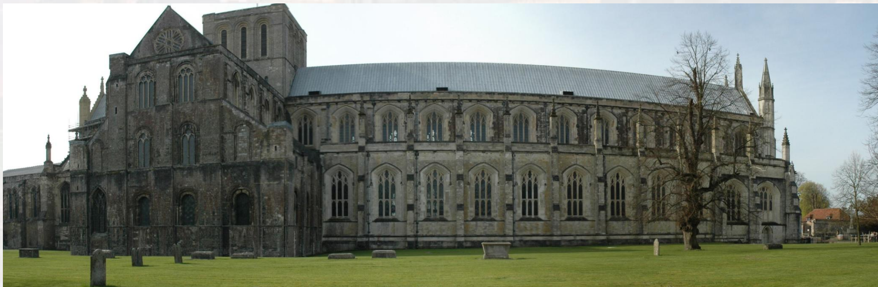
Уинчестерский собор , Великобритания

Термин «романский стиль» появился в начале XIX века, когда была установлена связь архитектуры XI-XII веков с древнеримской архитектурой (круглые арки, бочкообразные своды, апсиды, аканты, орнаменты в виде листьев). В целом, термин условен и отражает лишь одну, не главную, сторону искусства. Однако он вошёл во всеобщее употребление.