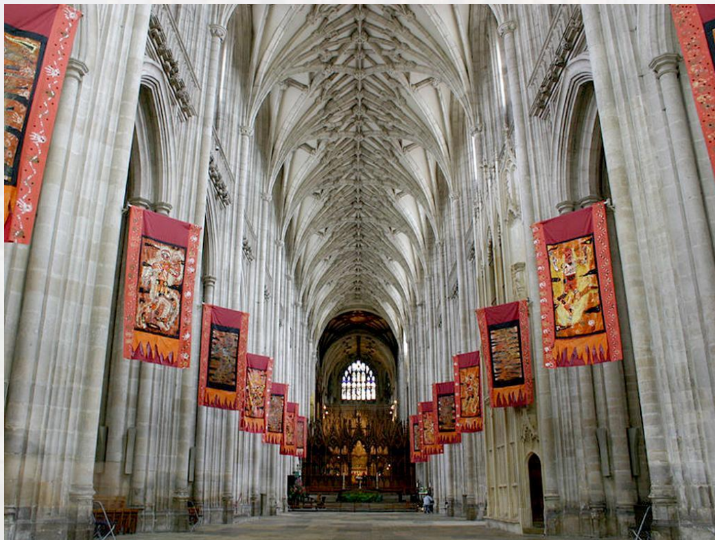
Уинчестерский собор (вид изнутри), Великобритания

Основной вид искусства романского стиля – архитектура, преимущественно церковная (каменный храм, монастырские комплексы). Сооружения романского стиля весьма многообразны по типам, по конструктивным особенностям и декору.