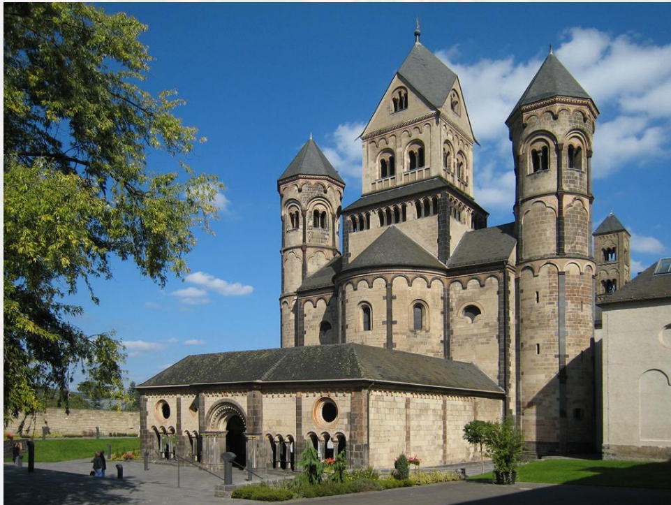
Аббатство Мария Лаах, Германия

Романский стиль (от лат. romanus – римский) – художественный стиль, господствовавший в Западной Европе (а также затронувший некоторые страны Восточной Европы) в X-XII веках (в ряде мест — и в XIII в.), один из важнейших этапов развития средневекового европейского искусства. Наиболее полно выразился в архитектуре.