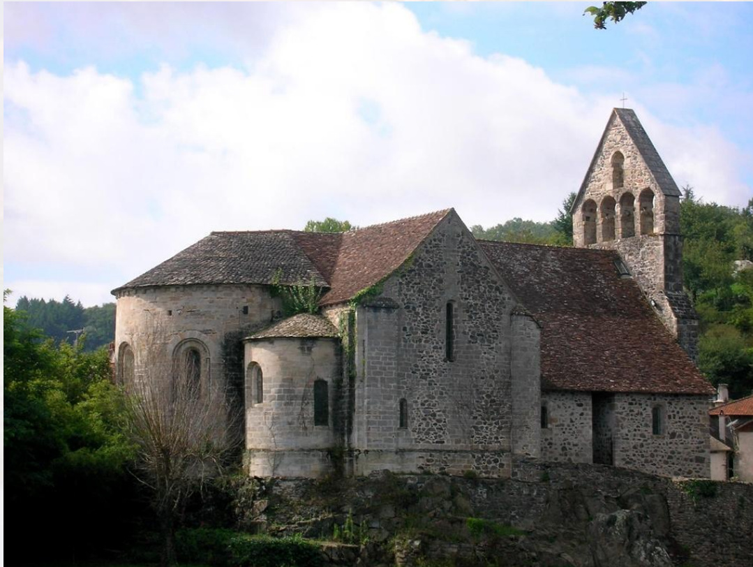
Капелла кающихся грешников

Материалом для романских построек служил местный камень, так как доставка его издалека была почти невозможна по причине бездорожья и из-за большого числа внутренних границ, которые надо было пересечь, платя каждый раз высокие пошлины.