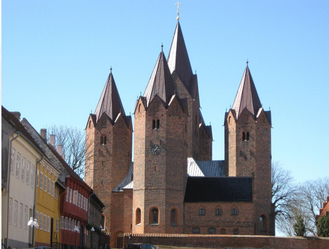
Церковь Богородицы, Дания

Вокруг неё располагались остальные постройки, составленные из простых геометрических форм – кубов, призм, цилиндров.