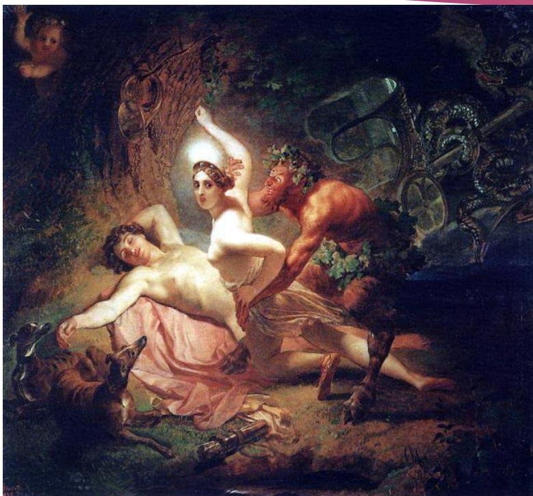
Диана, Эндимион и Сатир. 1849 Карл Брюллов