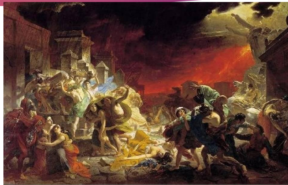
Последний день Помпеи