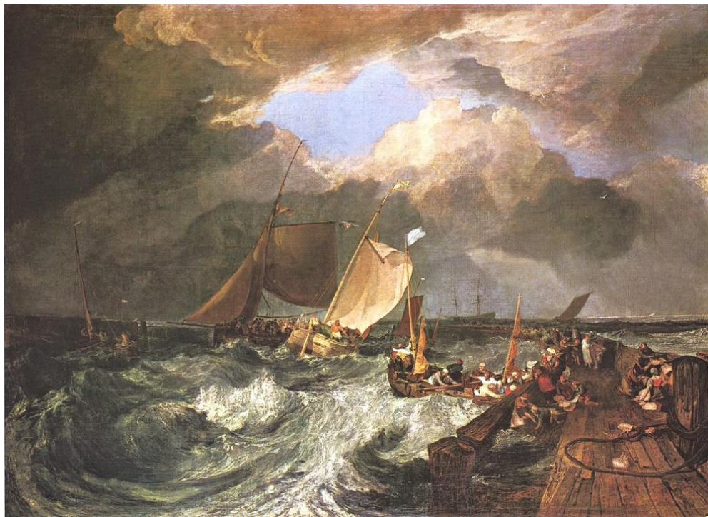
Джозеф Тёрнер "Мол в Кале: французские рыбаки готовятся к выходу в море, английский корабль причаливает". 1803 г.