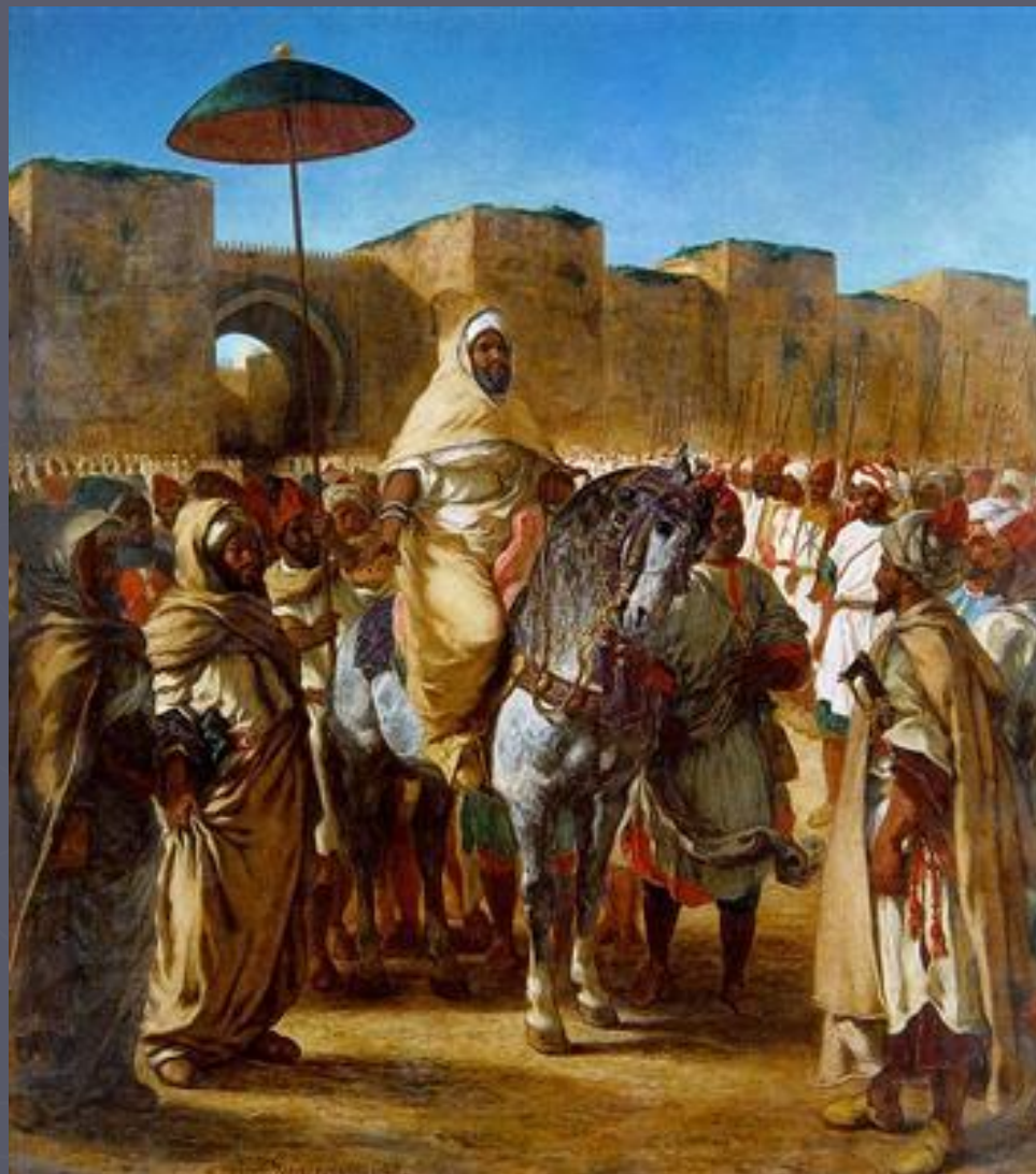
Эжен Делакруа. Султан Марокко и его свита. 1845 год.