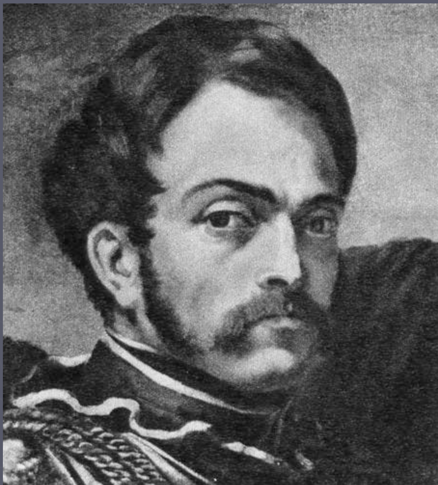
Теодор Жерико. Офицер-карабиньер.