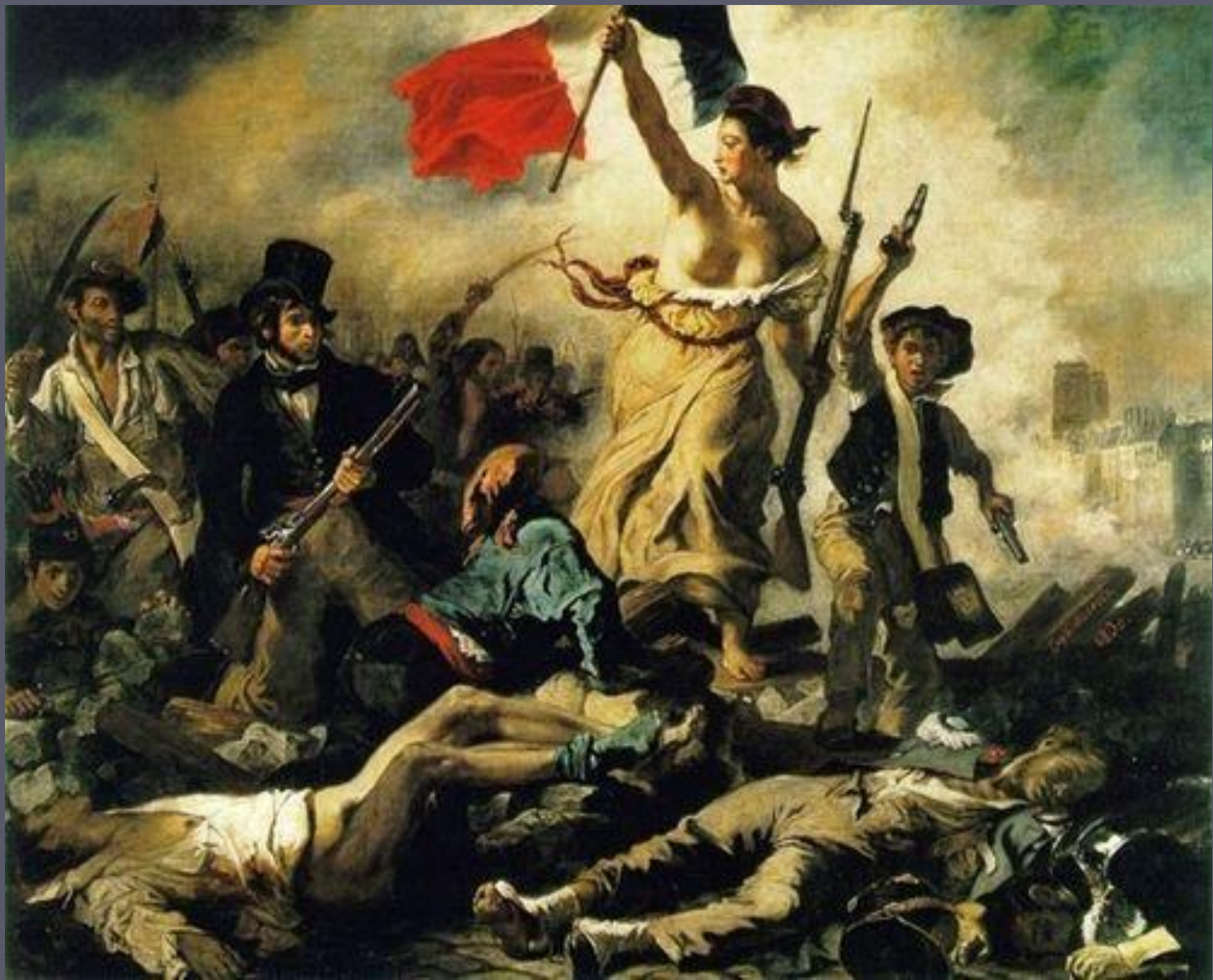
Э. Делакруа. Свобода, ведущая народ на баррикады. 1830 г.