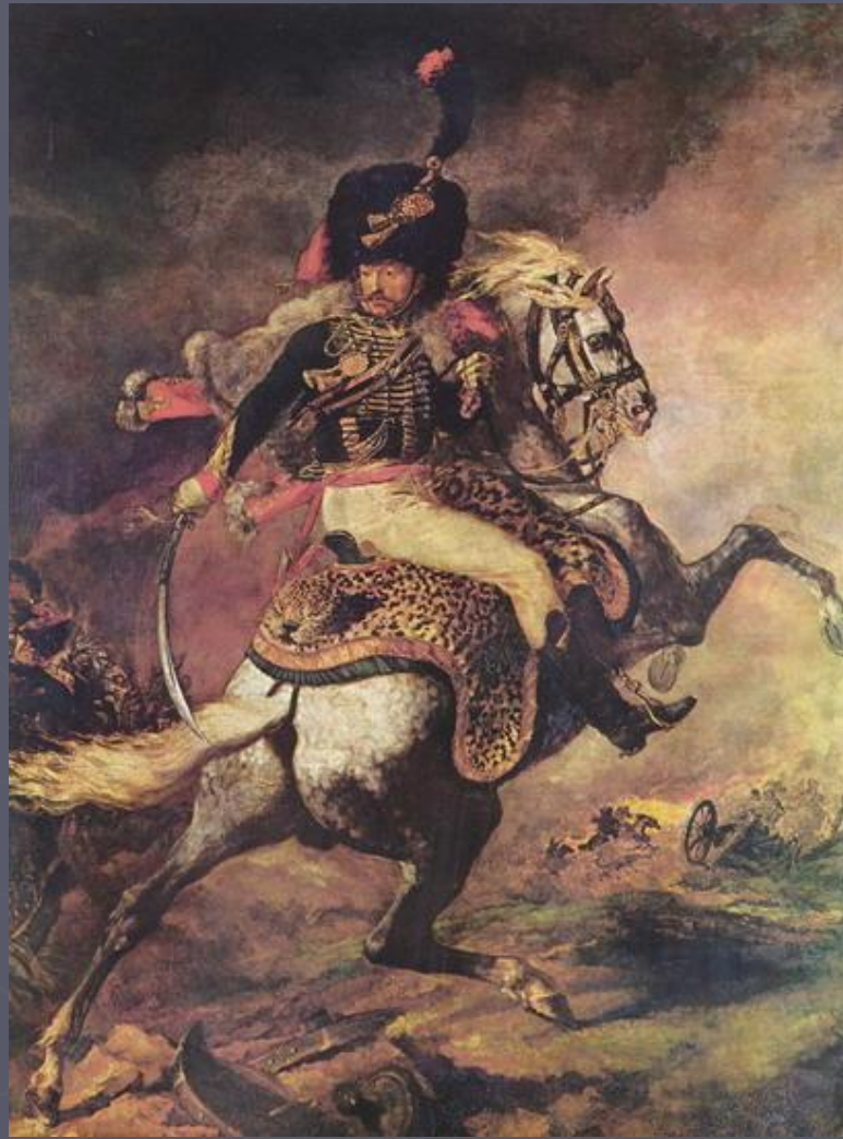
Теодор Жерико. Офицер императорских конных егерей во время атаки.