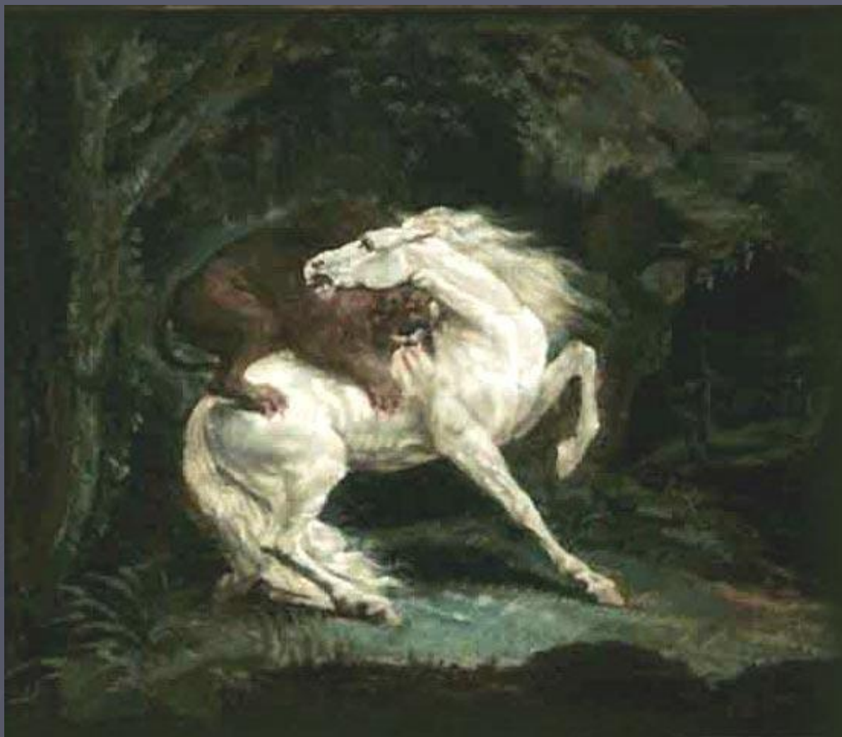
Лошадь, терзаемая львом" 1822. Теодор Жерико.