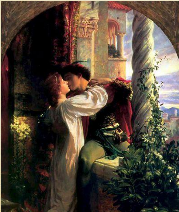
Ромео и Джульетта

Трагедия Уильяма Шекспира «Ромео и Джульетта» рассказывает о любви юноши и девушки из двух враждующих старинных родов — Монтекки и Капулетти.