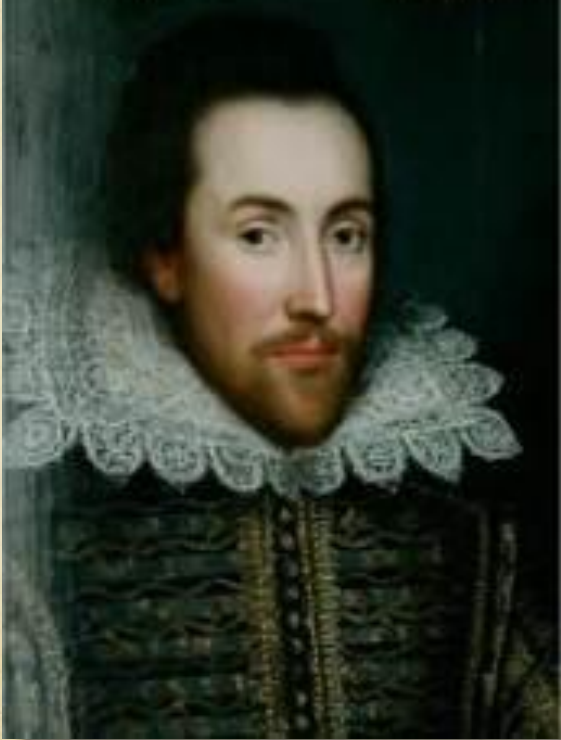
Уильям Шекспир 1564 - 1616г