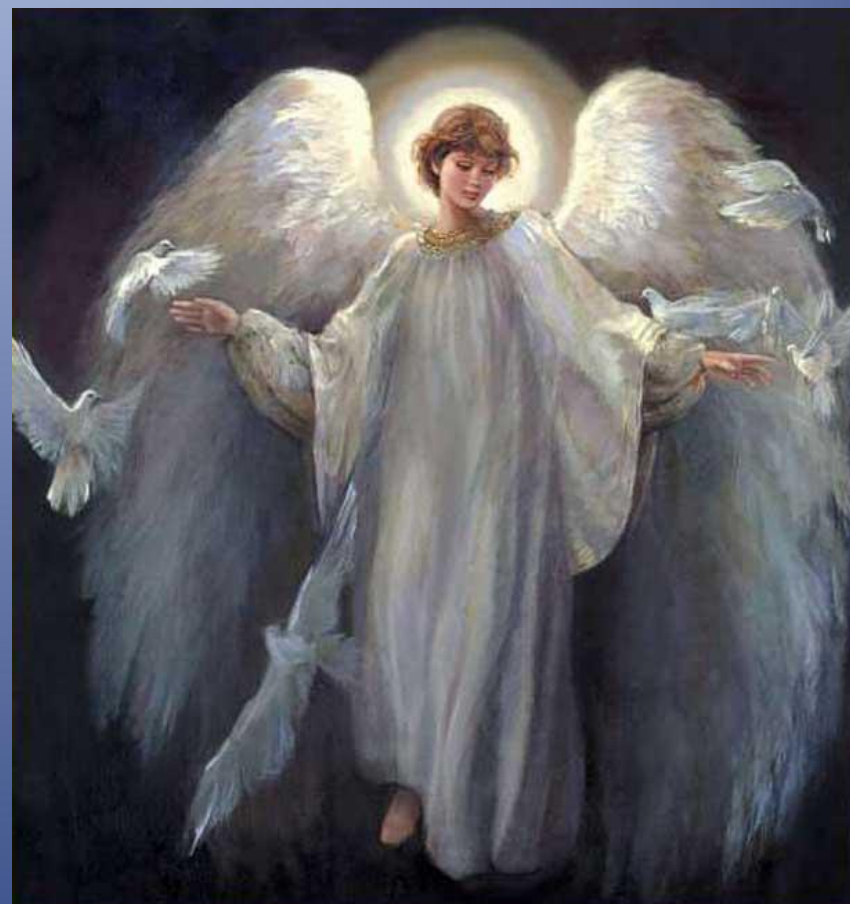
ST CLAIR -- Messenger of Peace