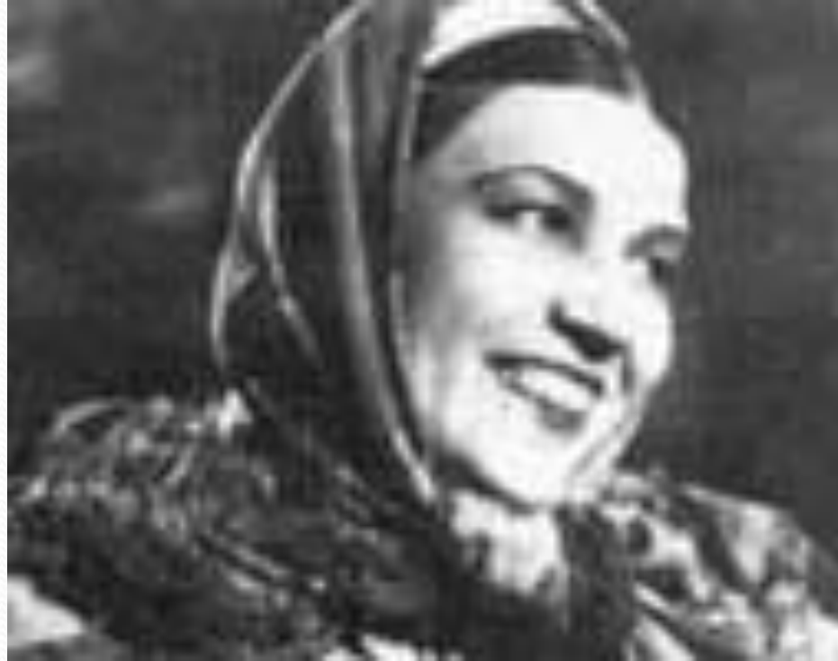
Л.А. Русланова 1940-е годы

Саратовская земля - родина прославленных исполнительниц русских народных песен: народной артистки России О.В. Ковалевой (1881-1962) и заслуженной артистки России Л.А. Руслановой (1900-1973).