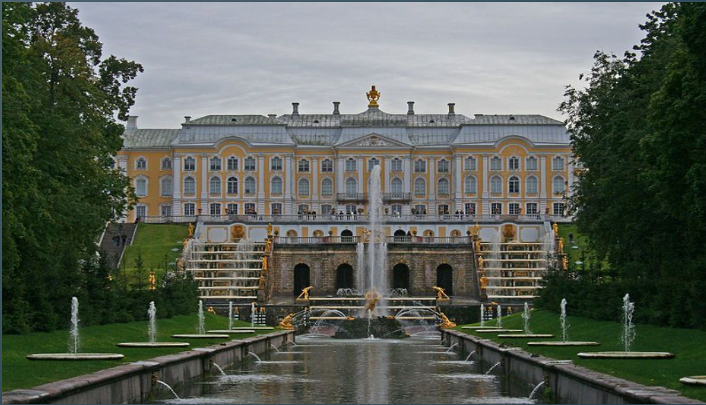
Большой дворец в Петергофе

Он был автором крупнейших дворцовых ансамблей, построенных в Петербурге и его пригородах : Зимнего дворца, Большого дворца в Петергофе , Большого Екатерининского дворца в Царском Селе, дворца Строгоновых , Смольного монастыря , Андреевской церкви в Киеве