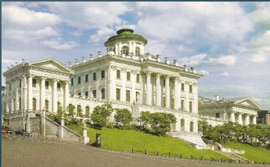
Дом Пашкова в Москве

Русский архитектор, художник, теоретик архитектуры и педагог, представитель классицизма, зачинатель русской псевдоготики, масон. Член Российской академии с 1784 года. По его проектам был построен Дом Пашкова в Москве.