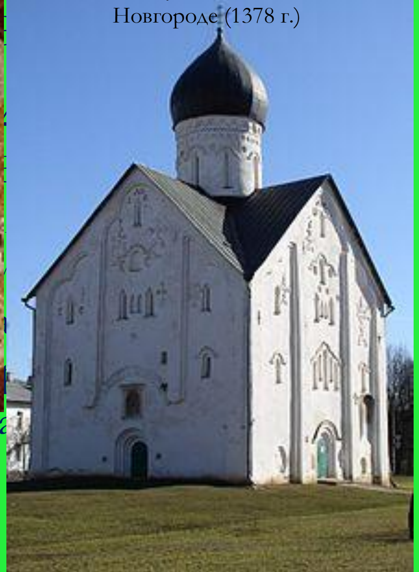
Церковь Спаса Преображения на Ильине улице в Великом Новгороде (1378 г.)

отличаются монументальностью и внутренней силой.