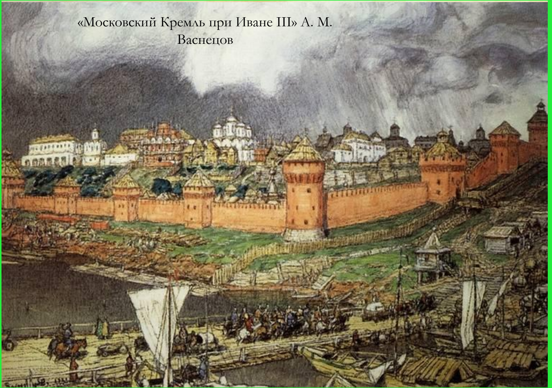
«Московский Кремль при Иване III» А. М. Васнецов