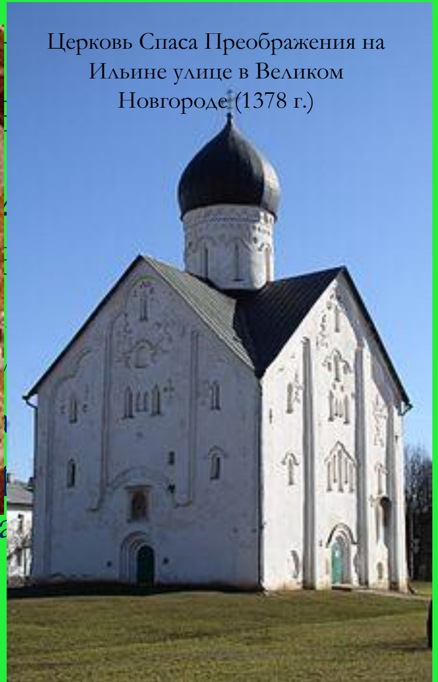
Церковь Спаса Преображения на Ильине улице в Великом Новгороде (1378 г.)

отличаются монументальностью и внутренней силой.