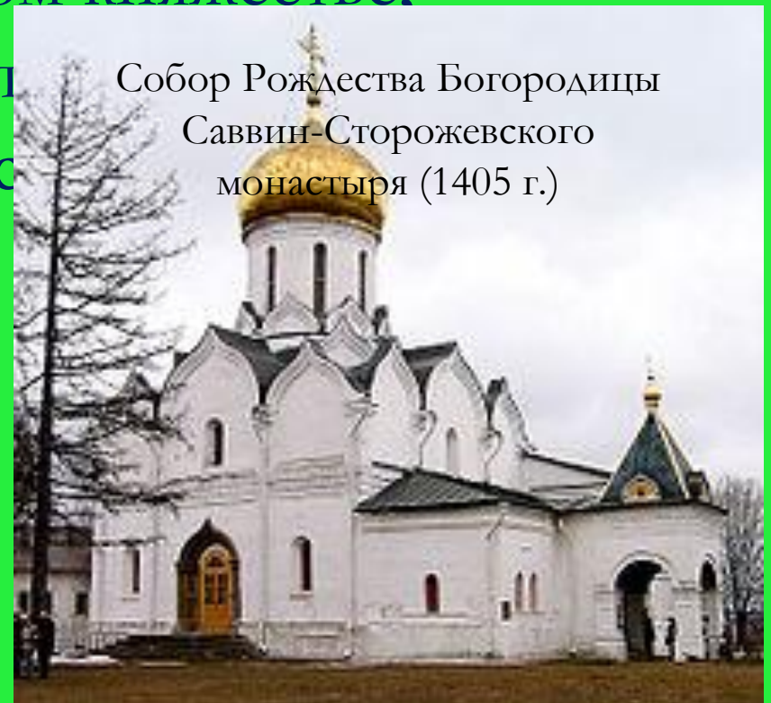
Собор Рождества Богородицы Саввин-Сторожевского монастыря (1405 г.)