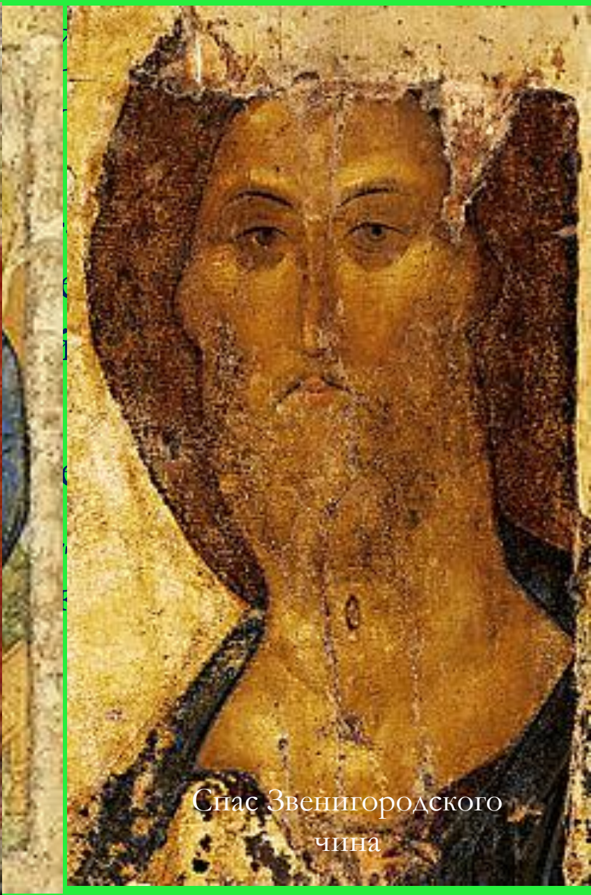
Спас Звенигородского чина