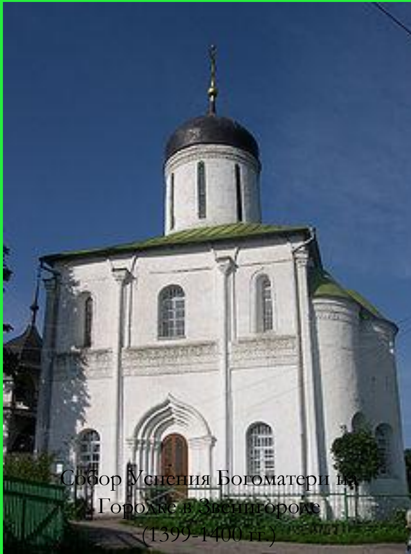
Собор Успения Богоматери на Городке в Звенигороде (1399-1400 гг.)