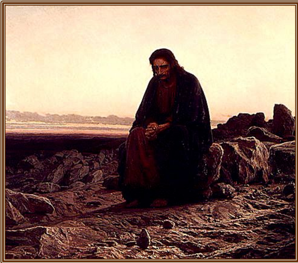
И.Н.Крамской. "Христос в пустыне".

Есть один момент в жизни каждого человека...когда на него находит раздумье – пойти ли направо или налево: взять ли с Господа Бога рубль или не уступить ни на шаг злу.