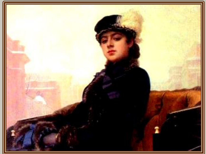
И.Н.Крамской. "Неизвестная". ГТГ, Москва, 1883г.

Загадочность «прекрасной незнакомки» входила в замысел Крамского. Он изобразил даму в пролетке на фоне Аничкова моста и туманного петербургского неба. Слегка надменный взгляд отгораживает ее красивый, изысканный мир от мира обыденного.