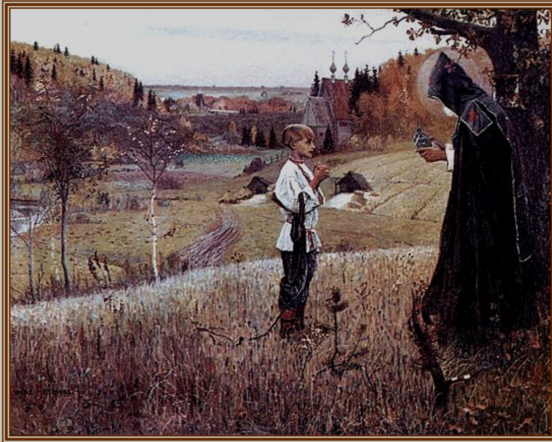
М.Нестеров "Ведение отроку Варфоломею" ГТГ, Москва, 1889-1890 гг.