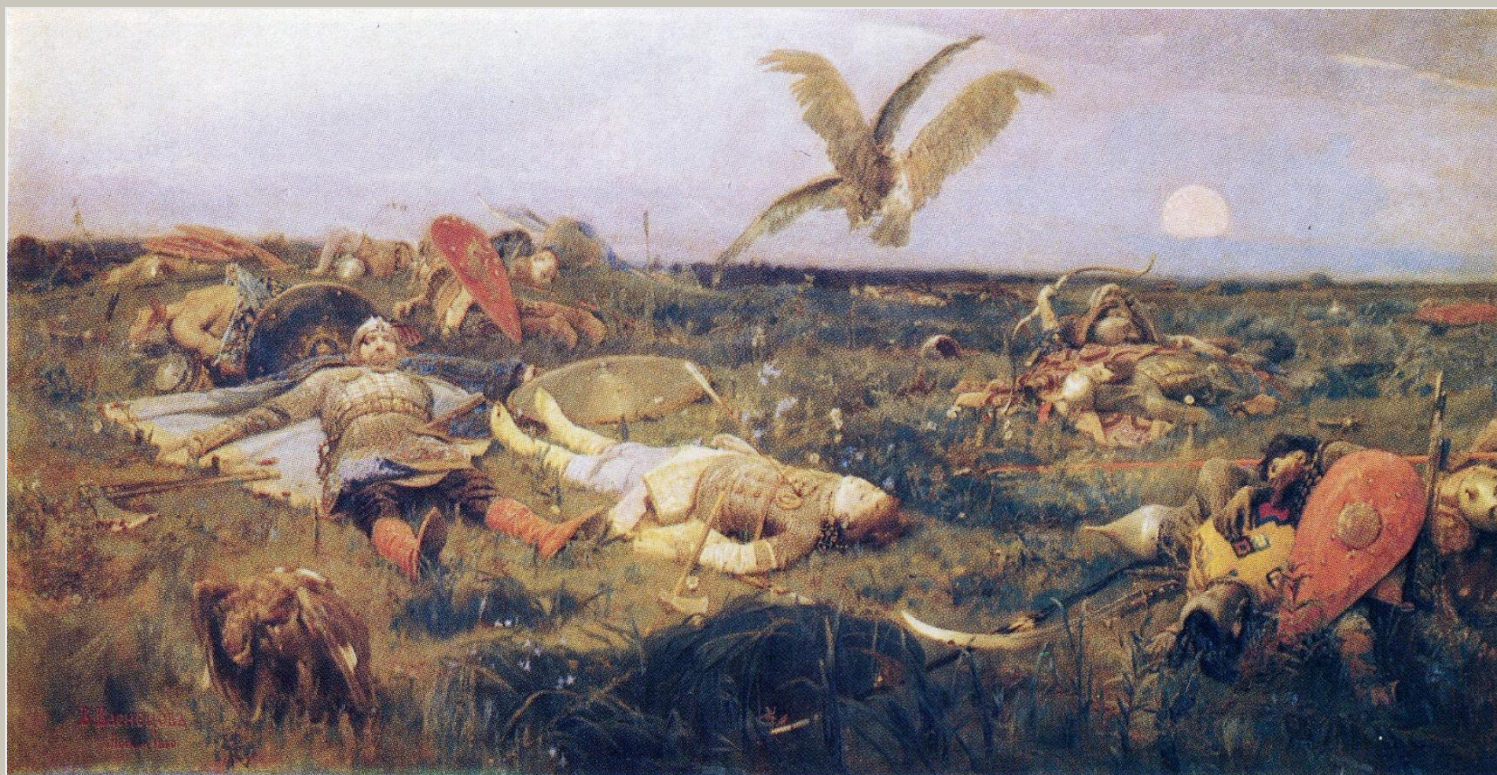
В.М.Васнецов "После побоища Игоря Святославовича с половцами".