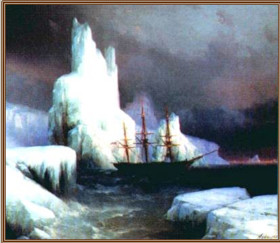
И.Айвазовский "Ледяные горы в Антарктиде."

Государственный Русский музей, Санкт-Петербург, 1853 г.