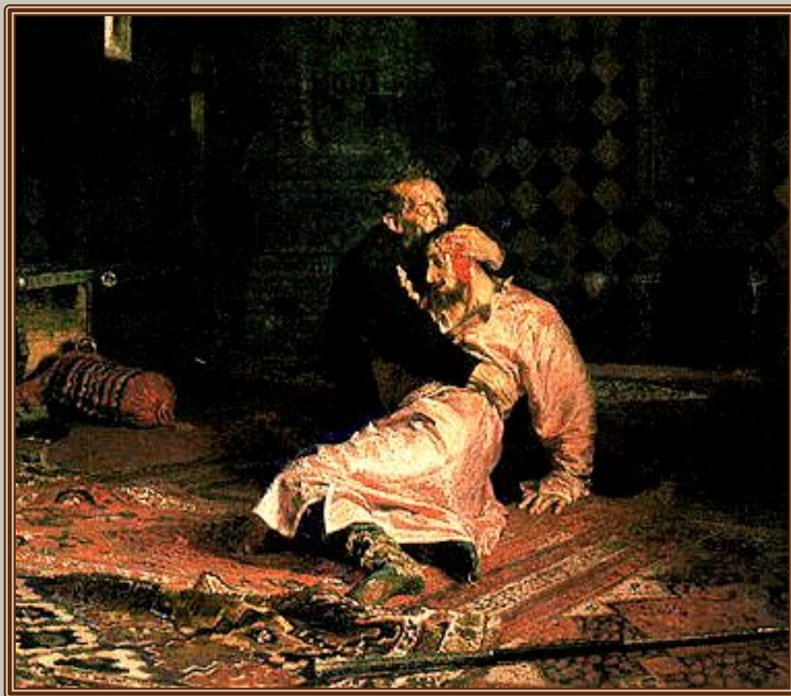
И.Е.Репин "Иван Грозный и сын его Иван 16 ноября 1581г."