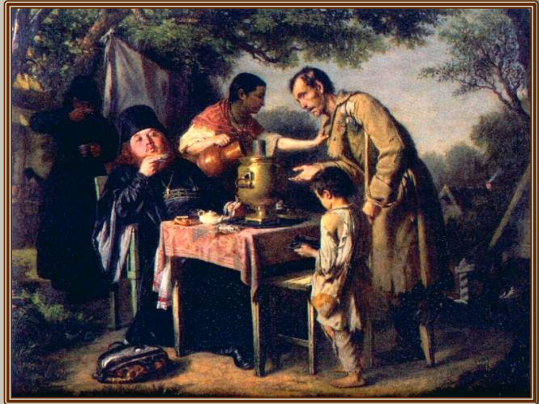
В.Г.Перов "Чаепитие в Мытищах". ГТГ, Москва, 1862г.

Основным направлением русской живописи 2-й пол. XIX в. стал критический реализм. В полотнах В.Г.Перова показаны неприглядные стороны российской действительности - деградация духовенства, чванство и пустота высших сословий, невежество забитых нуждой народных масс. В 1863 г. группа выпускников АХ отказалась писать картины на темы скандинавского эпоса, заявив что в русской действительности есть более достойные темы. В 1870 г.они создали Товарищество передвижных художественных выставок.