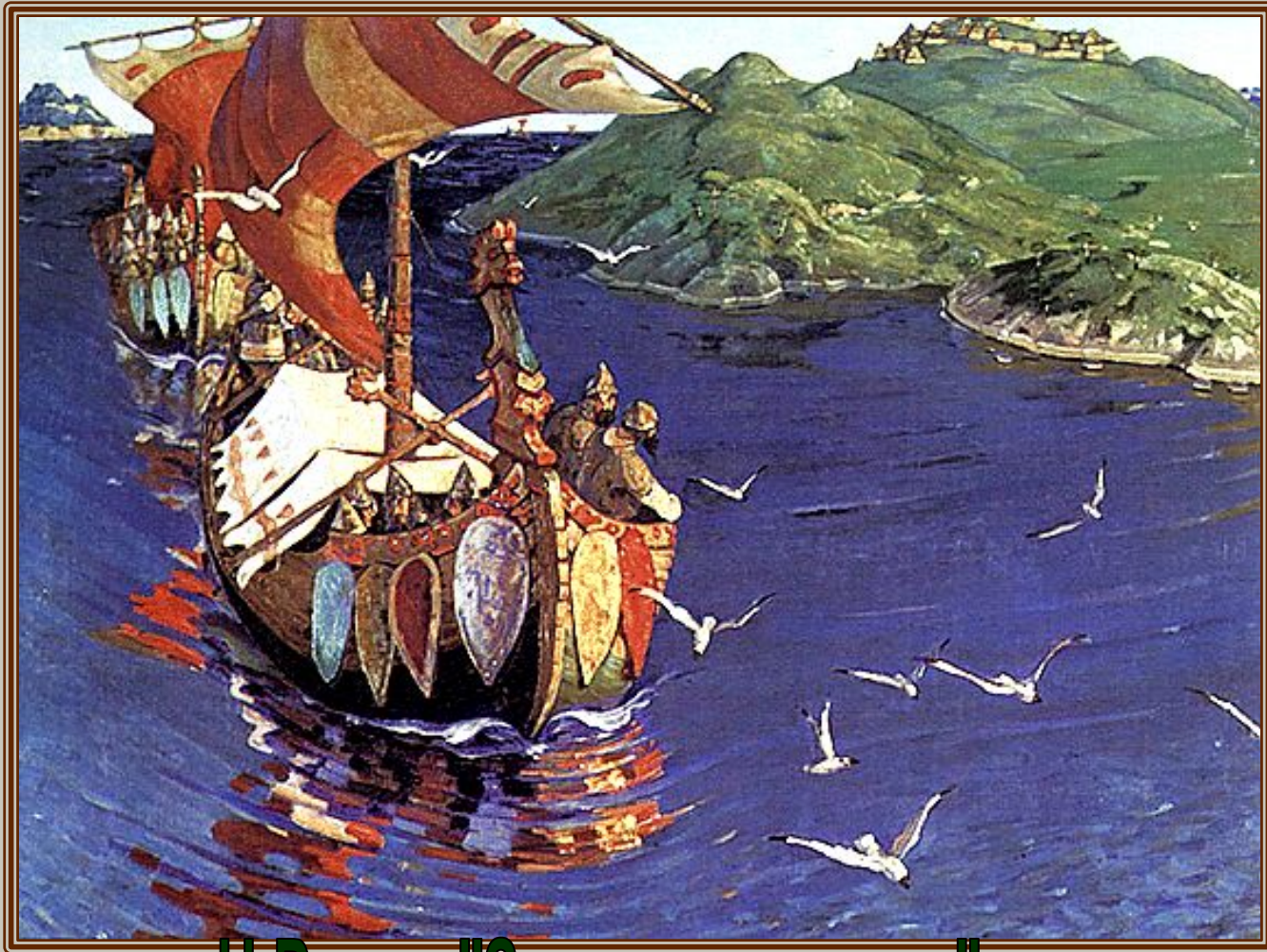
Н.Рерих "Заморские гости". ГТГ, Москва, 1901 г.