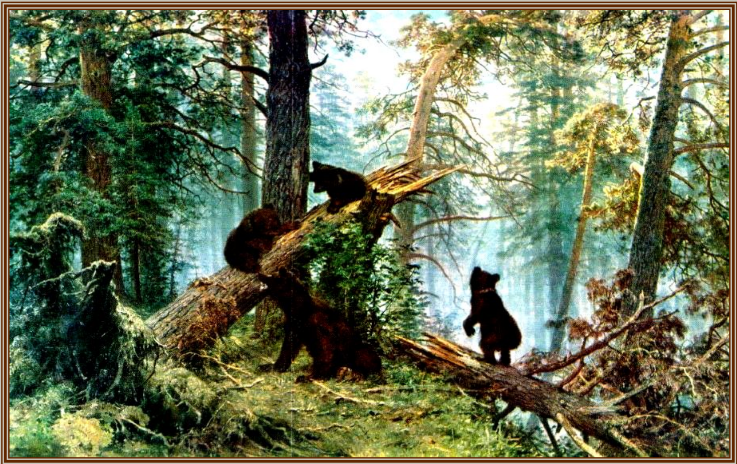
И.И.Шишкин "Утро в лесу"