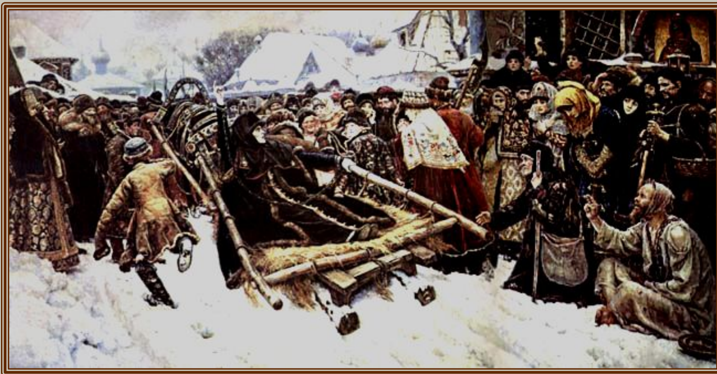
В.И.Суриков "Боярыня Морозова".