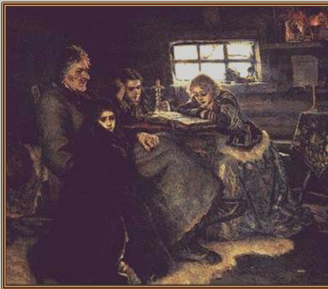
В.И.Суриков "Меньшиков в Березове".