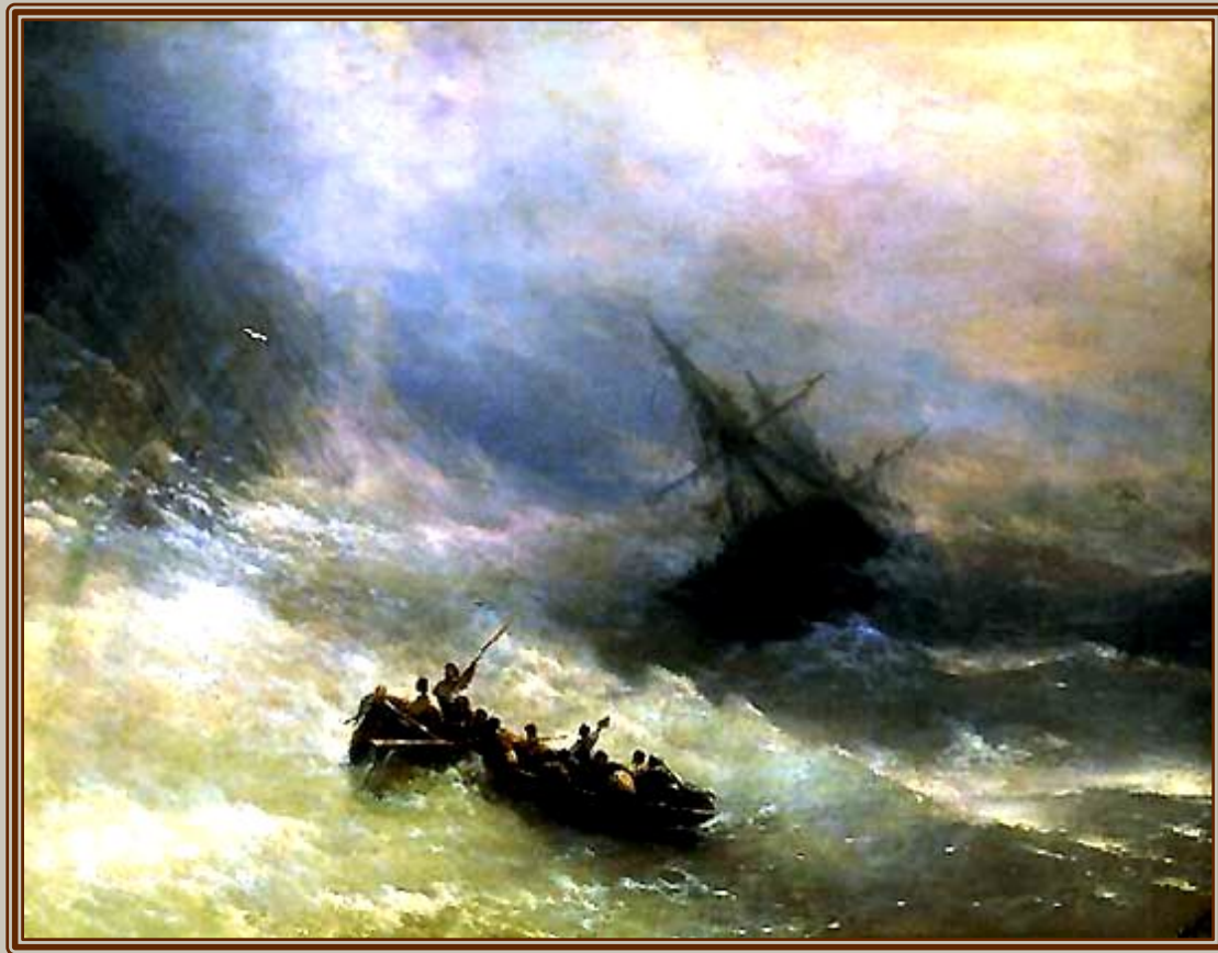
И.Айвазовский "Девятый вал"

Государственный Русский музей, Санкт-Петербург, 1850 г.