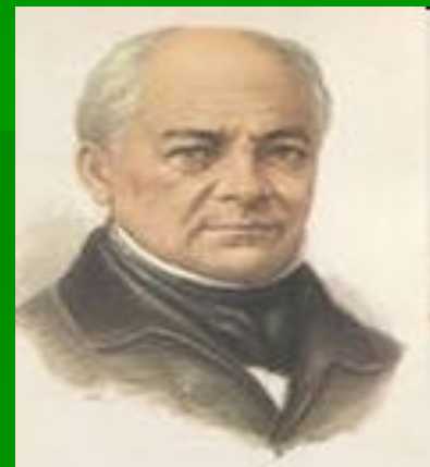
А.Н.Верстовский (1799 -1862)