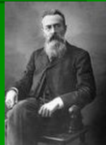
Н.А.Римский – Корсаков.