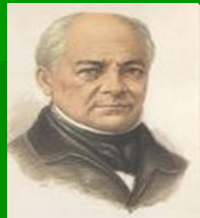
А.Н.Верстовский (1799 -1862)