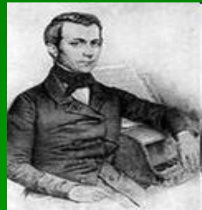
А.Л.Гурилёв (1803 -1858)