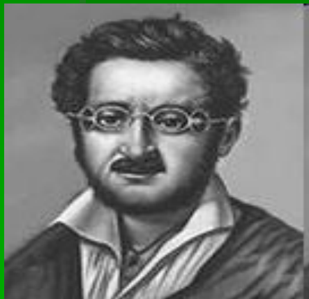
А.А.Алябьев (1787 – 1851)