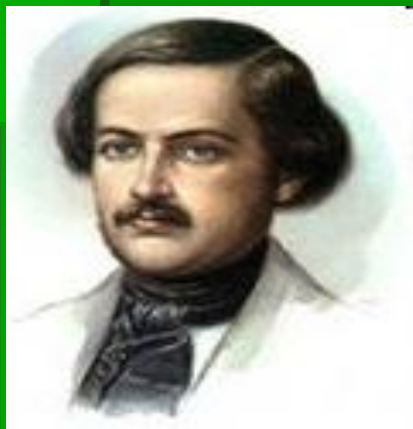
А.Е.Варламов (1801- 1848)