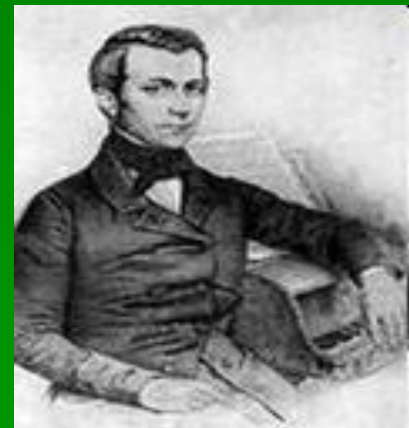
А.Л.Гурилёв (1803 -1858)