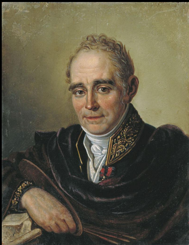
Портрет В.Боровинковска работы И. С. Бугаевского-Благодарного (1825)