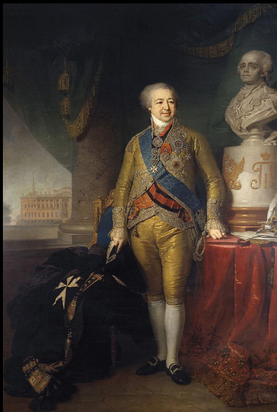
Портрет вице-канцлера князя А. Б. Куракина