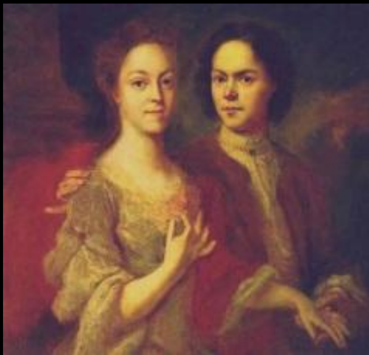
Автопортрет с женой