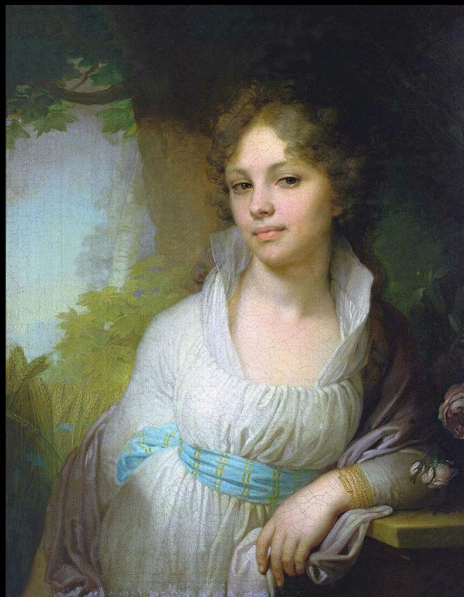
Портрет М. И. Лопухиной