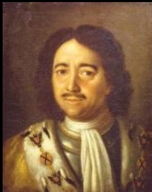
Портрет Петра I