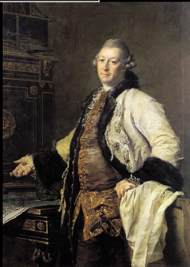
Портрет архитектора А. Ф. Кокоринова.