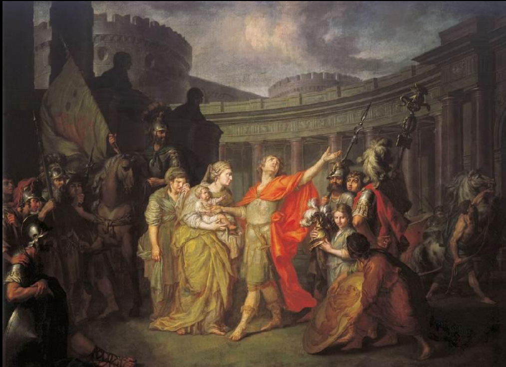
Прощание Гектора с Андромахой