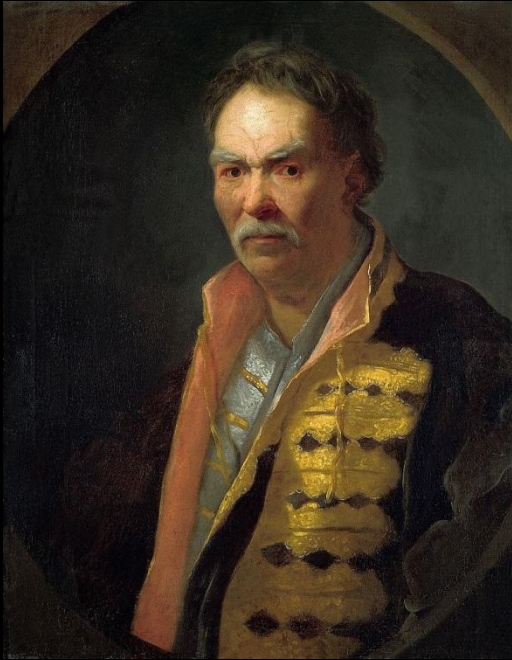
Портрет напольного гетмана, 1720-е. Государственный Русский музей, Санкт-Петербург.