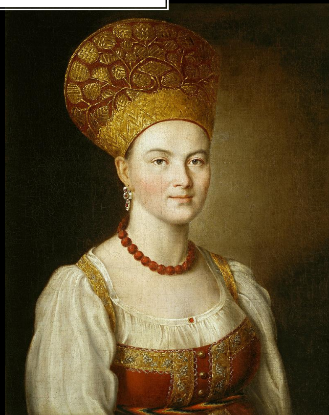
Портрет неизвестной крестьянки в русском костюме, 1784