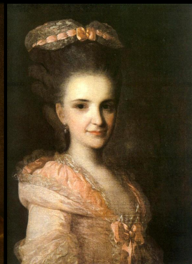
«Портрет неизвестной в розовом»