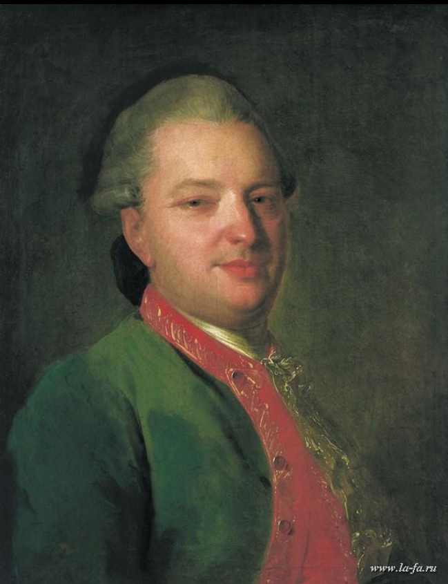
Портрет В. И. Майкова