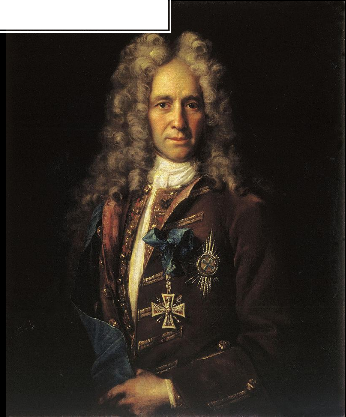
Портрет канцлера Головкина