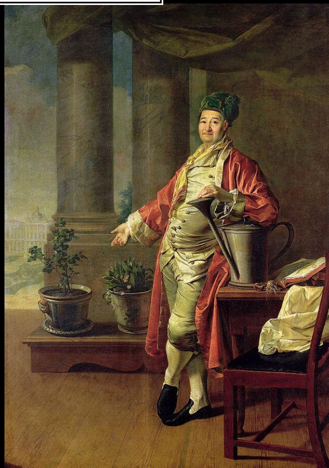
Портрет П. А. Демидова