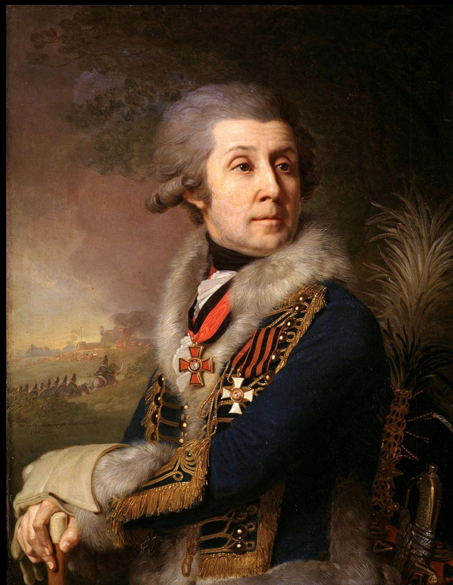
Портрет генерал-майора Ф. А. Боровского