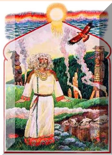
Бог солнца Хорос