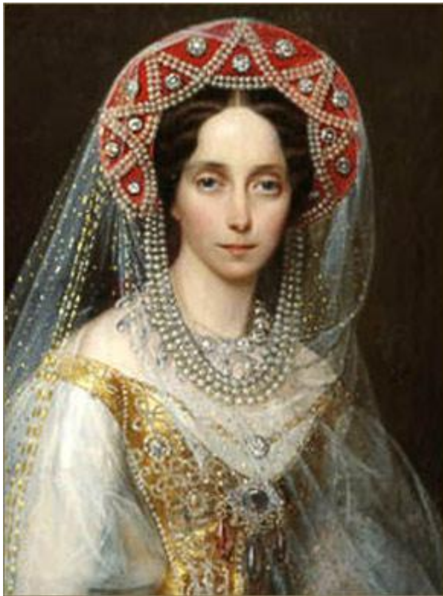
Портрет императрицы Марии Фёдоровны. Иван Макаров.