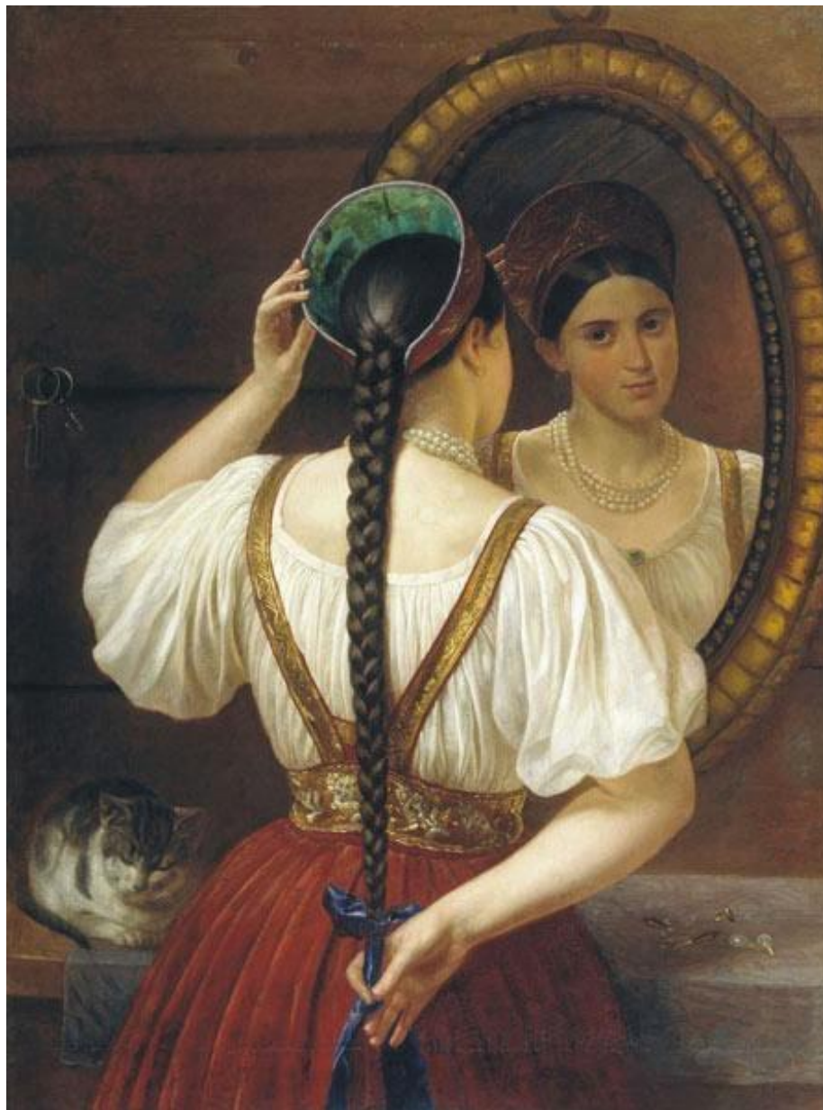
Девушка у зеркала. Художник Филипп Будкин