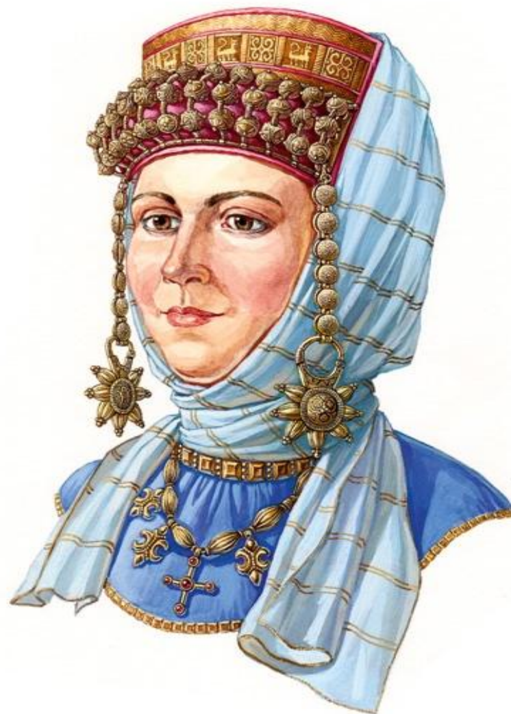
Русская женщина в уборе с колтами на рясках и очельем, вторая половина XII века.