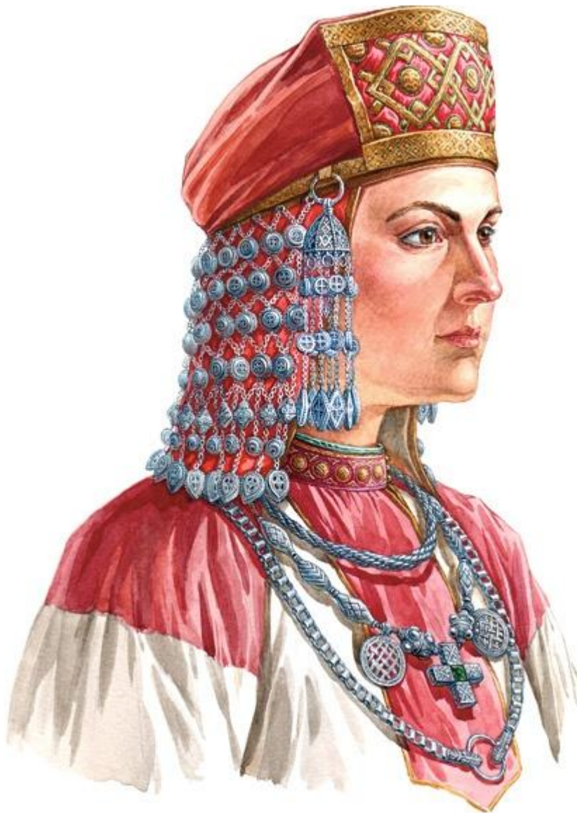
Славянская женщина в уборе с колоковидными подвкладом Старой Рязани и Новгородской земли, в. п. XII в.)