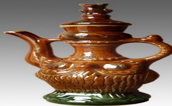
сосуд «Лесная сказка»

Производство было основано в 1860-х гг. крестьянами братьями Оводовыми. Всероссийская известность пришла к нему во II половине XIX века. Преостановилось во время Первой мировой войны и в 20-е годы. С 1934 года производство возродилось на Скопинской фабрике художественных изделий. В 1969 году на базе артели «Керамик» была создана Скопинская фабрика художественной керамики, сейчас — ЗАО «Скопинская художественная керамика» и ЗАО «Скопинский сувенир».