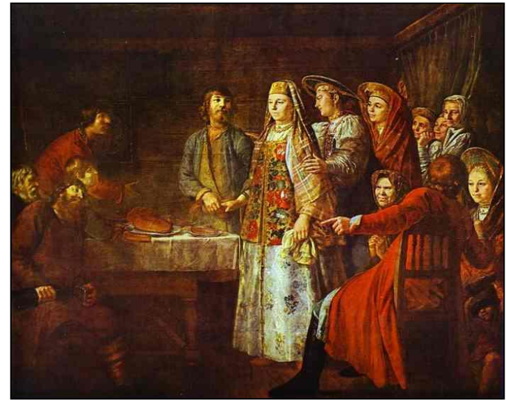
М. Шибанов. Брачный договор. 1777г.