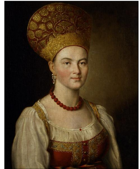
И.П. Аргунов. Портрет неизвестной в русском костюме 1784г.